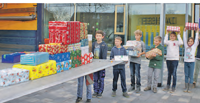
Die Kinder der Steiblinger Gemeinschaftsschule starten ihren Weihnachtspäckchenkonvoi.