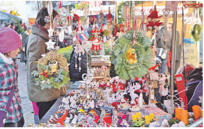
Mit Kerzen, Tannengrün, Misteln, Gebäck, Deko, Geschenken, Glühwein und vielem mehr laden zahlreiche Weihnachtsmärkte am Wochenende die Besucher zum Bummeln ein.

Hegau (sam). Alle Jahre wieder öffnen pünktlich zum Advent allüberall im Hegau die Weihnachtsmärkte ihre Pforten. Premiere feiert am Freitag, 28. November, ab 11 Uhr der erste »Singer Hüttenzauber« auf dem Rathausplatz. Auch Tengen lädt am 28. November von 14 bis 19.30 Uhr rund ums historische Stadttor zum Bummel über den beschaulichen Nikolausmarkt ein. In der Gailinger Hochrheinhalle können sich die Besucher beim dritten weihnachtlichen Kreativmarkt am 29. November vom besonderen adventlichen Angebot bezaubern lassen. Mehr als 60 Hobbykünstler aus der Region bieten hier von 10 bis 18 Uhr ihre kunst- und liebevoll selbst gefertigten Produkte an. Das außergewöhnliche Angebot reicht von weihnachtlichen Dekorationen und Holzkrippen, über Gebäck, Strickwaren und Basteleien, Schmuck, Steine oder Mineralien bis hin zu einer großen Auswahl an Adventskränzen.