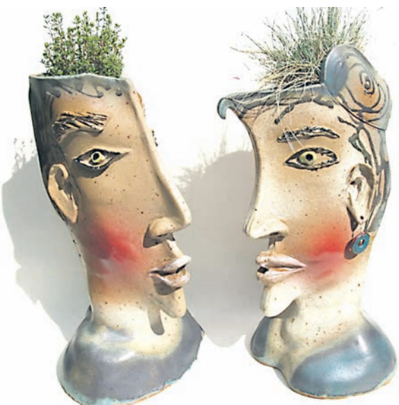
Kunst und Kunsthandwerk ist bei der »Augenweide« rund ums »Zollhaus« in Ludwigshafen zu sehen.

Mehr Infos unter www.zollhaus-sommer-augeuweide.de