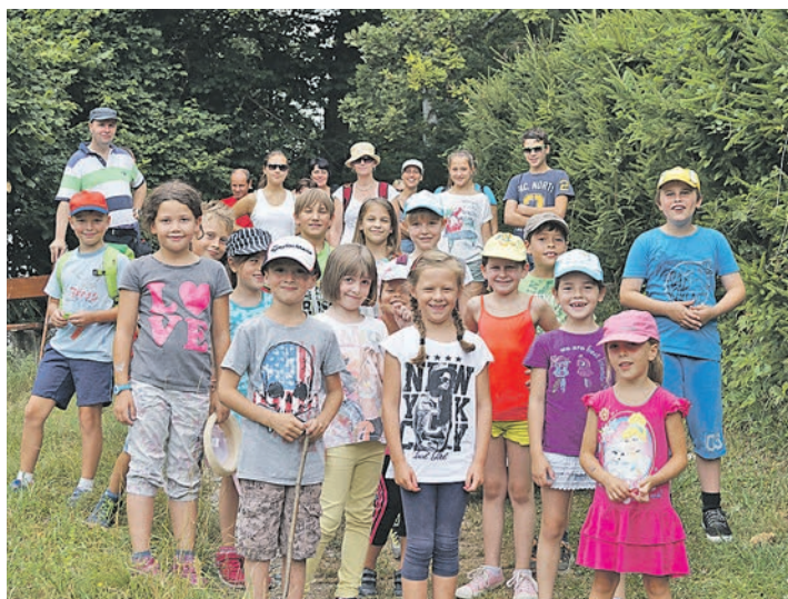
Die Kinder der Anton-Sohn-Schule in Zizenhausen stellten sich zusammen mit ihren Eltern, Geschwistern und Lehrern zum Erinnerungsfoto an die »Young Walker's Tour 2015« auf dem Wanderweg von der Bleiche unterhalb der Heidenhöhlen in Zizenhausen in Richtung Hindelwangen auf. Sie hatten die kurze Sechs-Kilometer-Strecke gewählt.

Mit dem Wandertag verbunden war der 13. Kinder- und Jugendwandertag, international als »Young Walker's Tour 2015« bezeichnet. Und dieser Wandertag für Kinder und Jugendliche ist wichtig für die Volkssportart Wandern, wenn diese ursprüngliche Erfolgsgeschichte nicht allzu schnell zum Auslaufmodell werden soll. Von der Anton-Sohn-Grundschule in Zizenhausen und ihren 58 Kindern waren immerhin 20 zum