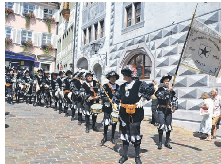
Bei strahlendem Sonnenschein zog der Fanfarenzug durch die historischen Gassen.