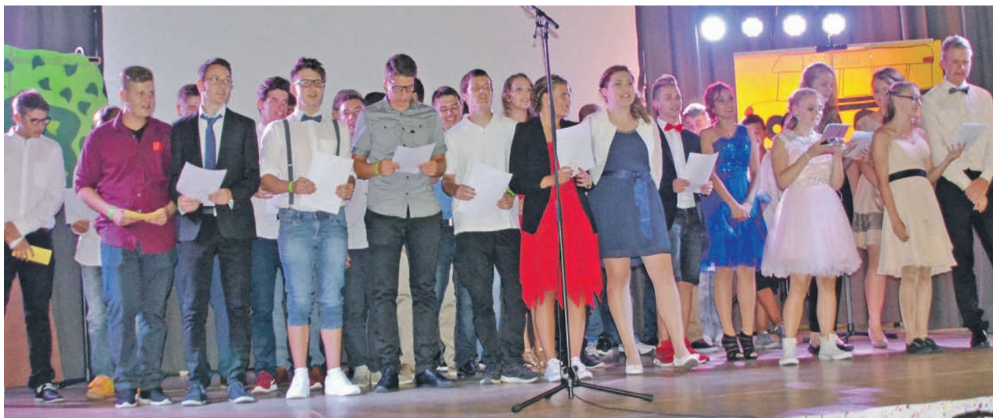
Farbenfroh, kunterbunt und voller Farbtupfer war die Abschlussfeier der neunten und zehnten Klassen an der Gemeinschaftsschule Eigeltingen. Das Fest stand unter der Überschrift »Farbtupfer«.