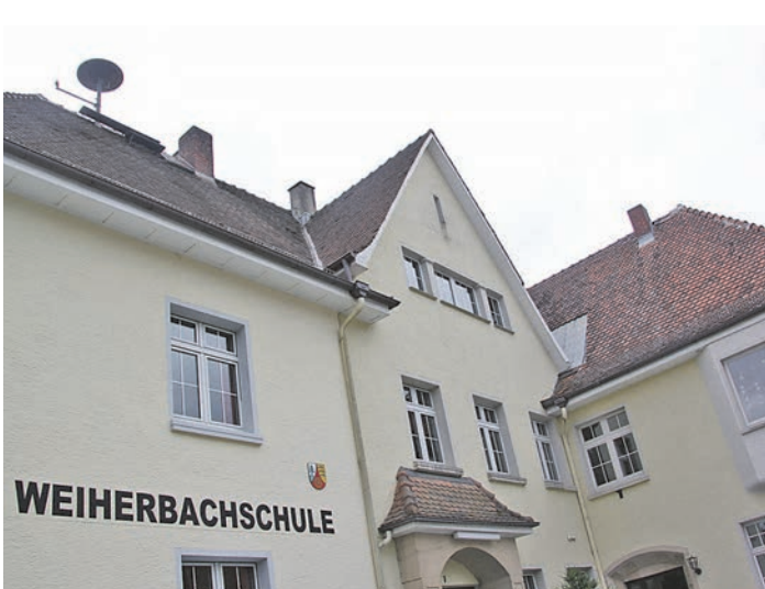
Die »Weiherbachschule« in Mühlingen-Zoznegg hat erneut einen Antrag auf Umwandlung in eine Gemeinschaftsschule gestellt. Sie erhofft sich dadurch eine Steigerung der Schülerzahlen und einen längerfristigen Erhalt des Standorts.

Dennoch möchte Mühlingens Bürgermeister Manfred Jüppner »nicht die Flinte ins Korn werfen«. Er sei zu Anfang des Jahres mit den Eltern im Kultusministerium in Stuttgart gewesen und habe nachgefragt, ob eine erneute Antragstellung Sinn machen würde. Diese Frage sei von den Verantwortlichen bejaht worden. Also wur-