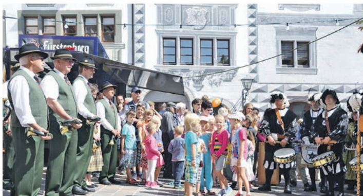
Auch die kleinen Besucher hatten ihren Spaß bei der Eröffnung des 36. Engener Altstadtfestes.