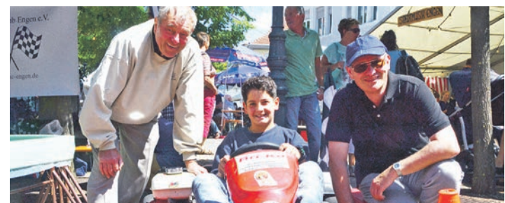
Zum ersten Mal als Teilnehmer dabei war der Engener Automobil-Club, dessen Stand bei Fahrzeug-Fans besonders beliebt war.