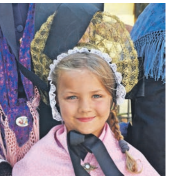
Die kleine Trachtendame war bei der Festeröffnung mit dabei.

zug, den Jagdhornbläsern und der Bürgerwehr das »Fest der Engener Vereine«, wie er betonte. Insgesamt sorgten 64 Teilnehmer für ein buntes und abwechslungsreiches Unterhaltungsprogramm in der Altstadt. Ob Alphornbläser, Feuershow, Hundesport, Bierbrauen oder Live-Musik: Für jeden Ge-