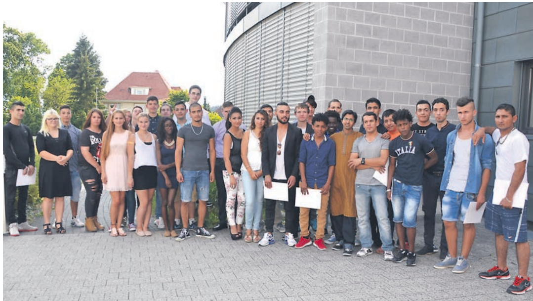
Absolventen des Berufseinstiegsjahres (BEJ), der Vorqualifizierung Arbeit-Beruf (VAB) und der Vorqualifizierung Arbeit-Beruf ohne Deutschkenntnisse (VABO) wurden am Stockacher Berufsschulzentrum mit der Zeugnisausgabe verabschiedet.