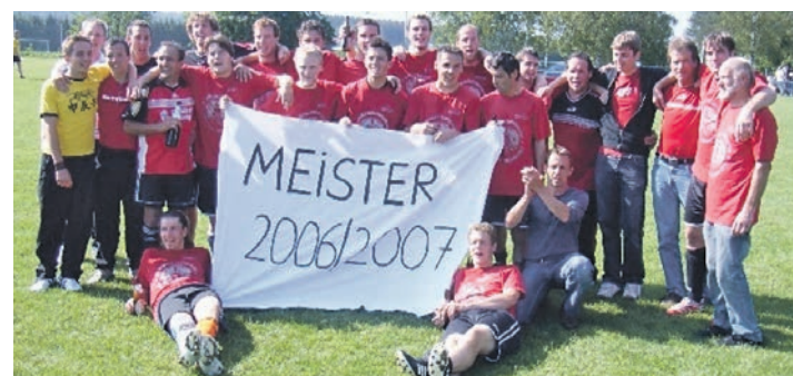
Nach konstant guten Leistungen wurde der FC Bodman-Ludwigshafen in der Saison 2006/07 Meister und stieg nach fünf Jahren wieder in die Bezirksliga auf.

Mehr Informationen zu dem Jubelverein stehen im Internet unter der Adresse www.fc-bodman-ludwigshafen.de .