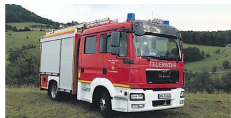
Das neue Löschfahrzeug wird am Samstag in Anselmingen eingeweiht.