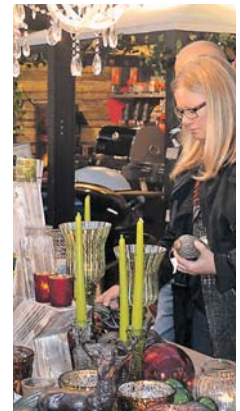
Die neusten Deko-Trends für Weihnachten wurden bei Mauchs Ladies-Night gezeigt.

Impressionen gibt es im Internet unter bilder.wochenblatt.net .