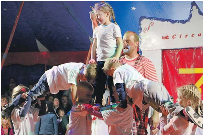
Ihr 50-jähriges Jubiläum feierte die Sonnenrainschule mit einem Zirkusprojekt. Kinder balancierten dabei gekonnt auf einem Drahtseil. swb-Bild: pud

Radolfzell (swb). Zum Glück nur leichte Verletzungen hat am Mittwochmittag, gegen 16.10 Uhr, ein achtjähriges Kind bei einem Unfall an der Kreuzung Sankt-Meinrads-Platz/Haselbrunnstraße erlitten. Die Lenkerin eines VW bog vom Sankt-Meinrads-Platz kommend nach links in die Haselbrunnstraße ab und dürfte dabei das bei grüner Ampel die Haselbrunnstraße überquerende Kind übersehen haben, gab die Polizei nun bekannt. Durch die Berührung stürzte das Kind auf die Fahrbahn und zog sich dabei Verletzungen zu, die ambulant versorgt wurden.