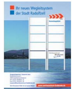
Das neue Gewerbeleitsystem in Radolfzell soll die Orientierung erleichtern.