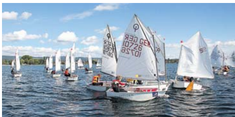
36 Kinder in ihren Booten waren bei der letzten Wettfahrt der Optiliga voller Elan auf dem Wasser.