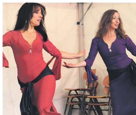
Zum ersten Mal trat die Bauchtanzgruppe Knobloch auf dem Öhninger Dorffest auf. Vor allem die kleinen Tänzerinnen bekamen viel Applaus.