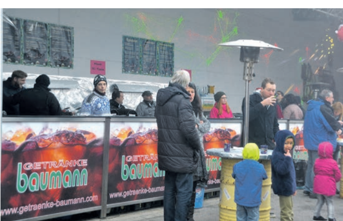
Ungemütliche Enge. Nein - das muss nicht sein. Jeder, der etwas essen oder trinken wollte, hatte beim Weihnachtsmarkt in Eigeltingen genügend »Spielraum«. Dafür sorgte auch die lange Bar mit kulinarischen Highlights.