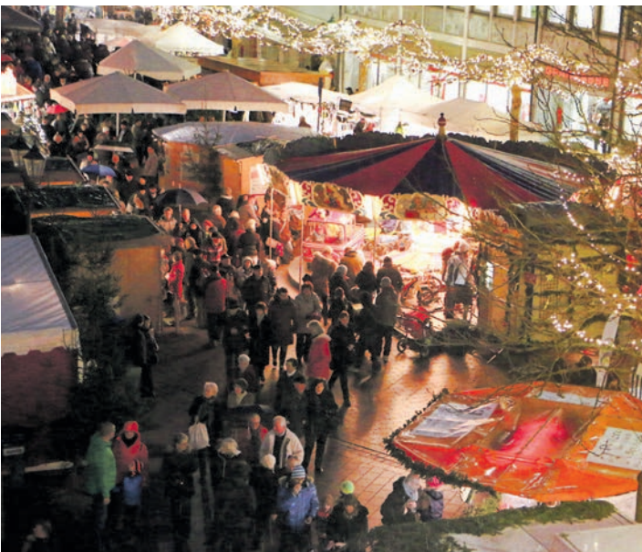
Der 40. Radolfzeller Christkindlemarkt bot wieder einmal viele Attraktionen für Jung und Alt. Insbesondere in den Abendstunden bummelten viele Besucher über den Marktplatz.