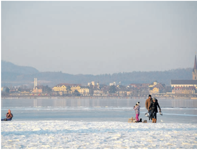
Was macht Radolfzell so liebenswert: Im großen Weihnachtsgewinnspiel sucht das WOCHENBLATT gemeinsam mit seinen Kooperationspartnern aus dem Radolfzeller Handel die besten Slogans. Einsendeschluss ist der Dienstag, 15. Dezember.

»Radolfzell hat's«. »Radolfzell kann's«. »Radolfzells starke Seiten«. »Radolfzells schöne Shopping Seiten«. Der Fantasie sind keine Grenzen gesetzt, entsprechend unbegrenzt sind die Möglichkeiten. Im Rahmen-