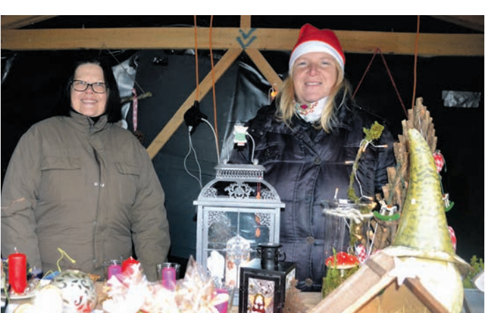
Ein bisschen Idealismus ist auch dabei. Wer auf einem Weihnachtsmarkt Waren anbietet, ist mit Spaß und Freude bei der Sache.