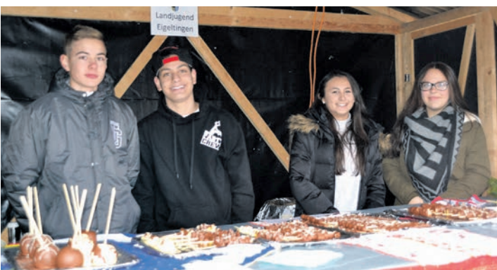
Der gute Geschmack ist jede Sünde wert. Süßes und Schmackhaftes bot die Landjugend auf dem Weihnachtsmarkt in Eigeltingen an.