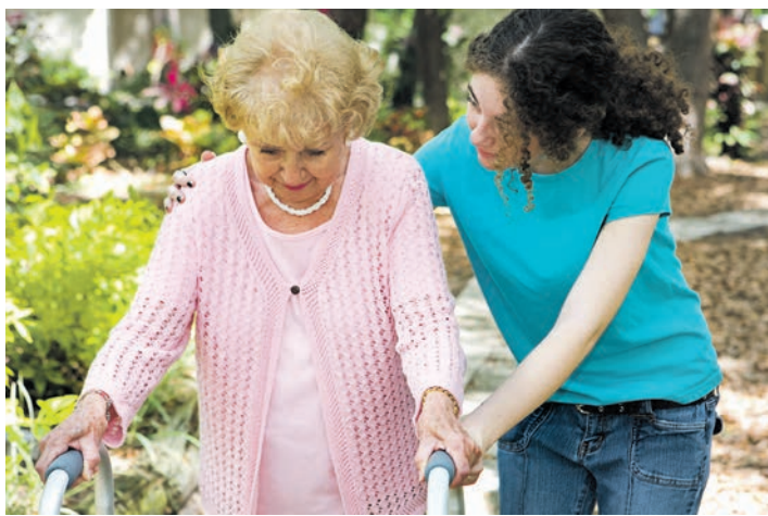
Glücksgriff für Senioren: Der Gemeinderat ebnete den Weg für die neue Seniorenwohnanlage samt Pflegegruppen.