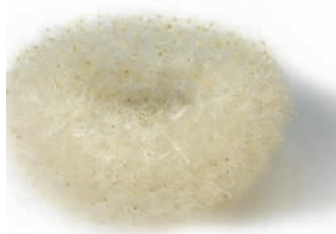
Artischockenschale 2012