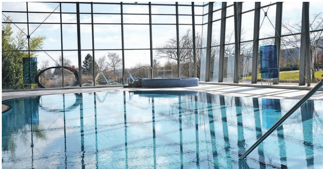
Frisch saniert steht das Hallenbad Campen und Gästen zur Verfügung.

Dem stimmte CDU-Ratsherr Hertrich zu: »Große Einheiten bergen Probleme, dann lieber in homöopathischen Dosen, das ist verträglicher.« Bedenken, dass der geplante Kunstrasenplatz neben dem Sportplatz den Flüchtlingsunterkünften zum Opfer Falle, konnte Metzler zerstreuen: »Da passen beide hin.« Nun wird die Gemeinde die Flächen auf ihre Eignung prüfen, gleichzeitig an Privateigentümer appellieren, Flächen für einen begrenzten Zeitraum zur Verfügung zu stellen und an die Pfarrgemeinden herantreten und um Unterstützung bei der Suche nach geeignetem Wohnraum für Asylsuchende zu bitten.