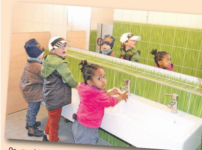
Da macht Händewaschen Spaß: Im neuen, kindgerechten Sanitärraum lachen Giraffen und Zebras von den Wänden.

– Die Kindertagesstätte in Watterdingen bietet in zwei Gruppen (Igel und Mäuse) 50 Plätze, davon sind fünf Plätze für Kinder unter drei Jahren reserviert. – Der An- und Ausbau der Kita dauerte knapp neun Monate und kostet rund 460.000 Euro. – Angeboten werden eine Ganztagsbetreuung von Montag bis Freitag von 7 bis 17 Uhr, die Betreuung mit verlängerten Öffnungszeiten montags von 7 bis 14 Uhr sowie die Regelöffnungszeiten Montag bis Freitag von 7.30 bis 12.30 Uhr und Dienstag bis Freitag von 14 bis 16.30 Uhr.