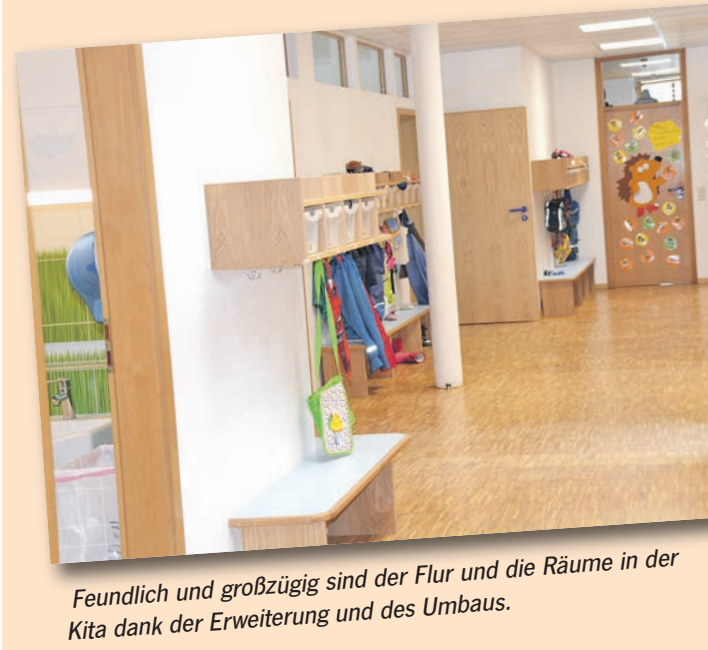
Freundlich und großzügig sind der Flur und die Räume in der Kita dank der Erweiterung und des Umbaus.