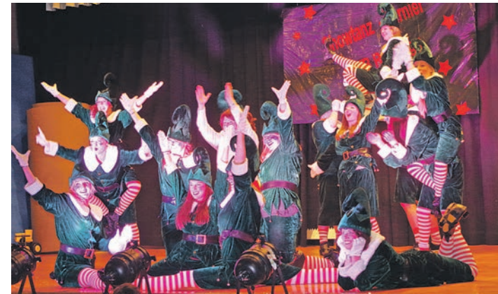
Die »Gruppe Jazz for Fun« aus Denkingen gewann den diesjährigen Showtanzabend des VfB Randegg in der Grenzlandhalle.