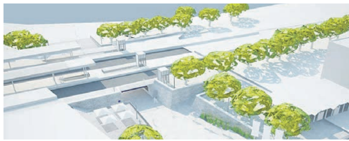
So sieht die mögliche Seetorquerung im Entwurf aus.