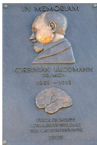
Korbinian Brodmann, gebürtiger Liggersdorfer und berühmter Hirnforscher, ist Namensgeber und Pate des neuen Schulgebäudes.

wicklung hin zur Ganztagesbetreuung wäre am bisherigen Standort nicht möglich gewesen. Eine Sanierung wäre zu teuer gekommen.