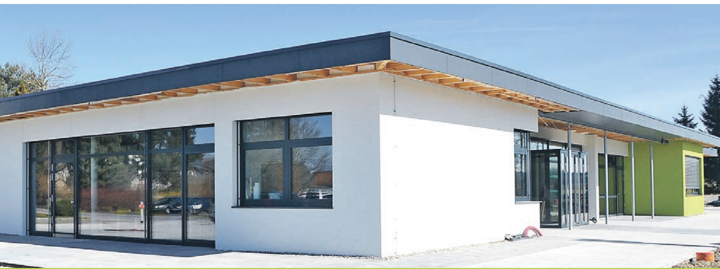
Die neue Korbinian-Brodmann-Schule in der Hauptstraße 49 in Liggersdorf wird am Samstag, 21. März, ab 10 Uhr mit einem spannenden Programm eingeweiht. Der Name geht auf den berühmtesten Sohn der Gemeinde, den Hirnforscher Korbinian Brodmann, zurück, der 1868 in Liggersdorf geboren wurde.