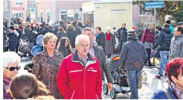
Tausende von Besuchern nutzten den ersten verkaufsoffenen Sonntag in Radolfzell – die »See(h)reise«, um zwischen See und Seemaxx zu bummeln und einzukaufen.

Mehr Impressionen von der See(h)reise gibt es unter www.wochenblatt.net