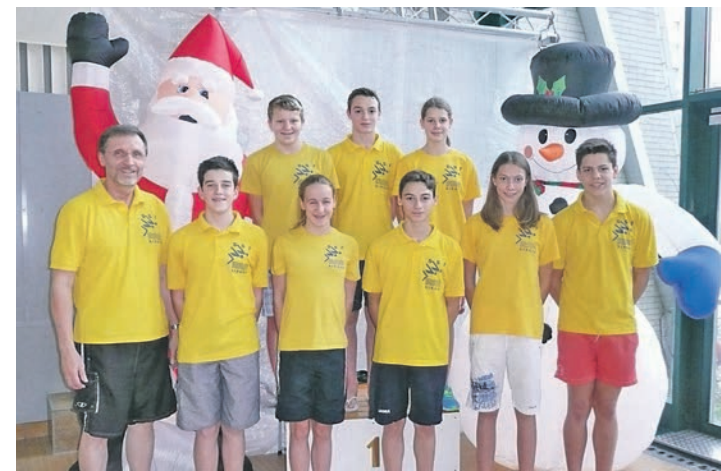
Mit einem Titel, sieben Medaillenrängen und vielen Bestzeiten schlugen sich die Schwimm-Sport-Freunde (SSF) Singen zum Jahresabschluss in Dresden auszeichnet.

Singen/Dresden (swb). Beim 24. Dresdner Christstollenschwimmfest, das aufgrund der 50-m-Bahn und der elektronischen Zeitnahme als Qualifikationswettkampf für die großen nationalen Meisterschaften im Frühjahr 2015 dient, gingen das achtköpfige Team der Schwimm-Sport-Freunde (SSF) Singen von Trainer Norbert Mayer 52 Mal an den Start, erschwamm zum Jahresabschluss nochmals dreißig persönliche Bestzeiten und erschwamm einen Titel, sieben Medaillenränge sowie neun weitere Urkundenplätze (Rang vier bis sechs). Mehrere SSFler konnten bereits Normen für die baden-württembergischen Langstrecken-Meisterschaften Ende Januar in Freiburg Qualifikationen erschwimmen. Moritz Schmid qualifizierte sich jetzt bereits in 17:20,06 Minuten (Norm 18:48,40) für die »Süddeutschen« Ende Februar erneut in Dresden über 1500 m Freistil, Vanessa Steigauf sogar schon doppelt in 10:08,60 Minuten