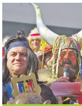
Auch die Narrenvereine haben zusammengefunden. Sie setzen seit einigen Jahren den Bürgermeister in einer konzertierten Aktion ab.

Landkreis Konstanz bildet. Dabei war die Zeit bis zur Ehe ein durchaus schwieriges Unterfangen. Denn in der Zeit der Kommunalreform wollten die Worblingen eigentlich nicht mit den Rielasingern zusammengehen.