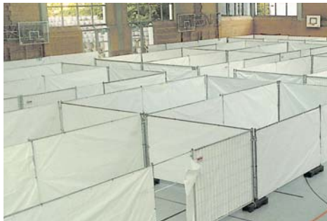
Die Kreissporthalle in Singen dient als Flüchtlingsunterkunft für 195 Menschen. Die mit Trennwänden abgetrennten Bereiche bieten ein Mindestmaß an Privatsphäre.

Ende Oktober, Anfang November beginnt die Belegung der Kreissporthalle mit 195 Flüchtlingen. Hierzu wird am Montag, 19. Oktober um 19 Uhr in der Aula des Hegau-Gymnasiums eine Informationsveranstaltung stattfinden, bei der auf die Sorgen der Bürger eingegangen werden soll. Eine ähnliche Veranstaltung ist zeitnah in der Südstadt geplant. Mit dabei auch Vertreter des Helferkreises und der Polizei. Ob am nächsten Montag, wie von