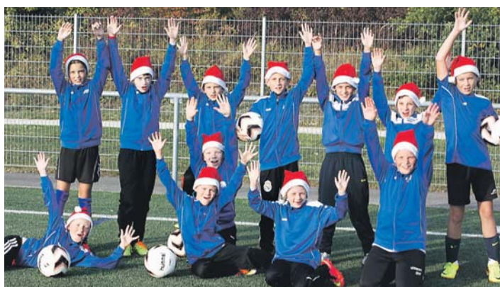
Die Aktionsgemeinschaft sucht für eine Schaufensteraktion noch Vereine, die sich weihnachtlich ablichten lassen. Die E-Jugend des FC Radolfzell macht schon einmal vor, wie ein solches Foto aussehen könnte.

Aktionsgemeinschaft plant originelle Aktionen – und sucht noch Mitwirkende!