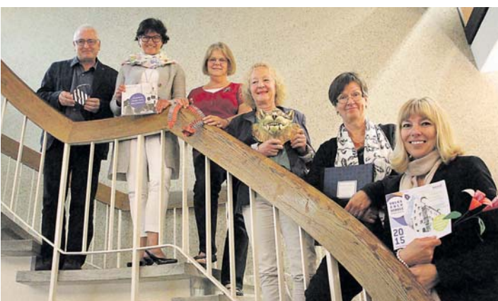
Neben den klassischen Angeboten für Sprachen, Gesundheitsbildung, Kreativität, Allgemeinbildung und EDV gibt es bei der Vhs in Radolfzell zahlreiche Möglichkeiten, seine Kompetenzen zu erweitern und zu stärken.