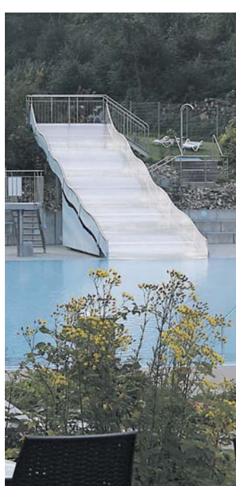
Nun ist das Freibad witterungsbedingt leer - doch in der vergangenen Saison kamen 58.180 Badegäste. swb-Bild: Stadt

Auch mit Blick auf die Events ziehen die Stadtwerke als Betreiberin der Stockacher Bäder eine positive Bilanz. So wurde etwa eine Open-Air-Filmnacht auf die Beine gestellt. Und zum Saisonabschluss wurde für 100 treue Badegäste ein Frühstück in fröhlicher Runde organisiert. »Wir waren sehr überrascht, wie viele Badegäste sich über diese Einladung gefreut und ihren ausdrücklichen Dank ausgesprochen haben«, erklärt Stadtwerke-Chef Jürgen Fürst. »Das war ein gelungener Abschluss einer langen und schönen Badesaison.« Witterungsbedingt wurde das Freibad durch das Hallenbad an