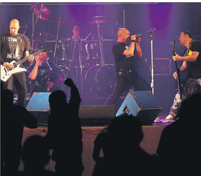
»Let's rock!« lautete am vergangenen Samstag in der Heidenfelshalle Windegg die Devise, als der Verein »Landlust« seine erste »Night of Rock« feierte. Mit den »Böhse Neffen«, einer Böhse Onkelz Cover-Band und »Stoned Henge«, einer Stoned Metal Cover-Band, wartete der Veranstalter gleich mit zwei in der Region bekannten Bands auf, die für eine musikalisch hochwertige Performance sorgten.