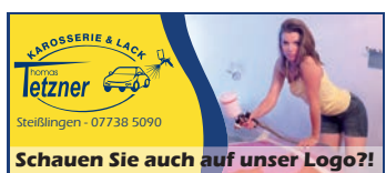
Schauen Sie auch auf unser Logo?!

Die drei Gruppen der Unterstufe werden ein bunt gemischtes Programm mit weihnachtlichen Lied- und Instrumentalsätzen vortragen und freuen sich schon auf viele Zuhörer. Eltern, Geschwister, Verwandte, Freunde und natürlich die Bevölkerung sind herzlich dazu eingeladen. Das Konzert dauert ca. eine Stunde und ist auch für kleinere Kinder sehr geeignet. Der Eintritt ist frei, um eine Kollekte am Ausgang wird gebeten.