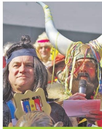
Auch die Narrenvereine haben zusammengefunden. Sie setzen seit einigen Jahren den Bürgermeister in einer konzertierten Aktion ab.

Landkreis Konstanz bildet. Dabei war die Zeit bis zur Ehe ein durchaus schwieriges Unterfangen. Denn in der Zeit der Kommunalreform wollten die Worblingen eigentlich nicht mit den Rielasingern zusammengehen.