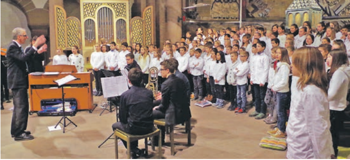
Ein eindrucksvolles Bild bot beim Festkonzert der starke Chor der 5. Klassen des Wöhler-Gymnasiums in der Herz-Jesu-Kirche.

Bilder vom Konzert gibt es unter bilder.wochenblatt.net