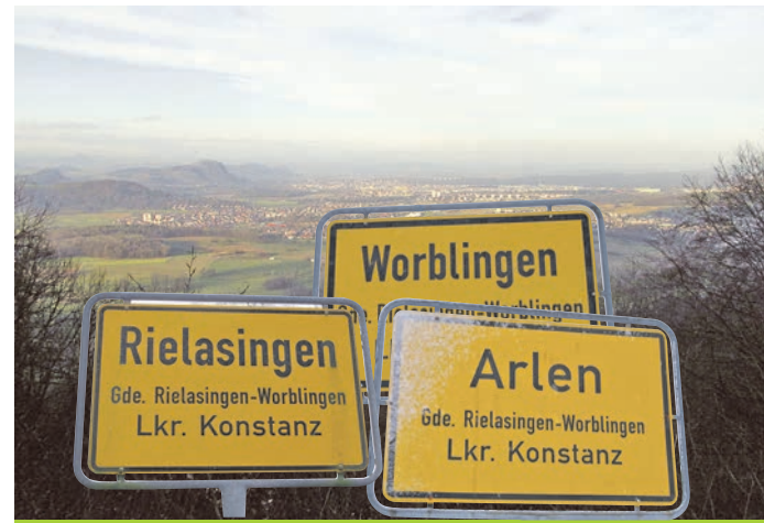
Die Gemeinde Rielasingen-Worblingen und Arlen, vom Schiener Berg aus gesehen. In 40 Jahren ist die Gemeinde zu einem erfolgreichen Modell zusammengewachsen.

8.699 Einwohner zählte Rielasingen-Worblingen beim Datum des offiziellen Zusammenschlusses, heute ist die Gemeinde an der Grenze von 13.000 Einwohnern angekommen und wird auch weiter wachsen, denn das nächste Baugebiet unterhalb