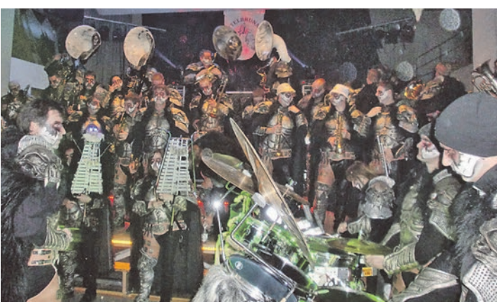
»Halli-Galli« ist am 10. Januar in der alten Engener Stadthalle mit Beteiligung aus dem ganzen Hegau angesagt.

Am 20. und 21. Dezember gab es in Engen zum zweiten Mal »Die lange Nacht der kurzen Filme«. An den vier Spielstätten im Schützentrump, der Stadtbibliothek, im Jugendtreff sowie im Tafelladen konnten sich die Besucher mit insgesamt 55 Filmen und einer Gesamtspieldauer von mehr als 10 Stunden auf hohem Niveau unterhalten lassen. Zum Auftakt gab die in Norwegen lebende Künstlerin Eva Pfitzenmaier zu gezeichneten Filmen von Gerhard Mahler mit Stimme, diversen Gegenständen und einem Mischpult eine musikalische Performance: experimentell, fast irre und irgendwie doch schön. Zuvor wurden die Filme der Preisträger des regionalen Kurzfilmfestivals 2014 gezeigt. Am Sonntag standen dann neben den Filmen de »Shorts Attack« zum Thema »Ab ins All« und den »Shocking Shorts« Krimiparodien ebenfalls preisgekrönte Filme für Kinder sowie das Thema »Migration« auf dem vollen Spielplan. Bis morgens früh um zwei Uhr konnten die Filmfreunde die längste Nacht des Jahres in Engen mit Filmen und Kulinarischem zum Tage machen.