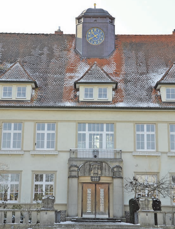
Für die rund hundert Jahre alte Hebelschule fordert das Landratsamt einen zweiten Fluchtweg. Der Gemeinderat muss nun eine Lösung dafür finden.

Hebelschule wird wohl eine Außen-Treppe bekommen