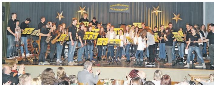
Ein musikalisches Feuerwerk zündeten die beiden Jugendkapellen aus Hilzingen und Weiterdingen.