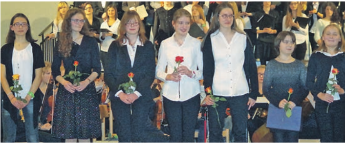
Viele Blumen gab es für die Solisten am Schluss des Weihnachtskonzerts des Hegau-Gymnasiums in der Liebfrauenkirche.