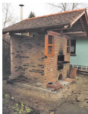
Das Singener Backhaus der Siedlergemeinschaft.