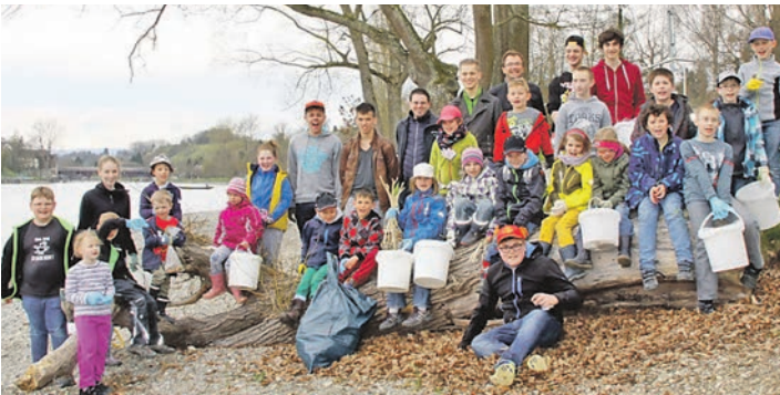
Sie waren fleißig bei der Strandputzete in Gailingen: die DLRG-Jugend aus Gailingen.