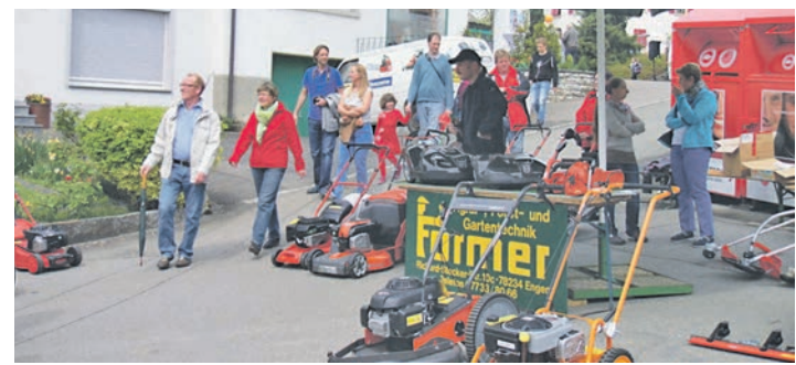
Infos und Unterhaltung gab es im Engener Altdorf.