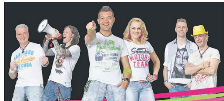
Mit wilden Engeln in den Mai tanzen, das verspricht die Nacht von Donnerstag, 30. April in den 1. Mai. Ab 19 Uhr laden die Heilsberghexen Gottmadingen zu ihrer Riesenparty in die Fahrkantine ein. Für beste Stimmung garantieren die »Wilde Engel - die Partybombe aus dem Schwarzwald«. Vorverkauf bei Weinhaus Fahr. Infos unter www.Heilsberghexen.de