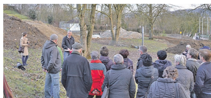
Der Spielplatz im neuen Höhenfreibad muss abspecken, soll aber weiterhin ein Hingucker bleiben.