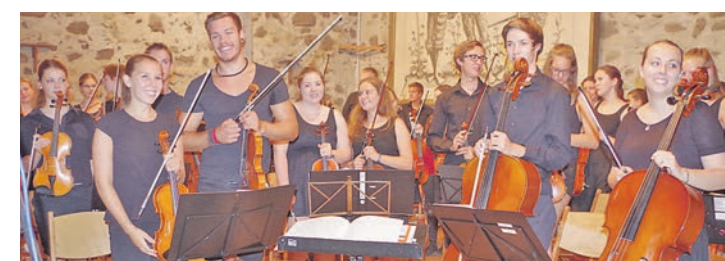
Die Musiker des JMS-Sinfonieorchesters konnten nach ihrem »Bolero« förmlich im Applaus baden.

Mehr Bilder dazu gibt es unter bilder.wochenblatt.net