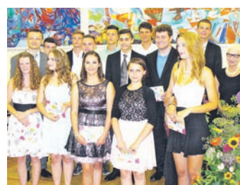
Die Schüler freuen sich auf viele Besucher am Präsentationsnachmittag.