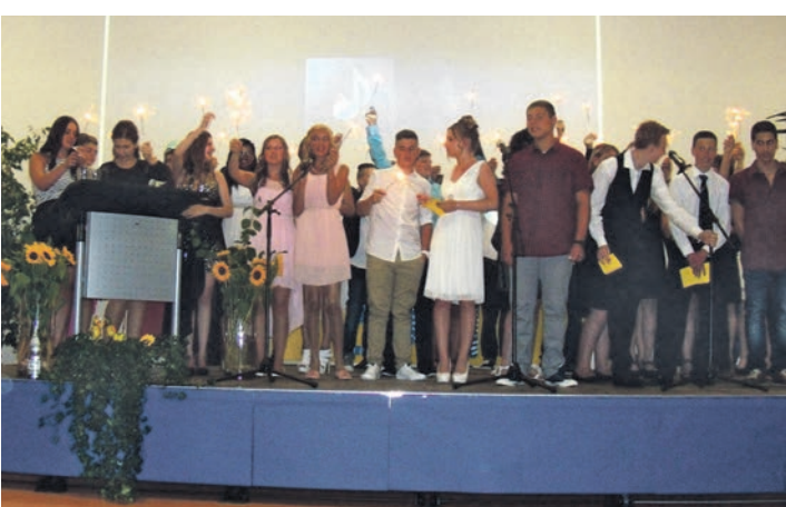
»Au revoir« mit Wunderkerzen, so verabschiedeten sich 39 SchülerInnen der Beethovenschule Singen.

Mehr Bilder von der Abschlussfeier an der Beethovenschule gibt es unter bilder.wochenblatt.net