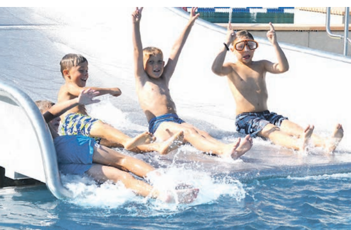
Riesenspaß haben Wasserratten auf der Wellenrutsche.

mit flotten Melodien den historischen Akt einläutete. Bürgermeister Michael Klinger begrüßte entspannt die Gäste, auch wenn er eingestehen musste, dass die Arbeiten im Kleinkindbereich in die Verlängerung gehen müssen und es noch eine gute Woche braucht, bis auch die Kleinsten das Plantsch- und Klettervergnü-