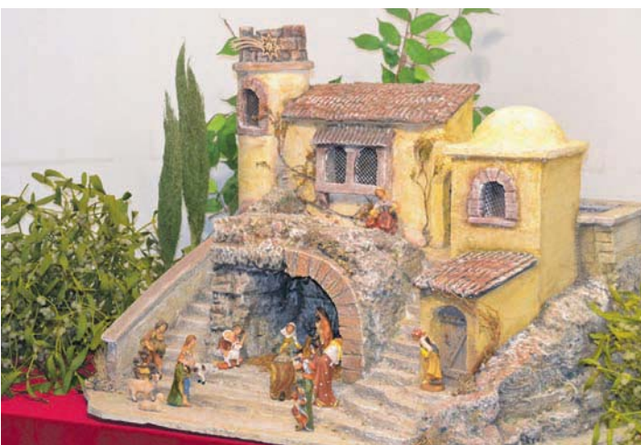
Kunstvolle Krippen sind am Weihnachtsmarkt in Hilzingen zu bewundern.

erwerben. Bis 18 Uhr lockt auch die beliebte Krippenausstellung im Dachgeschoss des Museums, wo die unterschiedlichsten Kunstwerke und die neuesten