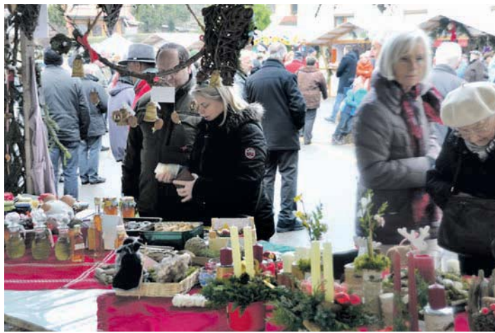
Über 30 Stände des neuen Kreativmarktes begeisterten die Besucher des neu gestalteten Klosemarktes in Aach.