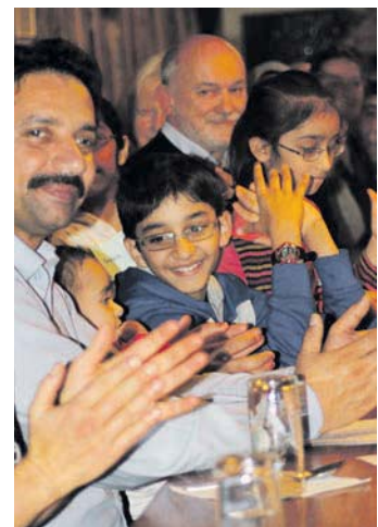
Flüchtlinge in Gailingen werden bestens gefördert.