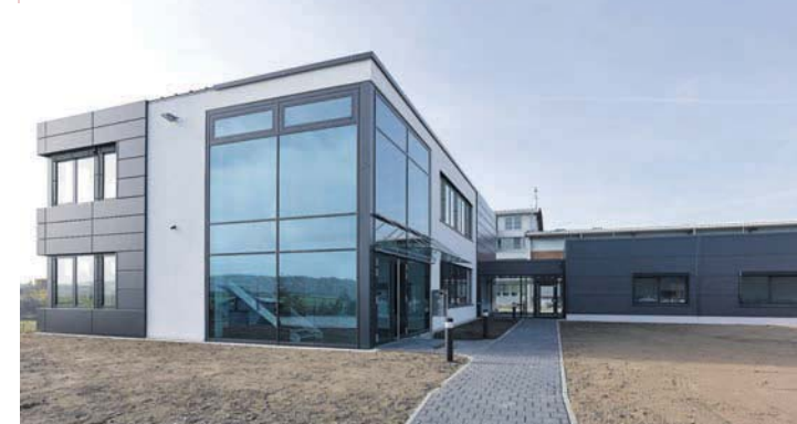
Der neue Büro- und Produktionskomplex im Gottmadinger Industriegebiet Goldbühl bietet ein modernes Raumdesign auf einer Fläche von rund 1.100 Quadratmetern.