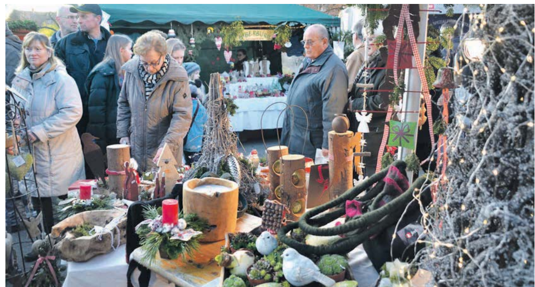
Viele schöne weihnachtliche Deko-Ideen wurden den Besuchern des Gottmadinger Weihnachtsmarktes präsentiert.

Mit einem Adventshock, den die Schülerinnen und Schüler liebevoll mit Bewirtung und Programm gestaltet hatten, verabschiedeten sich am 25. November die Auszubildenden von den Bewohnern. Die lieben die Auszubildenden nur ungern gehen und waren voll des Lobes für diese.