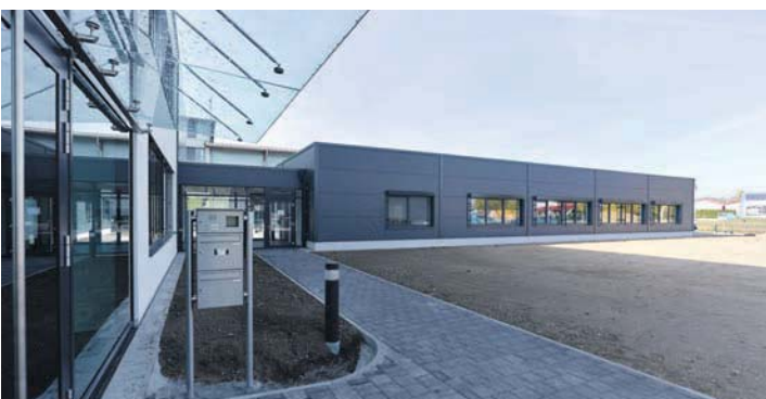
Nach rund acht Monaten Bauzeit hat die motrona GmbH im November ihren neuen Bürokomplex mit angrenzendem Produktionsgebäude im Gottmadinger Industriegebiet Goldbühl bezogen.