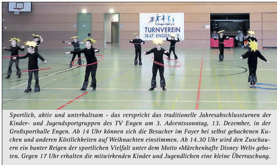
Sportlich, aktiv und unterhaltsam - das verspricht das traditionelle Jahresabschlussturnen der Kinder- und Jugendsportgruppen des TV Engen am 3. Adventssonntag, 13. Dezember, in der Großsporthalle Engen. Ab 14 Uhr können sich die Besucher im Foyer bei selbst gebackenen Kuchen und anderen Köstlichkeiten auf Weihnachten einstimmen. Ab 14.30 Uhr wird den Zuschauern ein bunter Reigen der sportlichen Vielfalt unter dem Motto »Märchenhafte Disney Welt« geboten. Gegen 17 Uhr erhalten die mitwirkenden Kinder und Jugendlichen eine kleine Überraschung.

Mehr Impressionen vom Klosemarkt unter bilder.wochenblatt.net