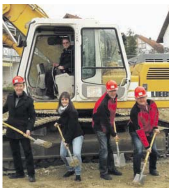
Obwald-Wohnbau realisiert ein Neubaugenieur in Steißlingen.

Steißlingen (rab). Weg frei für generationenübergreifendes Wohnen: In den vier Mehrfamilienhäusern, die die Obwald Wohnbau GmbH auf dem 3200 Quadratmeter großen Grundstück im Neubaugebiet Storchweg/Hegaustraße in Steißlingen errichtet, werden viele Wünsche erfüllt.