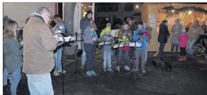
Ein großes »Hallo« gab es wieder beim Lichterabend der Narrenzunft Schaffingen am Samstag im Unterdorf. »Hallo« auch wegen des zur Kulturveranstaltung avancierten Flohmarkts für gebrauchten Christbaum- und Adventsschmuck. Nachwuchsmusiker des MV Worblingen sorgten für weihnachtliche Stimmung. Der Erlös ist für den Ausbau des Narrenschopfs bestimmt. Mehr Bilder unter bilder.wochenblatt.net