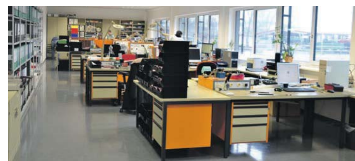
Die Mitarbeiter von motrona freuen sich über lichtdurchflutete Räume im neuen Bürokomplex und im angrenzenden Produktionsgebäude.

Die motrona GmbH ist ein international ausgerichtetes, mittelständisches Unternehmen. Mit den Produktsegmenten safety - control - motion - interface lassen sich die Schwerpunkte, des auf hochwertige elektronische Komponenten für industrielle Automation spezialisierten Unternehmens, am besten beschreiben. Eigene innovative Entwicklungen von Hardware und Software, eine moderne und auf höchste Qualitätsansprüche ausgelegte Produktion und einschlägige Markterfahrungen aus 35 Jahren ihres Bestehens zeichnen die Produkte des umfangreichen motrona-Geräteprogramms aus. Die motrona GmbH ist in den meisten Ländern durch Ihre kompetenten Repräsentanten vertreten.