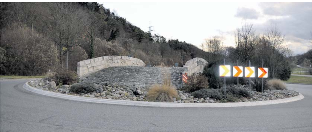
Das Brückenbauwerk beim Kreisverkehr »Zollbruck« am Ortseingang von Nenzingen muss wegen Gefährdung der Verkehrssicherheit abgebaut werden.