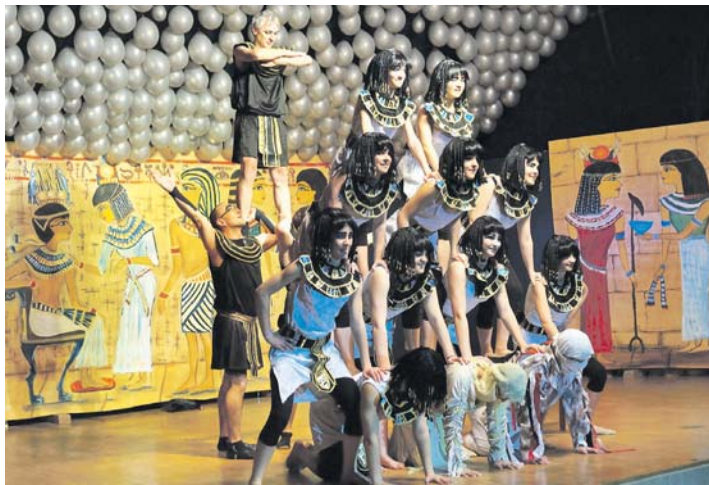
Viele Unterhaltungspyramiden wurden in Nenzingen aufgebaut.