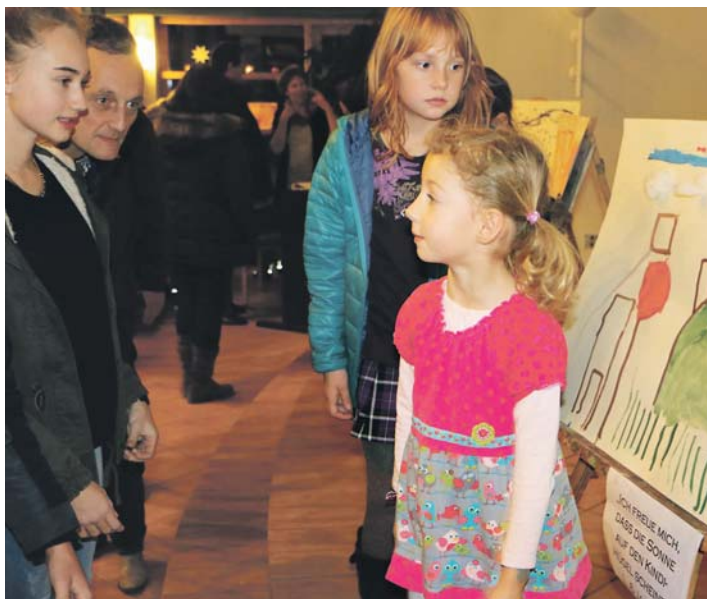
In einem Kunstprojekt haben Kinder des katholischen Kindergartens Böhringen wunderschöne Werke geschaffen und sie im Rahmen einer Ausstellung präsentiert.