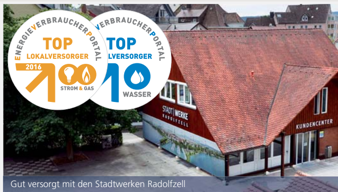
Gut versorgt mit den Stadtwerken Radolfzell