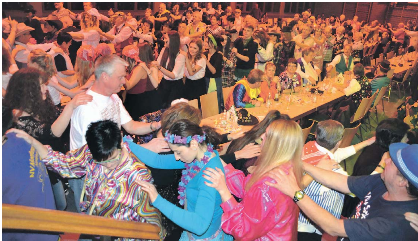
Fasnet sorgt für Stimmung wie hier in Orsingen: Die wichtigsten Termine veröffentlicht das WOCHENBLATT in dieser Ausgabe.

WASSERBURGERTALGEISTER Samstag, 30.1.: 20 Uhr Zunftabend in der Tudoburghalle Schmotziger Donnerstag, 4.2.: