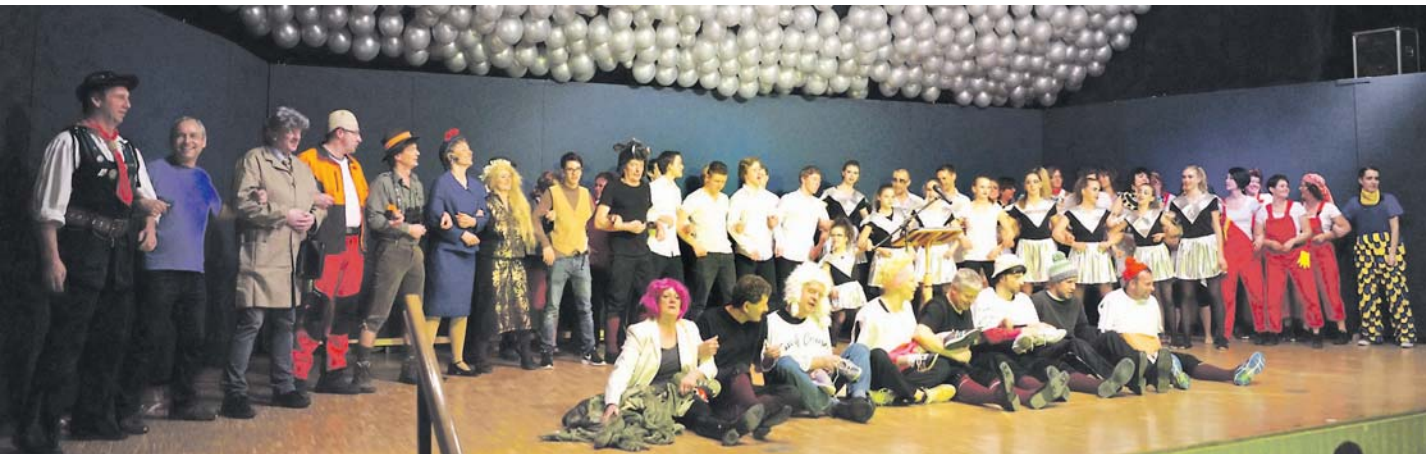
Farbenfroh, bewegt, akrobatisch und mit viel Liebe zum Detail gestalteten die Moofanger ihre Bunten Abende.