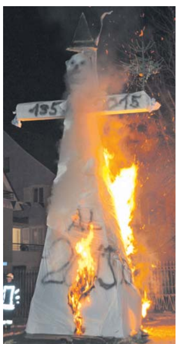
Feurig - der Hemedglonker.