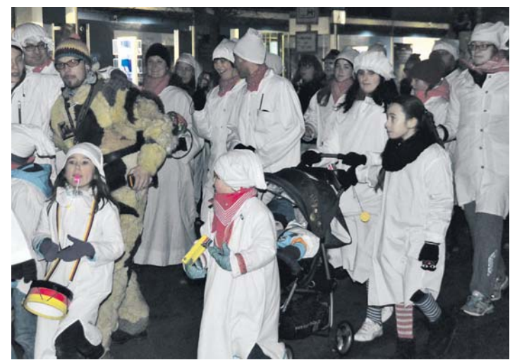
Weißer Gestalten wissen, bunt zu feiern - beim »Hemedglonker«.