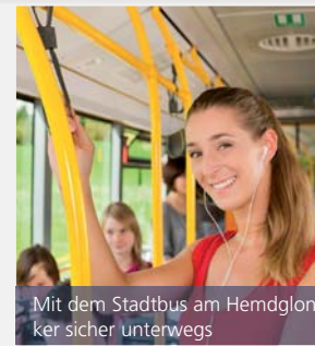
Mit dem Stadtbus am Hemdglonker sicher unterwegs

Auf der Nachtlinie 1 fährt der Stadtbus zusätzlich ab 23:05 Uhr bis 02:05 Uhr jeweils zur 05. Minute. Die Nachtlinie 6 fährt zusätzlich ab 23:25 bis 02:25 Uhr zur 25. Minute. Bei Bedarf fahren die Kurse der Linie 6 über Stahringen.