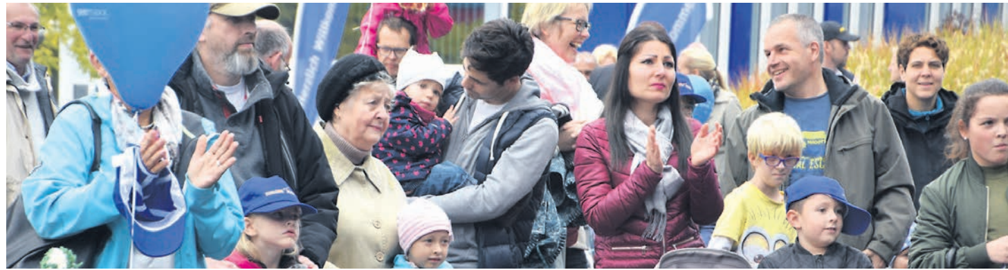
Wie zu erwarten war, entwickelte sich das erweiterte »seemaxx« beim Erlebnissamstag »Radolfzell feiert« zu einem wahren Besuchermagneten. swb-Bilder: gü

Mehr Bilder gibt es im Internet unter bilder.wochenblatt.net .