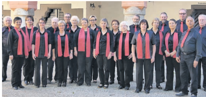
Der Hohenfels-Chor wird 40 Jahre alt.

Stockach (swb). Der Schwarzwaldverein Stockach unternimmt am Dienstag, 25. Oktober, eine Rundwanderung von der Domäne Hohentwiel aus rund um den Staufen. Treffpunkt ist um 14 Uhr hinter dem Amtsgericht in Stockach zur Bildung von Fahrgemeinschaften. Die sieben Kilometer lange Wanderung kann auch auf fünf Kilometer verkürzt werden.