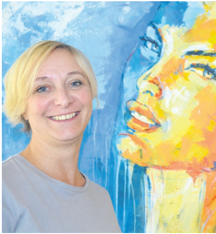
Sie kehrt das Innere nach außen: Birgit Brandys Bilder halten eine Zweisprache mit dem Betrachter.

Stockach (sw). Alle Menschen sind Originale. Darum möchte Birgit Brandys sie nicht zu Kopien degradieren. Sie kopiert zwar die Gesichter menschlicher Vorbilder - doch niemals eins zu eins. Bei ihren großformatigen Acryl-Bildern fügt sie immer eigene Interpretationen, Deutungen, Farbtupfer hinzu. Obwohl. Es sind mehr als bloße Farbtupfer, die sie ihren vor Vitalität, Temperament und Buntheit strotzenden Werken beimischt. Jedes Bild erzählt eine Geschichte, ist ein Spiegel der Biografie des Dargestellten, ein Widerklang seines Charakters. Pierce Brosnan, markanter James-Bond-Darsteller und smarter Remington-Steele-Serienheld, strotzt nur so vor maskuliner Eckigkeit. Und bei Ava Gardner, Schauspielerin und erotischer 50er Jahre-Männertraum, springt die feminine Femme-Fatale-Ausstrahlung den Betrachter förmlich an. Inneres wird nach außen gezerrt, Persönlichkeit wird zu Farbe, Eigenschaften sichtbar. Auf zwei Stockwerken im Stockacher Rathaus zeigt die in Zizenhausen lebende Künstlerin ab Freitag, 21. Oktober, ihre Porträts und die eleganten »Menschenbilder« mit Ganzkörperdarstellungen. Auf Etage drei des Verwaltungssitzes in der Adenauerstraße erlebt der Besucher ihrer