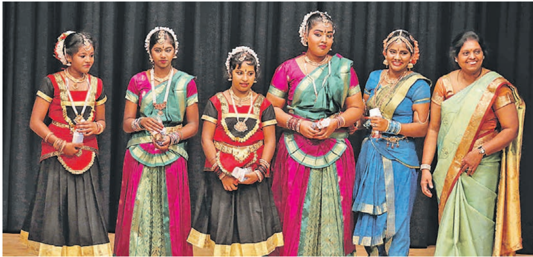
Multikulti und kulturbunt ist Stockach am Sonntag, 23. Oktober.

Und da gibt es allerhand zu sehen: Die Rohbauten zweier Villen sind fertiggestellt, die Wände weiterer Häuser sind aufgezogen, und der Bau der Tiefgarage ist größtenteils abgeschlossen. »Somit läuft bei der Gräflichen Seedomäne alles nach Plan«, heißt es im Presstext der i+R-Gruppe. Vor drei Jahren hat der Lindauer Bauträger i+R Dietrich Wohnbau das gräfliche Grundstück gekauft, und zusammen mit der Gemeinde und der gräflichen Familie ein Nachnutzungskonzept auf dem etwa 2.000 Quadratmeter großen Areal entwickelt. Hier sollen neun Villen als Mehrfamilienhäuser, fünf Einfamilienhäuser und eine neue Version des Hotels »Linde« entstehen. Bis Frühjahr 2018 sollen die Bauarbeiten abgeschlossen sein.