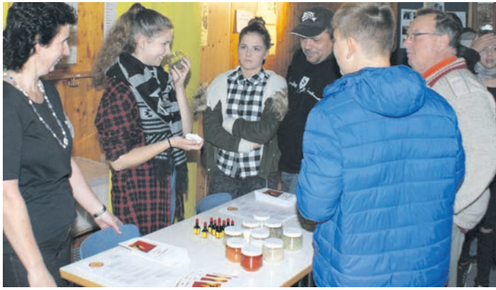
Die Jobbörse, ein Teamwork der Gemeinschaftsschulen Steißlingen und Eigeltingen, möchte Informationen zur Berufswahl aus erster Hand bieten.

Steißlingen (le). Sie ist ein Gemeinschaftsprojekt der Gemeinschaftsschulen Steißlingen und Eigeltingen sowie der Gewerbevereine der beiden Ortschaften – die 14. Jobbörse, die dieses Mal in der Gemeinschaftsschule in Steißlingen auf die Beine gestellt wurde. Die Veranstaltung soll einerseits den Schülerinnen und Schülern die Gelegenheit geben, möglichst viel über die Berufswahl und Ausbildungschancen in der Praxis zu erfahren, und andererseits vor allem den regionalen Firmen und Betrieben eine Plattform anbieten, auf der sie sich darstellen und potentielle Mitarbeiter und Mitarbeiterinnen für die Zukunft werben können.