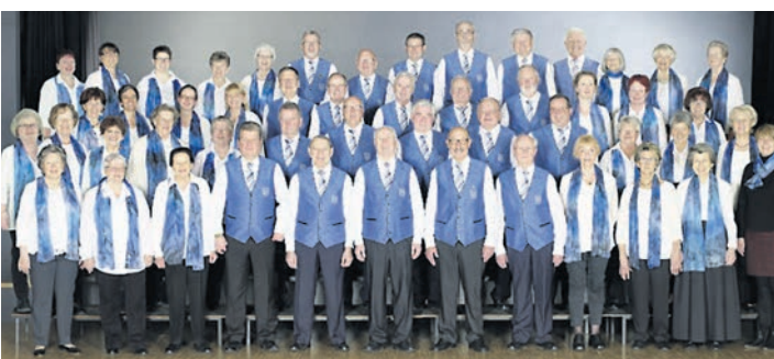
Die Chorgemeinschaft Bodman-Espasingen fiebert ihrem Konzert am Samstag, 12. November, entgegen.