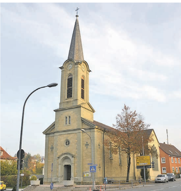
Um Frieden und Kriegsspuren geht es von Sonntag, 6., bis Mittwoch, 16. November, in der Stockacher Melanchthonkirche.

Orsingen-Nenzingen (swb). Die IG Metall-Senioren treffen sich am Mittwoch, 9. November, um 16 Uhr in der Gaststätte »Schönenberger Hof« in der Stockacher Straße 16 in Orsingen-Nenzingen.