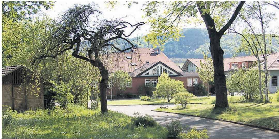
Das Pestalozzi-Kinder- und -Jugenddorf in Wahlwies hat erstmals seit zehn Jahren einen positiven Jahresabschluss vorzuweisen.

Pestalozzi-Kinderdorf in Wahlwies zieht sozial und finanziell eine positive Bilanz