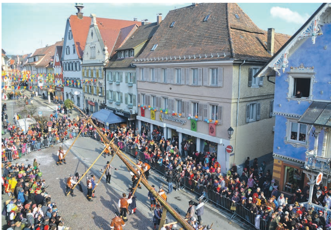
Die Zeit zwischen dem Schülerbefreien und dem Narrenbaumsetzen wird am »Schmotzigen Dunschdigi« 2017 mit Hilfe der Stadtjugendpflege närrisch überbrückt.

Stockach (swb). Die Folklore-Tanzgruppe des katholischen Bildungswerks mit den Tanzleiterinnen Angelika und Franziska trifft sich nach der Sommerpause wieder am Donnerstag, 8. September, um 19 Uhr im Alten Pallottiheim am Eingang zwischen St.-Oswald-Kirche und katholischem Pfarrbüro, um in Leichtigkeit und guter Laune schöne Kreistänze zu genießen. Der Einstieg ist bei den monatlichen Treffen jederzeit möglich. Nächster Termin ist am Donnerstag, 13. Oktober. Auskunft und Anmeldung bei Lilo Oswald unter der Rufnummer 07771/92 09 05.