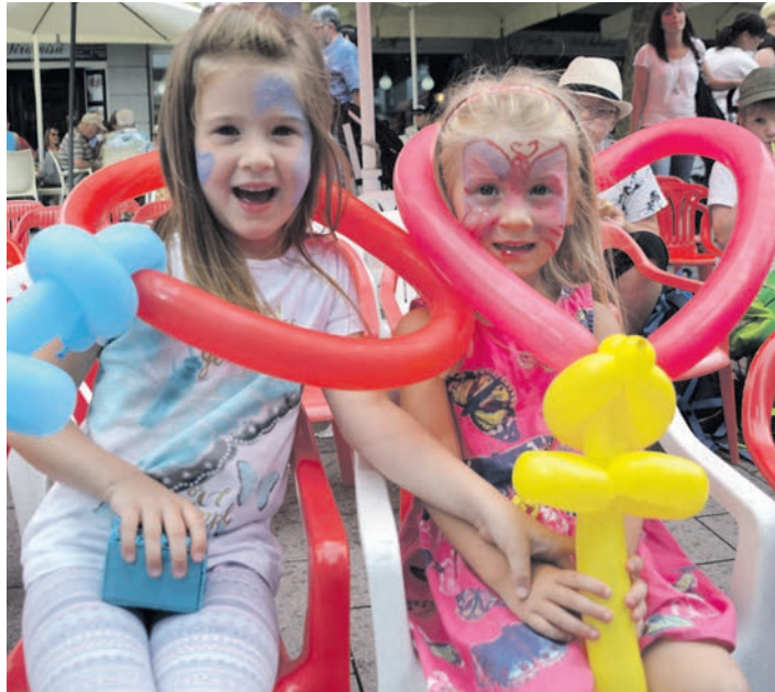
Vom Kinderschminken direkt zum Kasperletheater: Da kam bei den kleinen Besuchern Freude auf!