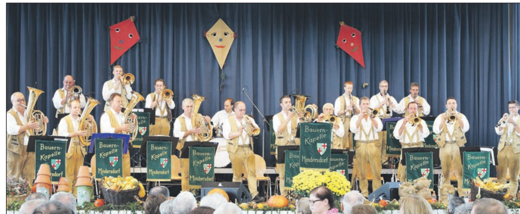
Die Bauernkapelle Mindersdorf ist ein absoluter Stimmungsgarant. swb-Bild: Bauernkapelle Mindersdorf

unterhält ihre Besucher. Der Eintritt ist frei. Montag, 12. September: 16 Uhr: Kinderfest und Feierabendhock mit dem Bezirks-Jugendblasorchester Aachtal 18.15 Uhr: Bierabend mit den Musikvereinen Hilzingen und Raithaslach/Münchhof