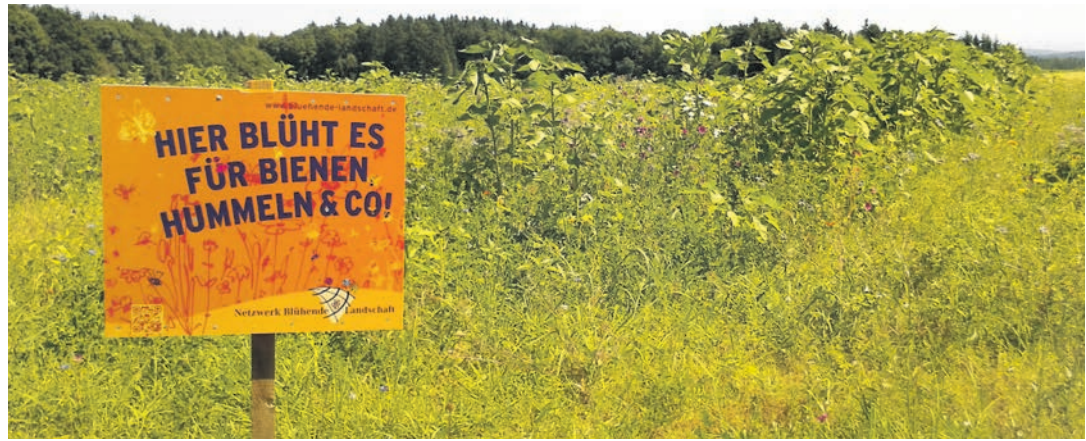
Am Samstag, 6. August, findet um 15 Uhr eine Blühflächenbegehung in Tengen statt.

Tengen (swb). Die fortschreitende Intensivierung in der Landwirtschaft sowie umfangreicher Siedlungs- und Straßenbau führen zu einer schleichenden Veränderung der Kulturlandschaft. Die Folgen für Blüten besuchende Insekten sind gravierend, denn Nahrungsgrundlagen gehen verloren und der Lebensraum wird knapp. So hat sich die Situation für alle Nektar und Pollen sammelnden Insekten, wie Honig- und Wildbienen oder Schmetterlinge, enorm verschlechtert. Dabei erfüllen Blüten besuchende Insekten wichtige Funktionen in der Natur, auf die auch der Mensch angewiesen ist, wie die Bestäubung der Blütenpflanzen und als wichtiger Baustein des Nahrungsnetzes. Seit über zehn Jahren setzt sich das Netzwerk Blühende Landschaft für die Verbesserung der Nahrungs- und Lebensgrundlage von Biene,