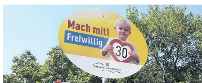
Die Gemeinde hat in der Arlener Straße inzwischen die Empfehlung »Freiwillig Tempo 30« angebracht.

Und dann zog Ralf Baumert aus der Vielzahl der Bewerbungen einen der verschlossenen Umschläge: Sie fiel auf das Angebot Nr. 17, ein Unternehmen aus Veitsbronn in Bayern. Man könne trotz der Preisbindung bei Büchern zusätzliche Angebote machen, verwies Ralf Baumert auf die Möglichkeit, eben doch nicht nur gleiche Angebote zu haben. Allerdings steht den Bieter für nur eine Matrix zur Verfügung, auf der Felder mit »Ja« oder »Nein« angekreuzt werden können.