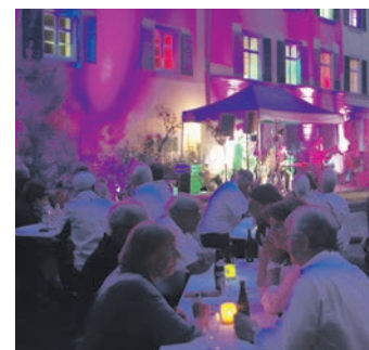
Effektiv illuminiert wurde der Schlossgarten in Singen zum Museumsfest, bei dem eine zünftige Rock'n'Roll-Party gefeiert wurde.

seums der Stadtgeschichte im Schloss machen, das schon seit Jahren visioniert ist. Durch das Ableben des Schlossbesitzers