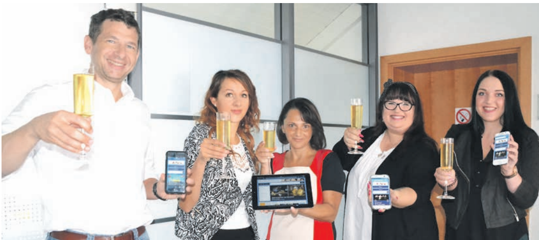
Die neue Webseite ist online und das Waswannwo-Team stößt auf die »beste Veranstaltungsregion der Welt« an. Die neue Webseite will ab jetzt entdeckt werden. Mehr dazu auf Seite 25.

Ab heute neu für PC, Handy, Tablet: www.waswannwo.tips