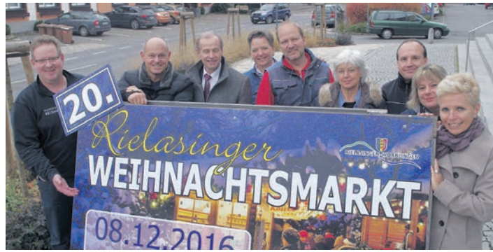
Auf den 20. Rielasinger Weihnachtsmarkt ist das Orga-Team des sub-Bild: of