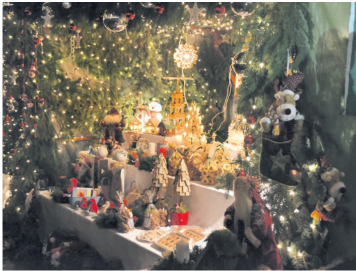
Im Lichterglanz erstrahlt Engens Altstadt am ersten Adventswochenende wenn der 24. Weihnachtsmarkt lockt.

Engen (swb). In der stimmungsvollen Atmosphäre lockt der 24. Engener Weihnachtsmarkt am 26. und 27. November in die Hegaustadt. Am ersten Adventswochenende ist es wieder soweit - dann präsentieren sich die Gassen in Engens historischer Altstadt im schönsten Festtagsgewand. Strahlender Lichterschein, die festliche Dekoration, der wohlige Duft nach Advent, das ansprechende Angebot der Engener Geschäfte sowie von nahezu 100 Verkaufsständen und ein abwechslungsreiches Programm an vorweihnachtlicher Unterhaltung, machen das Bummeln durch die Gassen von Engen zu einem ganz besonderen Erlebnis in der Vorweihnachtszeit. Musikgruppen ziehen durch die Gassen und unterhalten die Besucher mit weihnachtlicher Blasmusik. Einmal mehr wird die lebensgroße