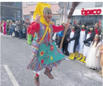
Ehrenamt und Engagement kommen in der Vielfalt der Vereine in der Region zusammen - für das Brauchtum, für Kultur, soziale Belange wie für den Sport.

Singen (rab). Selbstverständlich wäre all das auch alleine zu bewerkstelligen. Einen Tag lang durch die Natur streifen, mit dem Fußball eine Weile über die Wiese dribbeln, sich eine Auszeit auf dem Fahrrad gönnen, Menschen in Not neue Hoffnung geben oder die Schaffenskraft eines Künstlers auf sich wirken zu lassen.