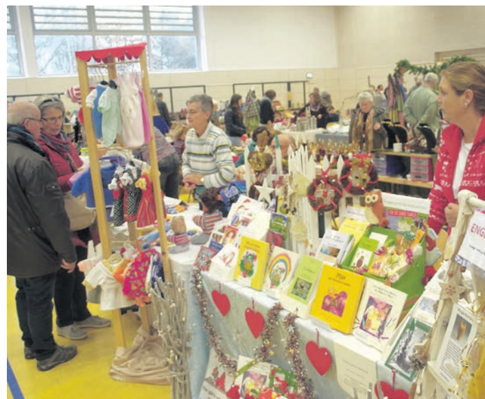
Fast wie im Bienenkorb ging es am Samstag in der Hardberghalle beim 25. Kreativmarkt zu. Aussteller wie Besucher kamen aus der ganzen Region.