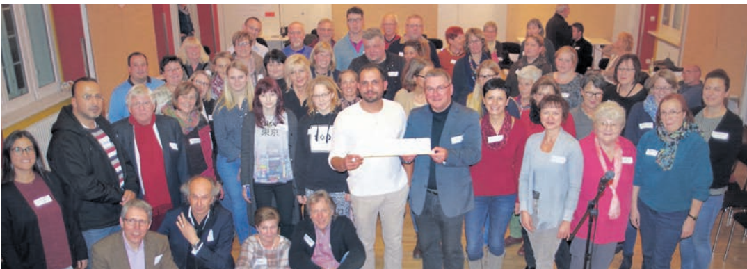
Die Teilnehmer des ersten Flüchtlingsdialogs in Rielasingen-Worblingen präsentierten stolz den an diesem Abend erarbeiteten Leitsatz »Kommunikation und Offenheit schafft Miteinander«. sub-Bild: of

Mehr Bilder vom Flüchtlingsdialog unter bilder.wochenblatt.net .