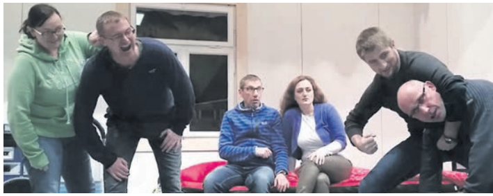
Die Theatergruppe in Stahringen zeigt in diesem Jahr am 25. Dezember und 7. Januar das Stück »Nestflucht ins Chaos« von Renate Reuss in der Homburghalle.

Stahringen (swb). Das Theater-spielen im Musikverein Stahringen hat eine lange Tradition. Die ersten Aufführungen fanden bereits kurz nach Ende des Kriegs statt. Auch in diesem Jahr heißt es deshalb in Stahringen wieder »Vorhang auf«: Die Theatergruppe des Musikvereins Stahringen führt am 25. Dezember und 7. Januar das Stück »Nestflucht ins Chaos« von Renate Reuss in der Homburghalle auf.