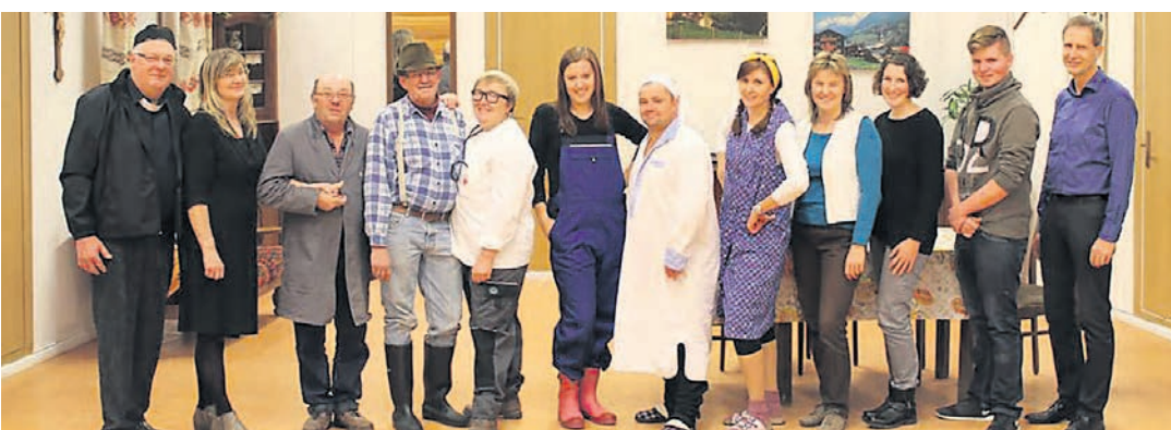
Die Leiden des jungen Landwirts: Das Lustspiel »Suche Mann für meine bessere Hälfte« wird dreimal in der Weiherbachhalle in Zoznegg gezeigt.