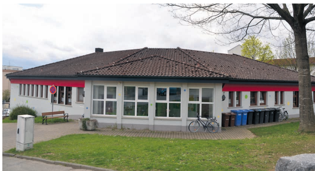
Auch die »Villa Kunterbunt« profitiert vom geplanten Kindergartenneubau: Die Kindertagesstätte soll den Mehrzweckraum mitbenutzen können.

220.000 Euro im aktuellen Haushaltplan 2016 zur Verfügung. Das beschloss der Stockacher Gemeinderat in seiner jüngsten Sitzung.