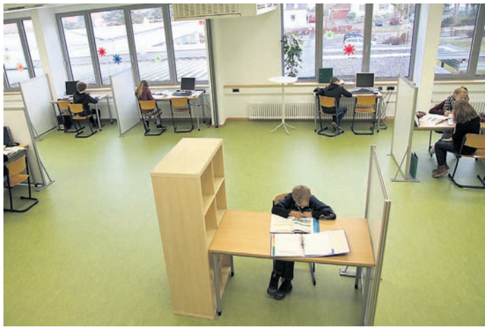
Ein großzügiges, zweckmäßig eingerichtetes Lernatelier in der Ten-Brink-Schule.

Gern gesehen wären zu diesem Anlass auch ehemalige Austauschschüler, die in den Anfangsjahren dabei waren. Da auch in einem der neuen Räume eine Ausstellung über den Schüleraustausch gezeigt werden soll, würde sich die Schule sehr freuen, wenn Ehemalige,