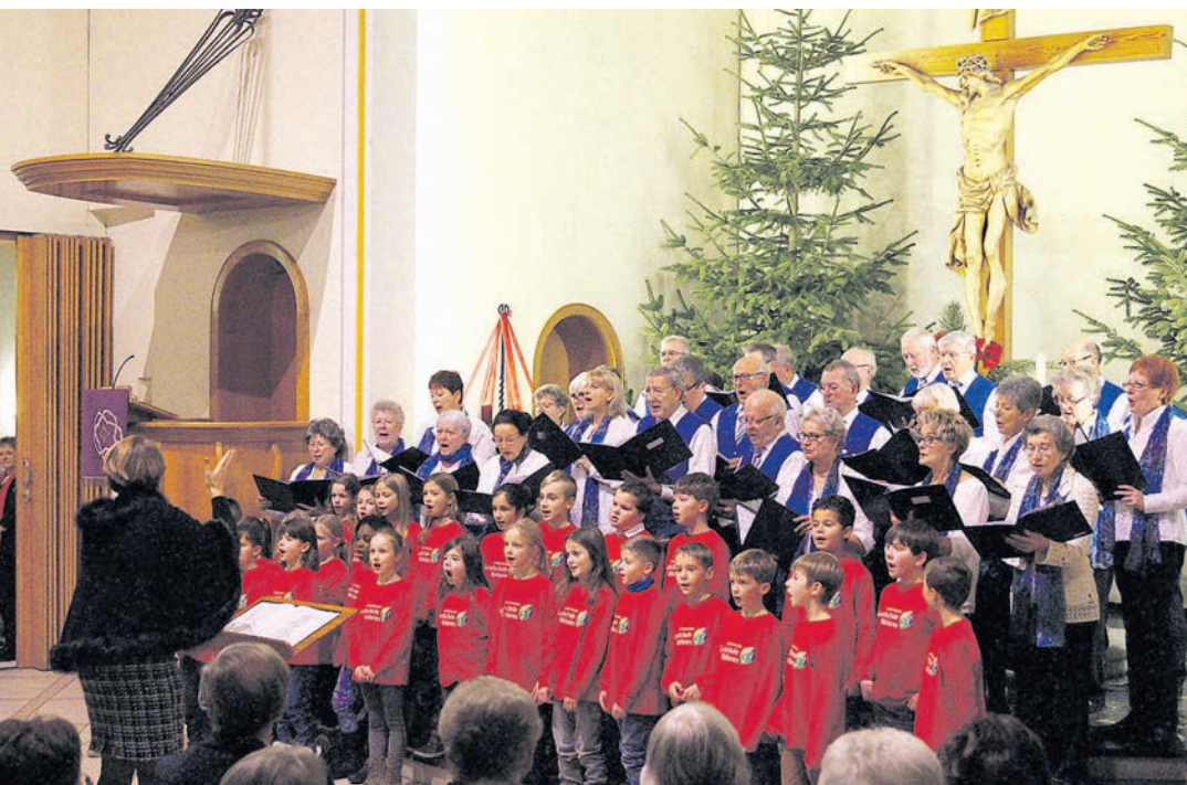
Einfach schön: Neun Chöre des Bezirks Stockach wussten zu bezaubern - auch die Kinder des Schulchores Wahlwies und die Chorgemeinschaft Bodman-Espasingen. sub-Bild: wh