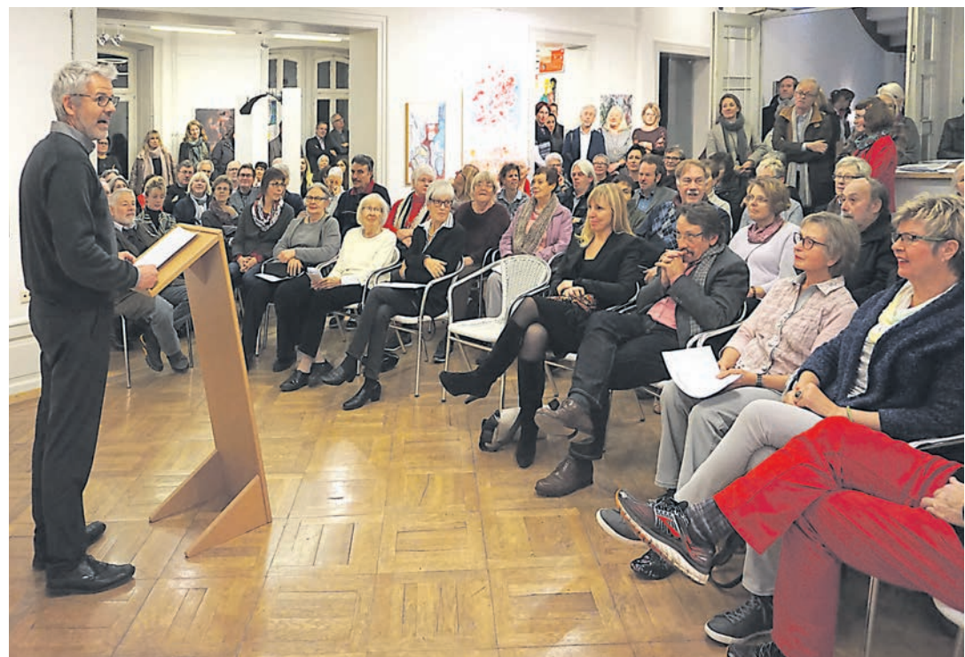
Gut besucht war die Vernissage zur 13. Mitgliederausstellung des Kunstvereins Radolfzell in der städtischen »Villa Bosch«.