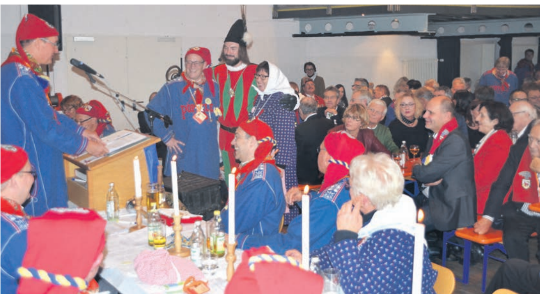
Beste Stimmung herrschte bei der Martinisitzung der Poppele-Zunft.