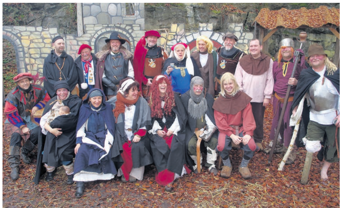
Ein knackiges Martinispiel gab es am Freitag durch die Schauspieler der Narrenzunft Burg Rosenegg. Gleich acht »Findelkinder« wollten an das Erbe von Hans II ran.

Blanke Tatsachen beim Rattlinger Martinispiel