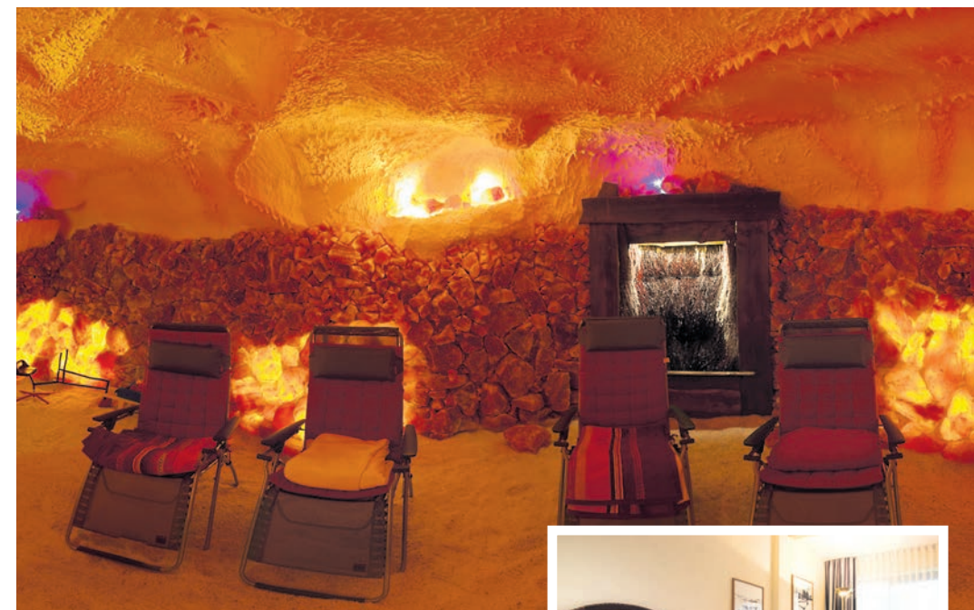
Durch ihr mineralhaltiges Mikroklima ist die Salzgrotte der ideale Ort zum Entspannen und um Kraft zu tanken.

N ovemberblues oder gar schlechte Laune durch Schmuddelwetter? Das muss nicht sein. Auch der Spätherbst hat seine schönen Seiten. Nutzen Sie die Zeit, um sich und Ihrem Körper etwas Gutes zu tun. Hier die besten Tipps und Tricks, wie Sie sich aktiv auf die kalte Jahreszeit vorbereiten können: Entspannung pur durch Solebäder Solebäder sind im Herbst besonders wohltuend. Durch die besondere Atmosphäre erfahren Körper und Geist einen Zustand der Entspannung, Erholung und Regeneration vom Alltagsstress. Darüber hinaus gehören Solebäder zu den ältesten medizinischen Anwendungen und sind bei zahlreichen Beschwerden ein bewährtes Heilmittel.