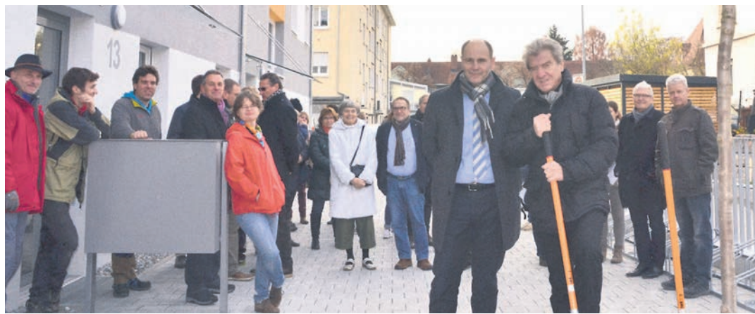
Bei der Einweihung des ersten Neubaus einer Gemeinschaftsunterkunft im Landkreis Konstanz pflanzten Landrat Frank Hämmerle und Oberbürgermeister Bernd Häusler vor der »Worblinger Straße 11-13« einen Rotahorn (rechts).

Singen (stm). Der laut Landrat Frank Hämmerle »beste und erste Neubau« einer Gemeinschaftsunterkunft für Flüchtlinge wurde am Dienstag offiziell eingeweiht. Die Worblingerstraße 11-13 ist eine dreistöckige Unterkunft in Massivbauweise aus zwei miteinander verbundenen Häusern mit einer Kapazität von 82 Plätzen. Die Baukosten betragen laut Hämmerle 3,6 Millionen Euro, die vom Land getragen werden und somit die Kreiskasse nicht belasten. Dies sei eine »kluge und sinnvolle Investition«, insbesondere weil die Gemeinschaftsunterkunft nur durch geringen Aufwand später in zwölf Wohnungen umgewandelt werden könne, so der Landrat. Der Einzug der vornehmlich aus dem Irak und Afghanistan stammenden Großfamilien werde ab dem heutigem Mittwoch vonstatten gehen, ergänzte Ludwig Egenhofer von der Unteren Aufnahmebehörde des Landratsamts. Die Flüchtlinge lebten bereits seit Januar