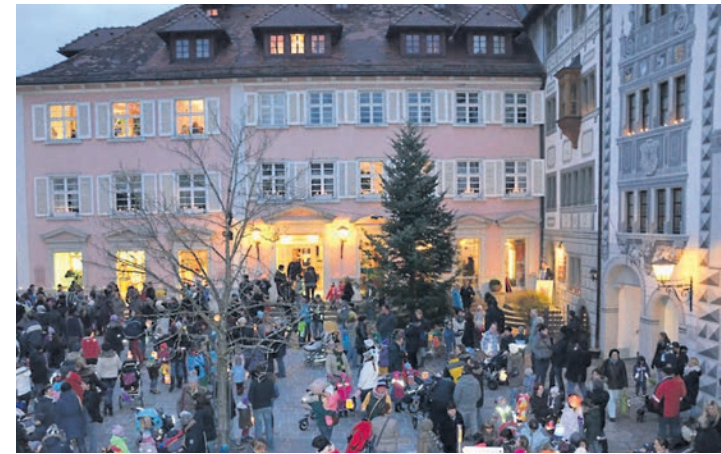
Am Donnerstag erstrahlt Engen im Lichterglanz.