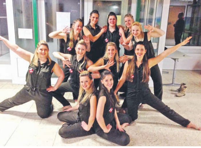
Showtanz der Extraklasse wird am ersten Märzwochenende in Randegg gezeigt.

Publikumsliebling der Veranstaltung war das Team »Kellhof«. Mit einem winzig kleinen Fiat 126 fuhren die vier Teammitglieder mit meist offenem Cabriodach durch Matsch und Schnee. Insgesamt haben 18 Vereine, Städte, Museen und Firmen zusammengearbeitet, um die Veranstaltung zu ermöglichen. Die Teilnehmer lobten neben dem reibungslosen Ablauf die kameradschaftliche Atmosphäre der Rallye. Die »Seegfrörne« ist der erste Wertungslauf des »Bodensee Historic Pokal«. Die weiteren Läufe sind die »Hegau Klassik«, die »Coppa-di-Insalata«, die »Lindau Klassik« und die »ADAC Bodensee Rallye«. Verantwortlicher Veranstalter der Seegfrörnen ist die Firma »Oldtimerland Bodensee« aus Konstanz. Infos unter www.oldtimerland-bodensee.de oder facebook/Oldtimerland Bodensee.