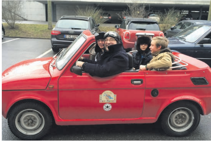
Der Publikumsliebling: Das Team »Kellhof« in seinem Fiat 126.

Nach der »Seegfrörne«: Singen ist Hauptstadt im Oldtimer-Land