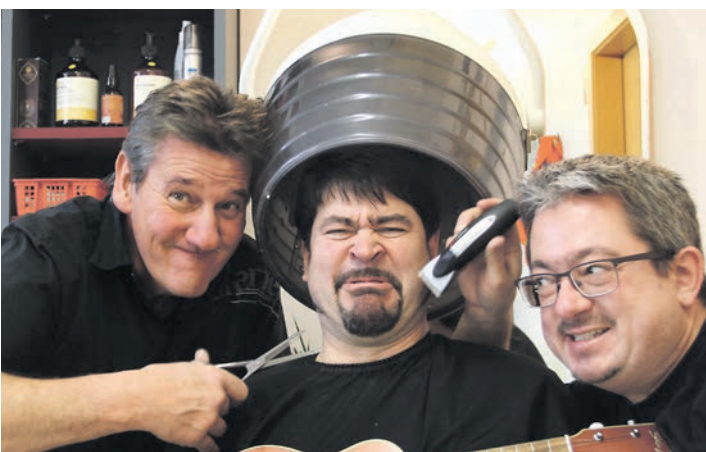
Sie rocken die Kiste - die »Kistenhocker«.

Wer noch bei der Tischmesse mit dabei sein möchte, kann sich bis Mittwoch, 2. März, anmelden. Formulare stehen zusammen mit weiteren Infos unter www.stockach.de , und Sebastian Scholze hilft bei Fragen unter der Rufnummer 07771/80 21 14 oder wfoe@stockach.de gerne weiter.