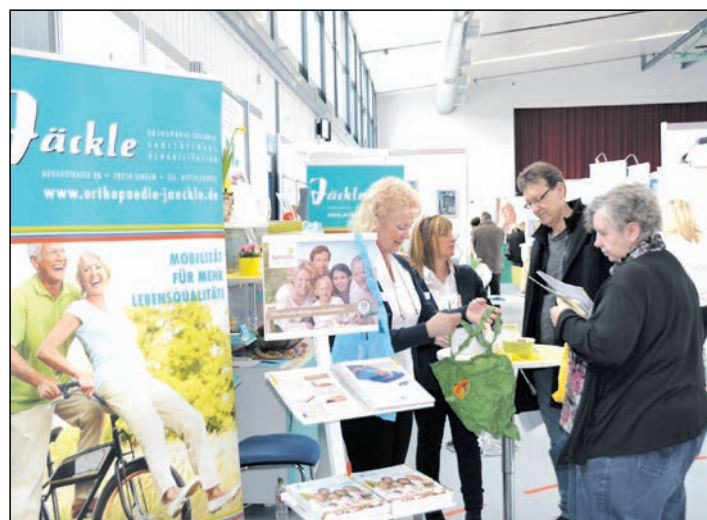
Sie lockte über 2.500 Besucher am Wochenende in die Hegauhallen nach Hilzingen: Die 8. Gesundheitsmesse, auf der über 50 Aussteller und Referenten eine Vielzahl an Themen rund um die Gesundheit aufgriffen, darüber informierten und berieten. Das Spektrum reichte von Naturheilkunde, Pflege und Ernährung über rückenfreundliche Möbel und Hilfsmittel im Alter bis hin zu Zahnersatz und Massagen. Weitere Bilder über die Messe finden Sie unter bilder.wochenblatt.net .