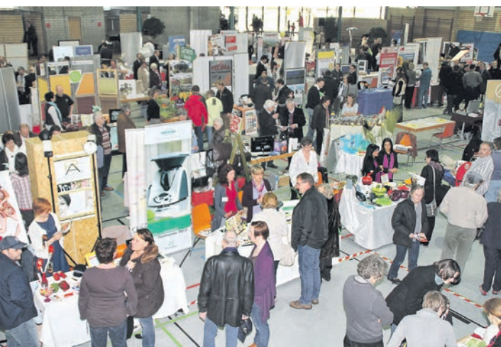
2011 wurde die letzte Tischmesse in Stockach veranstaltet. Am Sonntag, 17. April, gibt es eine Neuauflage. swb-Bild: Archiv/sw