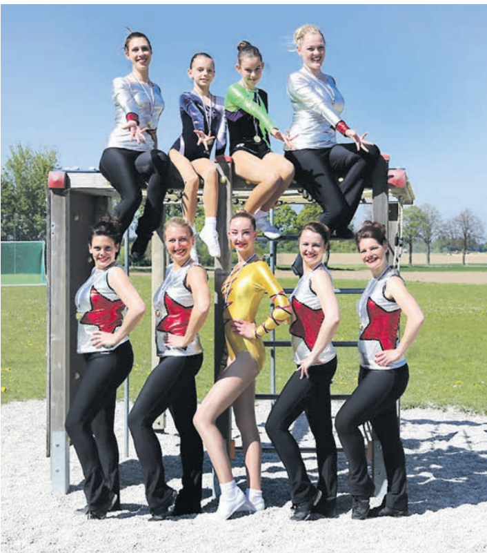
Die Damen des TV Jahn Zizenhausen wussten im bayerischen Pastetten zu überzeugen.

bei«, verrät der Presstext. Zum Angebot der Hausmesse gehörten Werkstattausrüstungen, Arbeitsbekleidung, Qualitätswerkzeug, metall- und holzbearbeitende Maschinen, Beschläge, Haustechnik, Serviceleistungen und vieles aus dem Gartenbereich. In einer angenehmen Atmosphäre wurden die vielen Produkte und Neuheiten präsentiert, Fragen beantwortet und gefachsimpelt. Ein Catering- und Wellnessbereich sowie die Betreuung für Kinder rundeten das Angebot der Kunden- und Branchenausstellung ab.