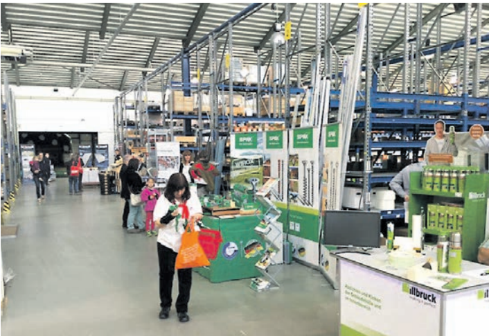
Die Hausmesse bei Eisen Pfeiffer in Stockach ist auch ein Infotreff für Kunden und Vertreter der Branche.