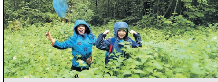
Die Waldwichtel, die Waldkindergruppe des Stockacher Umweltzentrums, hat viel Spaß in der freien Natur. Das nächste Treffen steht am Mittwoch, 1. Juni, ab 15 Uhr mit Treffpunkt am Wanderparkplatz Talstraße zwischen Windegg und Nenzingen an. Infos unter 07771/49 99 oder info@uz-stockach.de.