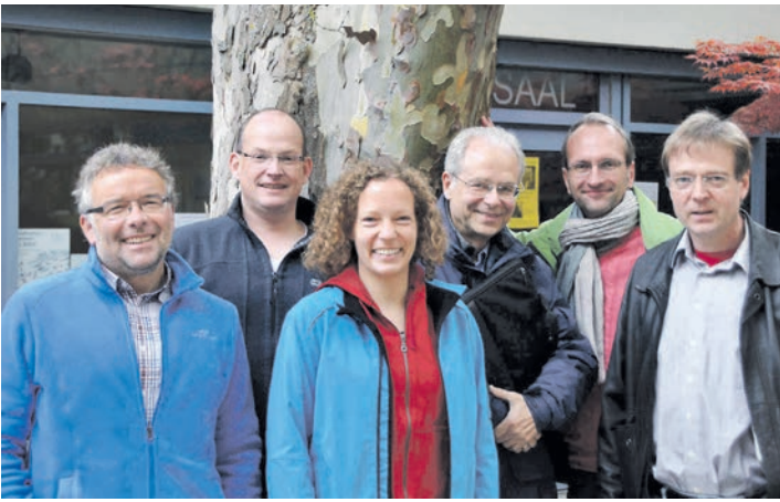
Die Arbeitsgruppe der evangelischen Kirche Radolfzell möchte den »Grünen Gockel« fliegen lassen.