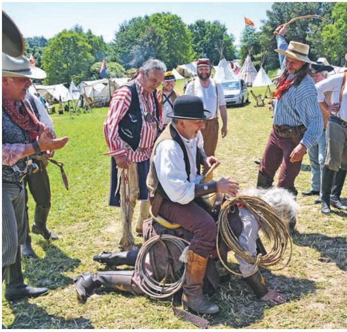
Ein Augenzwinkern ist immer dabei: Auch raue Westerner haben einen Sinn für Humor - zumindest in »Westerntown« beim Schützenhaus in Nenzingen.

Orsingen-Nenzingen (sw). Wer hätte nicht schon davon geträumt? Einmal mit dem Mustang über die Prärie zu fegen, den Wind im langen Haar, die Silberbüchse über der Schulter, den heimischen Wigwams entgegen. Wildwestromantik. Stoff so vieler Kindheitssehnsüchte. Auch später noch. Als Erwachsener. Manche Wünsche können erfüllt werden. Wenn auch nur auf Zeit. Von Fronleichnam, 26. Mai, bis Sonntag, 29. Mai, werden beim Schützenhaus hinter dem Ortsausgang bei der Rebberghalle von Nenzingen Saloons, Tipis, Blockhütten, Zelte und Trapperunterkünfte aufgebaut. Vier Tage lang wächst die »Westerntown« des Schützenvereins über sich hinaus und lässt die Tage von Wyatt Earp, Doc Holliday, Sitting Bull und Geronimo wieder auferstehen. Mehr als Attrappe, Illusion und Theaterdonner. Schweigsame Indianer sitzen vor ihren Zelten, Südstaatensoldaten in ihren grauen Uniformen schlendern durch das Dorf, eiskalte Westernmänner lassen die Sporen klirren, Südstaatenschönheiten rascheln mit ihren atemberaubenden Kleidern, und raue Trapper kippen sich einen Whiskey hinter die Binde. Über allem schwebt der Western-Country-Sound mit »Shadogies«, »Schwarzpulver«, »Pascal & McLane«, »Die kleine Countryband«, Tom Hazy und für Blue-Gras-Fans »Dapper Dan Men«. Dazu gibt es Kulinaris-