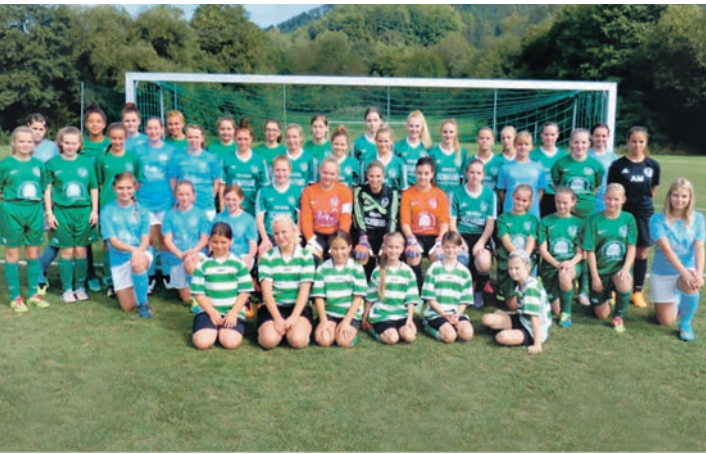
Die FSG Zizenhausen-Hindelwangen-Hoppetenzell möchte eine Mädchenmannschaft melden.