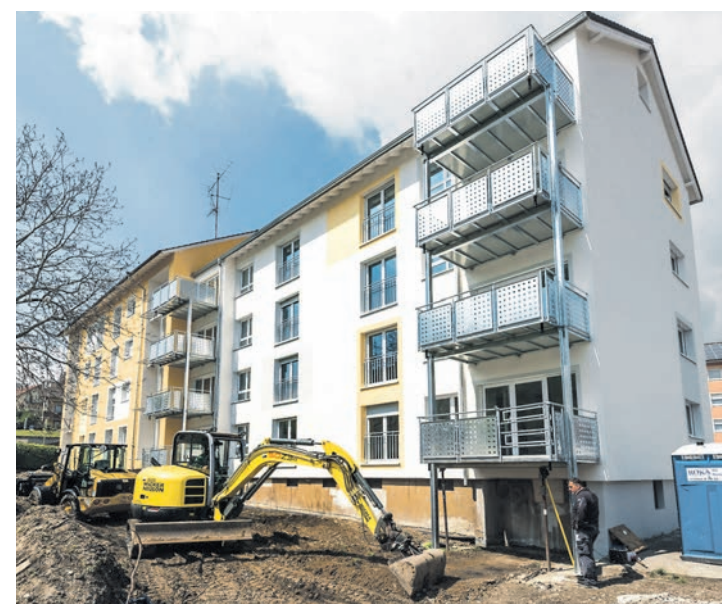
Das Mehrfamilienhaus in der Jacques-Schiesser-Straße 2 in Stockach wurde von der Baugenossenschaft Hegau modernisiert und umgebaut.

Denn zu sehen gab es einiges: Modernisierung und Umbau des Mehrfamilienhauses aus den 60er Jahren sind fast fertiggestellt. Wie die Baugenossenschaft Hegau im Presstext mitteilt, wurde das Gebäude in den Rohbauzustand aus den 60er Jahren zurückversetzt, modernisiert und der Grundriss den heutigen Wohnvorstellungen angepasst. Aus zwölf Wohnungen wurden acht Dreizimmermietwohnungen gemacht, die Bäder erhielten kombinierte Dusch-Badewannen mit bodennahem Türeinstieg, und es wurden großzügige Balkone ange-