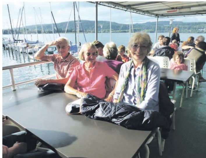
Das Stockacher »UmweltZentrum« darf für weitere zwei Jahre aktiv sein und seine Veranstaltungen wie etwa die geführten Bootstouren anbieten.

durch die Amphibienhilfsaktion am Schanderied konnten im Vorjahr 796 Tiere vor dem Tod auf der Straße bewahrt werden. Wanderungen auf den beiden Quellerlebnispfaden, das »Grüne Band« zwischen Wahlwies und Espasingen, der Storcheweiler in Wahlwies oder die Hege des Streuobstlehrpfades bei Airsch sind weitere Aktionen des »UZ«.