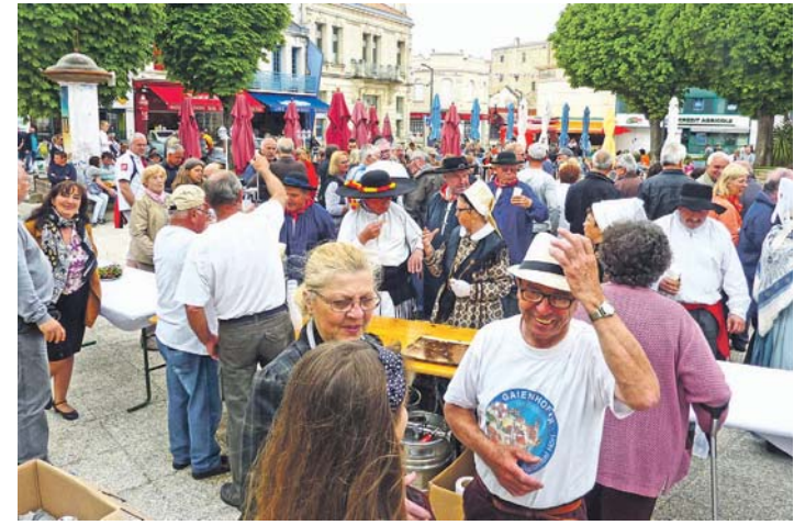
Vier Tage lang feierten 102 Teilnehmer aus Gaienhofen und Steckborn mit ihren Freunden aus Saint-Georges-de-Didonne. Ein Höhepunkt war ein Fest auf dem Kirchplatz mit Musik, Tanz und kulinarischen Köstlichkeiten.