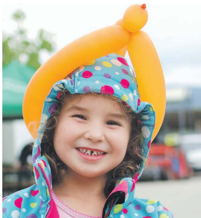
Mitmachen ist erlaubt und erwünscht: Ballonworkshops gehören zum Angebot des Kinderdorffestes in Wahlwies.

Stockach (sw). Vorhang auf! Und Manege frei! Für Menschen, Tiere, Sensationen! Einen Riesenzirkus möchte das Pestalozzi-Kinder- und -Jugenddorf in Wahlwies im Rahmen seines Festes am Sonntag, 12. Juni, veranstalten. Von 11 bis 17 Uhr stehen alle Angebote unter der großen Überschrift »Zirkus«. Einen Spiel- und Bastelspaß kündigt Sabine Freiheit im Presstext an. Und das bedeutet: Nicht nur zuschauen und konsumieren, sondern auch mitmachen und selbst aktiv werden! Besucher dürfen sich als Jongleur oder Luftballonkünstler versuchen, denn mehrere Workshops machen Gäste zu Artisten: »Offene Familienhäuser und thematische Führungen erlauben außerdem einen Einblick in das erste Kinderdorf Deutschlands.« Speis und Trank in Bio-Qualität runden das Zirkusprogramm ab. Noch nicht ganz so »zirkuslike« ist der Kinderflohmarkt, der um 11 Uhr auf dem Gelände des Kinderdorfs startet. Doch zu Akrobaten werden Kinder ab acht Jahren dann um 11, 13 und 15 Uhr beim Jonglagekurs, und als Zirkusorchester tritt um 12 Uhr das Jugendorchester WiSeLi mit Musikern aus Winterspüren, Sentenhart und Liggersdorf auf. Das »Therapeutikum« stellt sich um