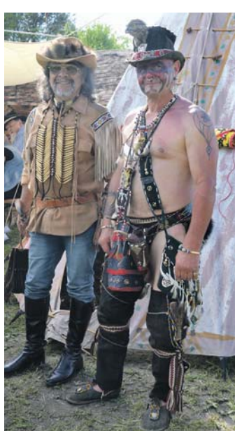
Rauhe Westernmänner mit Herz trafen sich in Nenzingen.

Mehr Fotos zum »Westerdorf« unter bilder.wochenblatt.net .