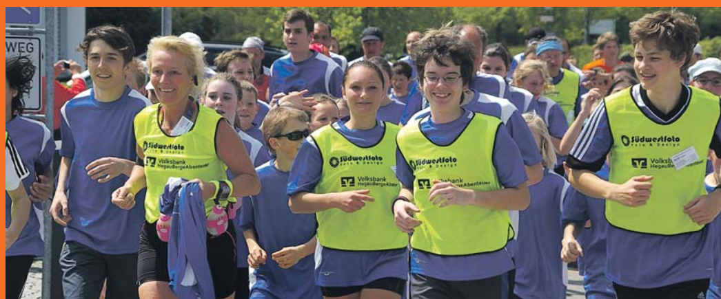
Eine Stadt voll Läufer für den guten Zweck, das Wünschen sich die Organisatoren am kommenden Sonntag beim 1. Stadtlauf der Volksbank. Das Bild entstand bei einem Bergelauf der Volksbank, dem Vorgänger dieser Aktion.