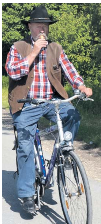
Ein Pferd hätte besser gepasst. Doch so ist es immerhin ein Stahlross geworden.

Knarrende Revolver und donnernde Kanonen sorgten im »Western-Town« bei Nenzingen von Donnerstag, 26., bis Sonntag, 29. Mai, für eine wilde Wildwest-Atmosphäre. Stilecht gekleidete Pioniere lebten den Frontier-Traum.