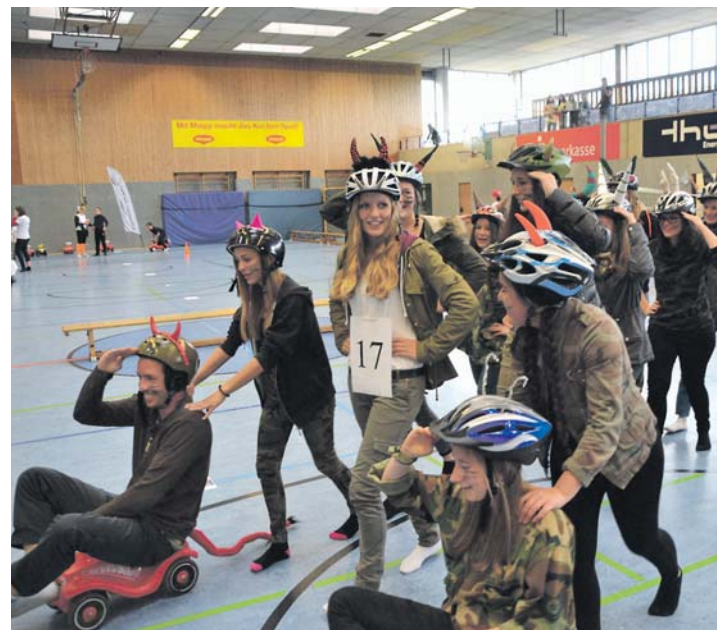
Natürlich können sich für den Inline-Cup beim zweiten Hegau-Familientag am Sonntag, 12. Juni, im Singener Münchriedstadion auch ältere Schulklassen noch spontan anmelden. Eine Verkleidung ist schnell gefunden.

Singen (stm). Noch elf Tage bis zum zweiten Hegau-Familientag. Am 12. Juni werden Jung und Alt im Singener Münchriedstadion wieder Spiel und Spaß hautnah erleben. Und die Vorbereitungen für den Familientag laufen auf Hochtouren. Zahlreiche Gruppen starten beim Inline-Cup. Doch auch spontan können sich noch Schulklassen und in diesem Jahr erstmals Vorschulklassen anmelden. Die Startgebühr übernehmen die Veranstalter. Ob auf Inlinern, Dreirad oder Kettcar - dies bleibt jedem Teilnehmer selbst überlassen. Beim Rundkurs um das Friedrich-Wöhler-Gymnasium geht es dabei keineswegs um Schnelligkeit, sondern wie überhaupt beim Hegau-Familientag steht der Spaß stets im Vordergrund. Anfeuern ist dabei vom Start weg ab 11.30 Uhr nicht nur erlaubt, sondern Pflicht. Denn Sieger sind beim großen Familientag in Singen alle, die mitmachen. Natürlich werden die Teilnehmer des Inline-Cups wie 2015 wieder in tollen Kostümen an den Start gehen. Die meisten haben diese in den letzten Wochen selbst kreiert. Doch auch Spontan-Verkleidungen - etwa aus dem Fastnachtsfundus oder kurz vor der Europameisterschaft als Fußballfan - sind möglich. Übrigens, der Start beim Inline-Cup freut auch die Klassenkasse: 100 Euro sind bei Start garantiert - die drei Erst-