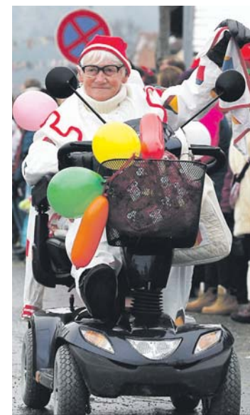
Mit Rolli zur Rolli-Zunft: Ganz Welschingen war närrisch.