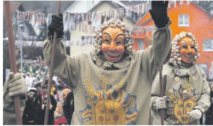
Auf zum närrischen Frühschoppen der Narrenzunft Gerstensack heißt es am Fasnet-Mäntig, 10 Uhr, in der Eichendorffhalle.

Schmutziger Dunschtig, 4.2.: 8.30 Frühstück, Gemeindehalle, anschl. Narrenbaumholen; 14 Uhr Narrenbaumstellen; 19 Uhr Hemdglonkerumzug; 19.30 Uhr Hemdglonkerball, Gemeindehalle