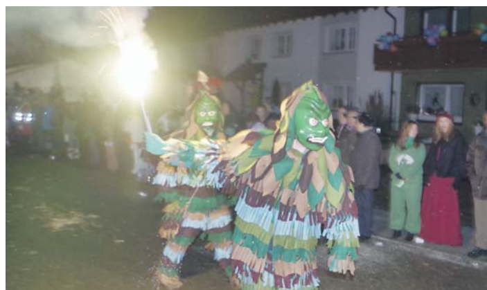
Ein schaurig-schönes Spektakel waren die zwei Nachtumzüge in Welschingen.