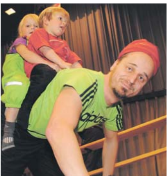
Die Kleinen waren beim Programm der Turnerfamilie Ramsen die Größten.

Zum Schluss schneite es bunte Papierschnitzel aus dem »Konfetti-Shooter«. Das Highlight der Unterhaltung war eine kräftezehrende Performance vom Turnverein mit nahezu akrobatischen »Freestyle-Sprünge«.