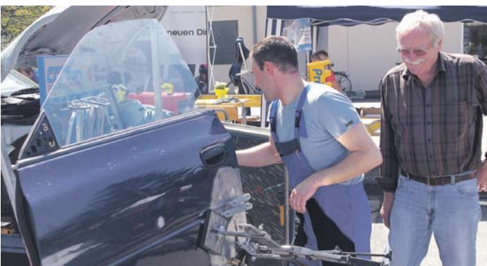
Das »Industriefenster 2016« soll am 16. und 17. April wieder im Gewerbegebiet stattfinden.

Rund 30 Interessenten nahmen an dem ersten Informationsabend teil. Der Vorstand des HGV rechnet für die Gewerbeschau mit rund 50 Teilnehmern und hofft auch, dass der Verkaufsoffene Sonntag dazu beiträgt, dass auch Handelsunternehmen im Gewerbegebiet als Mitmacher gewonnen werden könnten.