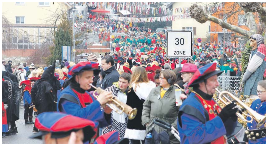
Beim großen Festumzug anlässlich des Narrentages der Narrenvereinigung Hegau-Bodensee tummelten sich tausende maskierte Narren mit viel Musik auf der Umzugsstrecke.

Zu den Höhepunkten zählten der Narrennachtumzug mit Guggen, Hexen, Teufeln und Geistern, der geschichtliche Festumzug mit Motiv- und