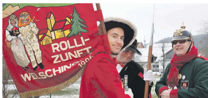
Die Rolli-Zunft feierte ihr 60-jähriges Bestehen.