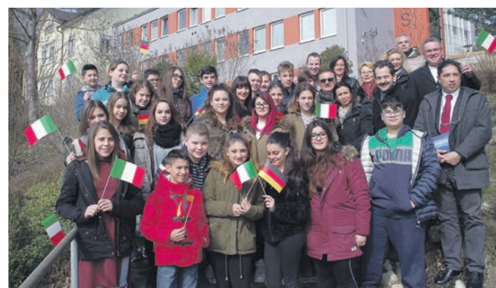
Die Schülerinnen und Schüler mit ihren Lehrern und Gastgebern vor dem Rathaus von Rielasingen-Worblingen.

Rielasingen-Worblingen (of). Nachdem die Anlaufzeit sehr lange gewesen ist, kommt der Schüleraustausch zwischen Rielasingen-Worblingen und der italienischen Partnergemeinde Ardea inzwischen richtig in Schwung. Bereits zum dritten Mal ist derzeit eine Schulklasse mit 16 Schülerinnen und Schülern aus Ardea im Hegau zu Gast. Der Gegenbesuch in Ardea seitens der Ten Brink-Schule ist für Ende April geplant, wurde beim Empfang im Rathaus bekannt gegeben. Die Schülerinnen und Schüler haben Unterricht in der Ten Brink-Schule, aber es gibt auch viele Gelegenheiten das Gastland kennen zu lernen. So geht es nach Stuttgart ins Automobilmuseum, ins Technorama nach Winterthur, es gibt eine deutsch-italienische Führung in der Konzilstadt Konstanz und zum Baden geht's ins Tu-Wass nach Tuttlingen. Am Freitag Abend gab es zudem eine herrliche Pizza-Party rund ums Backhaus der Ten Brink-Schule. Betreut werden die Schüler hier