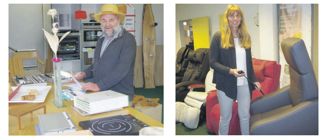
Wie sich ein Hut aus Holz (übrigens mit einem Preis ausgezeichnet) anfühlt oder ein komfortabler Massagesessel, kann man am Samstag und Sonntag persönlich erfahren.