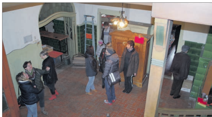
Den ganzen Tag gab's am Sonntag lange Schlangen vor der Villa Graf in Gottmadingen, die sich erstmals mit einem »Tag der offenen Türen« vorstellte. Für das Gebäude sowie das Anwesen der ehemaligen Brauer-Villa gibt es einige Interessenten. Insgesamt zieht die Gemeinde für den Abverkauf des Inventars eine positive Bilanz: Insgesamt kamen 4.500 Euro zusammen, die der Vereinsförderung zugute kommen sollen. Nur eine Standuhr mit Westminster-Schlag fand noch keinen Abnehmer. Mehr Bilder unter bilder.wochenblatt.net.

Rielasingen-Worblingen (of). Das Haushaltsjahr 2015 war für die Gemeinde Rielasingen-Worblingen ein höchst erfreuliches, wie Kämmerin Verena Manuth dem Gemeinderat in der Sitzung am Mittwoch berichtete. Durch Mehreinnahmen, Einsparungen, aber auch durch Verschiebungen von angesetzten Investitionen in einer Höhe von über einer Million Euro hat sich entgegen der Planung insgesamt eine Verbesserung um sage und schreibe 4,25 Millionen Euro ergeben. Damit, so Manuth, könne man statt der geplanten Entnahme aus der Rücklage in Höhe von zwei Millionen Euro eine Zuführung an die Rücklagen in Höhe von 2,155 Millionen vollziehen. Dadurch werde die Rücklage der Gemeinde bis Jahresende wieder auf über 11,7 Millionen Euro ansteigen, so Manuth weiter. Bürgermeister Baumert ergänzte allerdings, dass man finanziell gerade durch Anschlussunterbringung von Flüchtlingen vor einigen finanziellen Herausforderungen stehe.