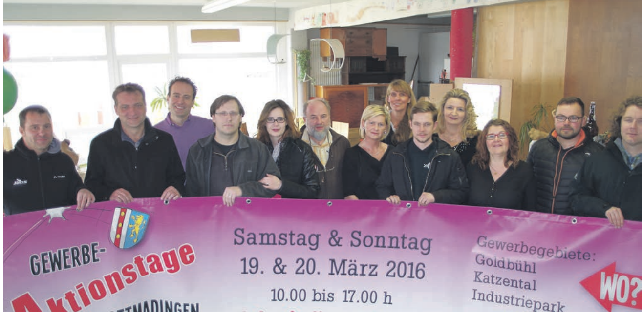
Mit insgesamt 26 beteiligten Unternehmen präsentieren sich die Mitglieder des Gottmadinger Vereins am Samstag und Sonntag: gegenüber der Premiere ist die Zahl der Beteiligten stark angestiegen.

»Christines Modehaus« im Ortskern werde sich am verkaufsoffenen Sonntag beteiligen. Damit die Distanzen zwischen den Unternehmen kürzer gemacht werden, wurde in diesem Jahr extra ein Oldtimer-Bus organisiert, der Nonstop während der Aktionstage seine Runden drehen wird, etwa in einem Viertelstunden-Takt. So kann man sich von einem Ausgangspunkt bequem das Gewerbegebiet erobern. (of).