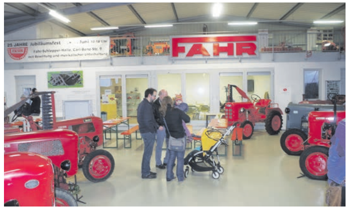
Gleich mehrere Firmen sind in der Schreinerei Hug am Portal des Gewerbegebiets zu Gast.