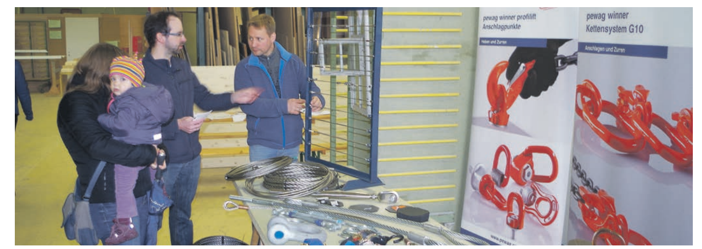
Wie Stahlseile aufgebaut sind, kann man ganz praktisch erfahren. Auch das Thema Reisen ist in den Räumen von Ideal Möbelbau angesagt.