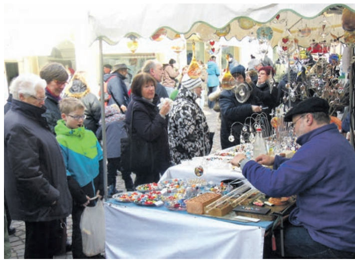
Glasbläserkunst als Zuschauerattraktion.