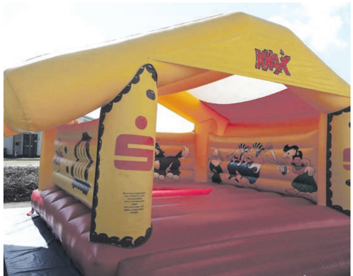
Bei Fahrrad Graf können die Kinder in der Hüpfburg viel Spaß haben.