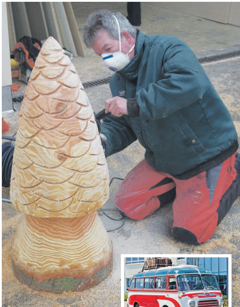
Viele Aktionspunkte bieten die Aktionstage des Gewerbeverein Gottmadingen am Samstag und Sonntag in den Gewerbebezonen. Mit einem schmucken Oldtimerbus (kleines Bild) kann man bequem zwischen den Unternehmen pendeln.