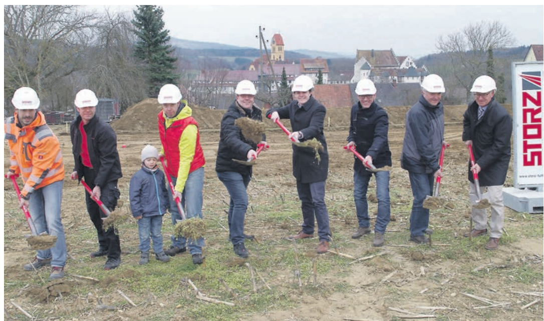
Mit einem zünftigen Spatenstich wurden die Erschließungsarbeiten für das kleine Baugebiet »Schlossblick« am Montag in Blumenfeld gestartet.