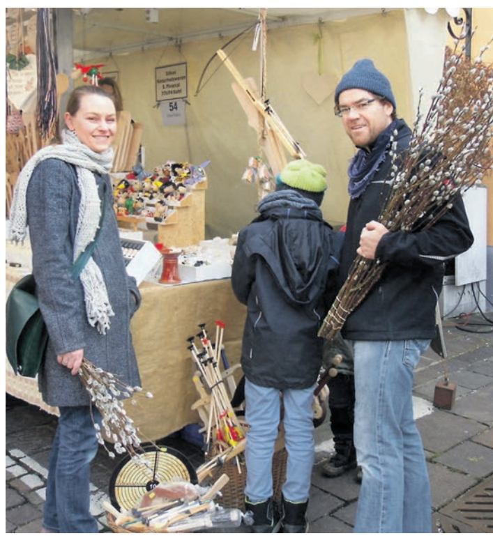
Mit Weidenkätzchen als Vorboden auf den Frühling und auf Ostern rüstete sich diese Familie am Wochenende auf dem Engener Ostermarkt aus.