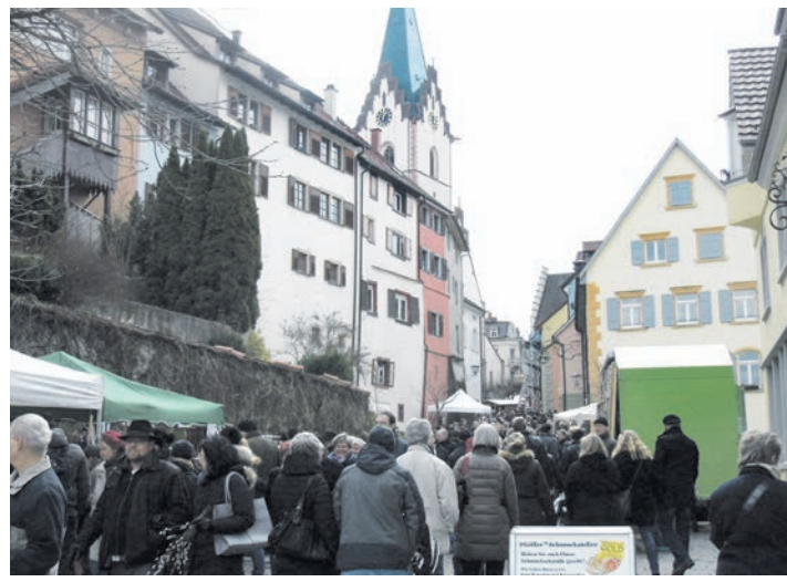
Der Markt lockte zahlreiche Besucher in die Stadt.

gramm für Kinder mit Hüpfburg, Basteln in der Bibliothek und Schminken im Rathaus sorgte auch für Begeisterung bei den Kleinsten. Zudem präsentierten sich am verkaufsoffenen Sonntag über 30 Einzelhandelsgeschäfte und sogar verschiedene Autohäuser waren mit ihren neuesten Modellen vertreten, so dass für jeden Geschmack etwas dabei war. Im Rathaus und im Schützenurm konnte man außerdem die Osterausstellung mit Bastelarbeiten von Engener Kindern und Arbeiten aus dem Kunstunterricht von Engener Gymnasialisten bewundern. Übrigens war auch das Fernsehen an diesem Tag anwesend: Am Sonntag, 20. März, wird ein Bericht des Engener Ostermarkts ab 18.45 Uhr im SWR-Fernsehen zu sehen sein, moderiert von Sonja Faber-Schrecklein, die mit ihrem Team in Engen gedreht hat.