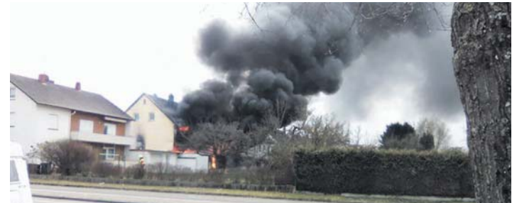
Ein hoher Sachschaden entstand bei einem Gebäudebrand in der Südstadt.

Der Kreuzweg bietet die Möglichkeit, sich dem Passions- und Ostergeschehen auf eine eigene Weise zu nähern. Im Mittelpunkt stehen dabei in diesem Jahr Bilder der Via Dolorosa aus Jerusalem. Musikalisch wird der Kreuzweg von einer Jugend-Band begleitet. Am Ostersonntag, 27. März, lädt die Dietrich-Bonhoeffer-Gemeinde um 10 Uhr zu einem Familiengottesdienst. Alle Kinder sind im Anschluss an den Gottesdienst zu einem großen Ostereiersuchen eingeladen.