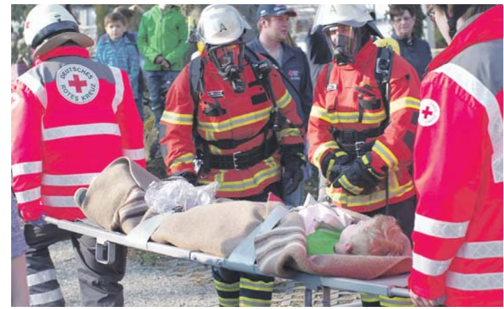
Eine effektive Zusammenarbeit zwischen Feuerwehr und DRK wurde bei der Hauptprobe am Rielasinger Rathaus demonstriert. Vier Personen mussten aus dem Gebäude gerettet werden.