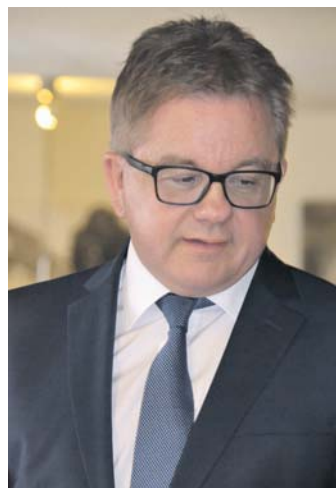
Der CDU-Stadtverband Singen fordert Guido Wolf zum Rücktritt nach dem enttäuschenden Ergebnis der Landtagswahl auf.

Auch wenn die Voraussetzungen für die Wahl aufgrund der Flüchtlingskrise schwierig waren, die Niederlage nur darauf und auf die Bundespolitik zu schieben, ist zu kurz gesprungen und billig. Die Menschen wollten nicht Guido Wolf, sie wollten Winfried Kretschmann als Ministerpräsidenten, so die CDU Singen. »Es ist ein intellektuelles Armutzeugnis, wenn sich Guido Wolf als Wahlgewinner gebärdet, die Verantwortung für die Schlappe ablehnt und personelle Konsequenzen für sich aus-