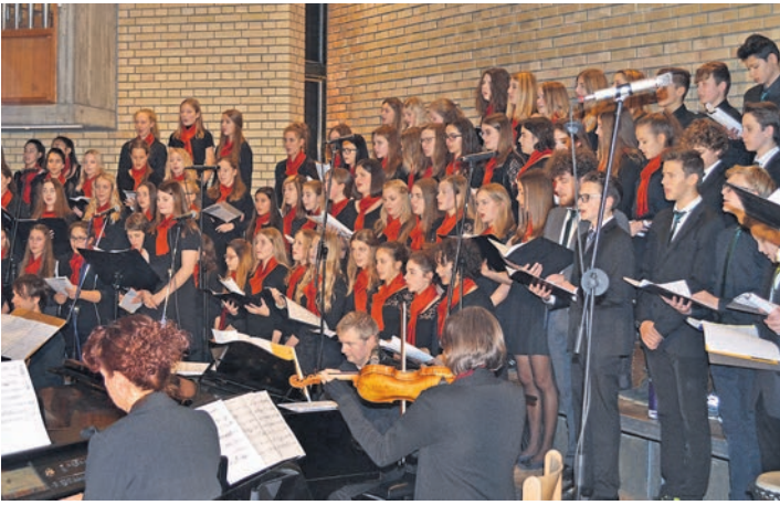
Ein berauschendes Konzert erlebten die Besucher in der Melanchthonkirche in Gaienhofen.