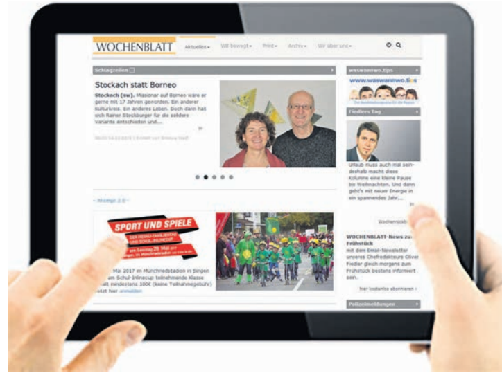
Die neue Seite ist leser- und smartphonefreundlich und die Leser können hier total lokal erleben.

Welche weiteren Vorteile die neue Seite bietet – all das folgt in den kommenden Wochen im WOCHENBLATT.