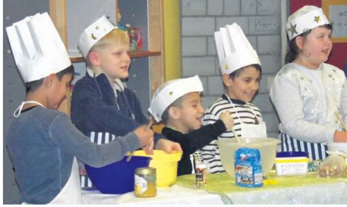
Nach dem »Sternfest« ging es in die Ferien.

TSR und die Aktionsgemeinschaft das Projekt auch in der Weihnachtszeit 2017 fortzuführen. Bis dahin solle aber noch ein wenig an den Stellschrauben gedreht werden. So könnten die Lesezeiten allgemein nach hinten verschoben werden. Die früheren Lesungen könnten dann vermehrt in der Innenstadt angeboten werden, die späteren im »seemaxx«. Entschieden sei darüber aber noch nichts, betonte Behrens. Vielmehr wolen TSR und Aktionsgemeinschaft im Frühjahr über die Änderungen beraten. Und damit für jeden Geschmack etwas dabei ist, bietet die Stadtbibliothek jeweils um 11 und 15 Uhr mit dem Kindertheater »Weihnachtliches Allerlei« und »Mama Muh feiert Weihnachten« ein lustiges Unterhaltungsprogramm für kleine Gäste ab 3 Jahren mit Magie und Musik. Von 10 bis 12 Uhr spielt zudem die Lumpämusigg beim Pfarramt auf dem Marktplatz.