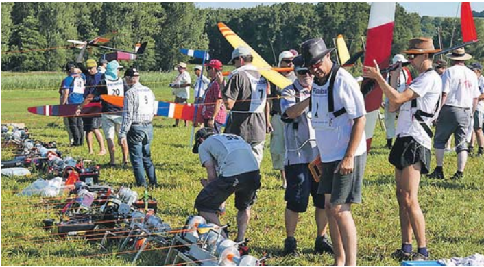
Die besten Piloten für Modell-Segelflugzeuge in Europa treffen sich am Wochenende in Binningen.