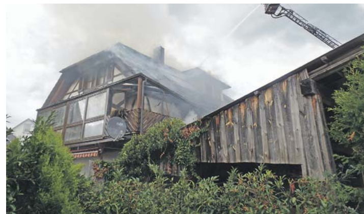
Das Wohn- und Geschäftshaus in der Schwarzwaldstraße ist nicht mehr bewohnbar.