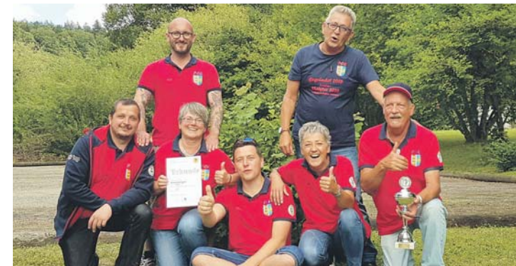
Weiter auf Erfolgskurs: der Pétanque-Club Gottmadingen.