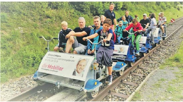
Viel Spaß hatten Kinder und Begleiter bei der Schienenvelo-Fahrt.