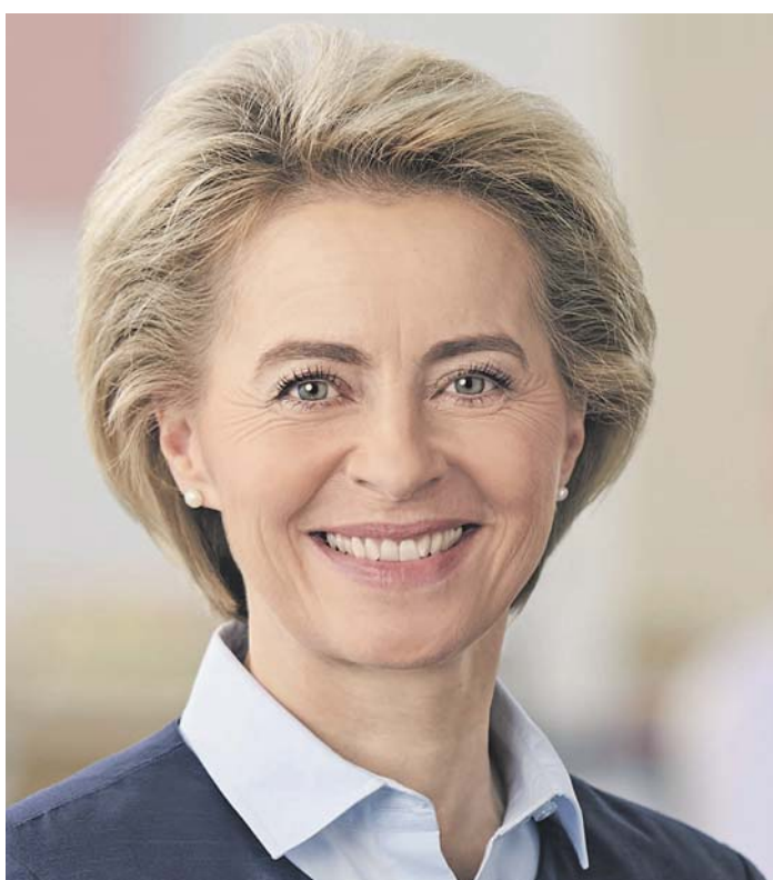
Verteidigungsministerin Ursula von der Leyen.