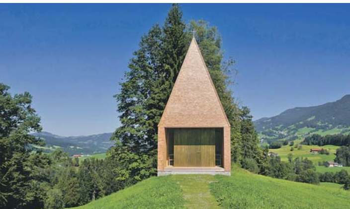
Besondere Architektur: die Kapelle Salgenreute in Krumbach im Bregenzer Wald.