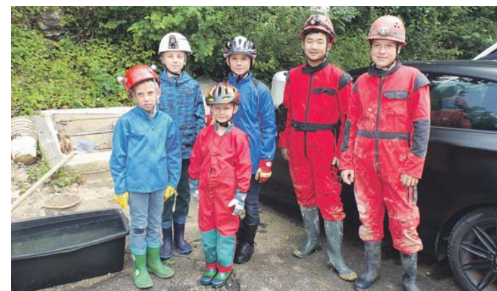
Die kleinen Höhlenforscher erkundeten die Blätterteighöhle.