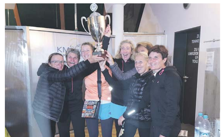
Überschwänglich feierten die Damen 50 des TC Singen ihren Deutschen Meistertitel mit dem Pokal.