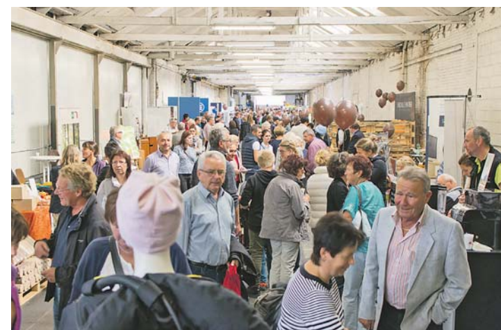
Volles Haus herrschte bei der Tischmesse.