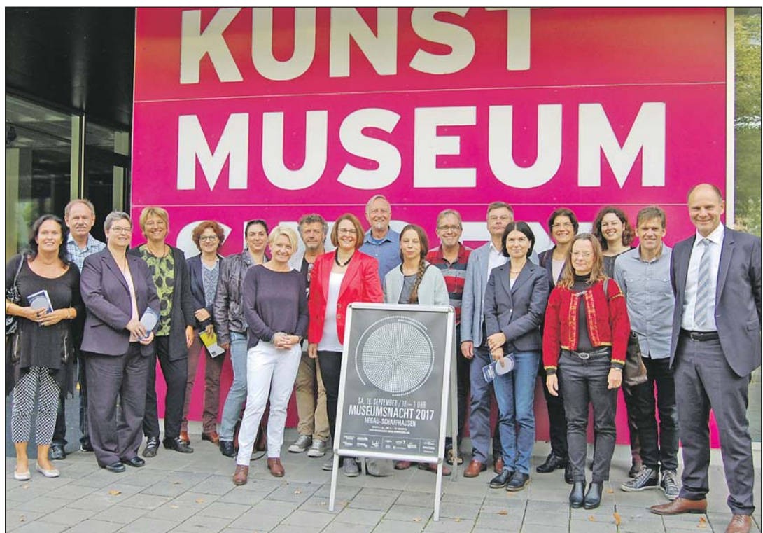
Die vielen Beteiligten der Museumsnacht sorgen für einen spannenden und abwechslungsreichen Kulturgenuss am 26. September von 18 bis 1 Uhr.