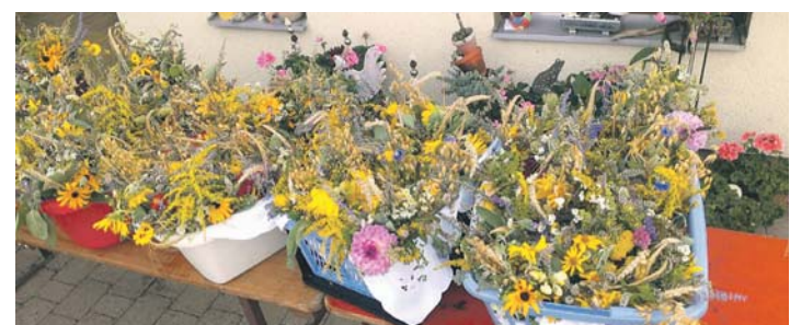
Bunte Pracht: Die Kräuterbüschel brachten über 450 Euro ein.