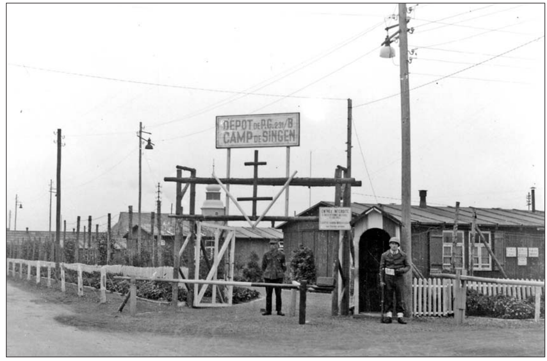
In der Nachkriegszeit wurde die Theresienwiese von der französischen Besatzungsmacht als Kriegsgefangenenlager genutzt.