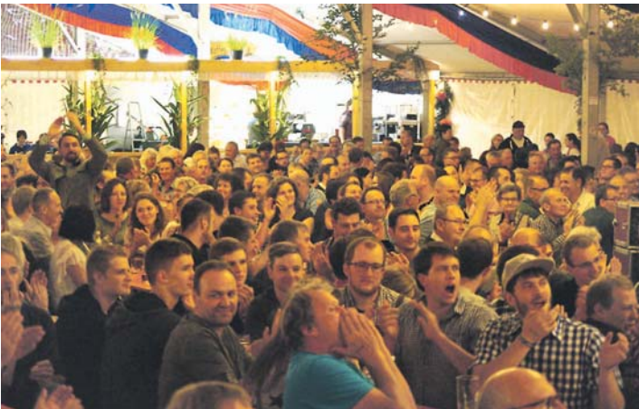
Das Herbstfest in Honstetten sorgte für Stimmung.