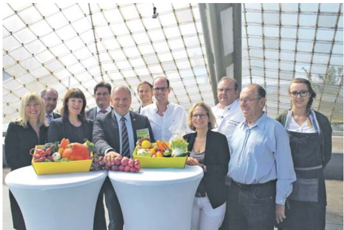
Große Freude bei den Verantwortlichen und Mitwirkenden: Das SWR1-Pfännle macht am 24. September Halt in Radolfzell am Konzertsegel.

Ihr Wochenblatt-Redakteur Matthias Güntert