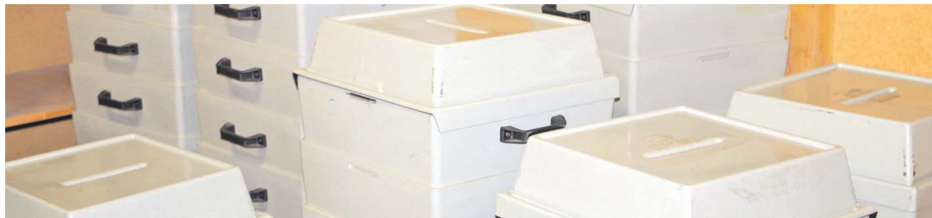
Noch lagern die Wahlurnen in den Rathäusern für den Wahltag am Sonntag. Weil die meisten Wahllokale in Schulen sind, können sie erst am Samstag eingerichtet werden. Tausende Wahlhelfer sind am Sonntag im Kreis im Einsatz.