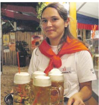
Wie die fleißigen Bienen umschwirren die vielen Servicemitarbeitenden ihre Gäste und lieben kaum Wartezeiten aufkommen.