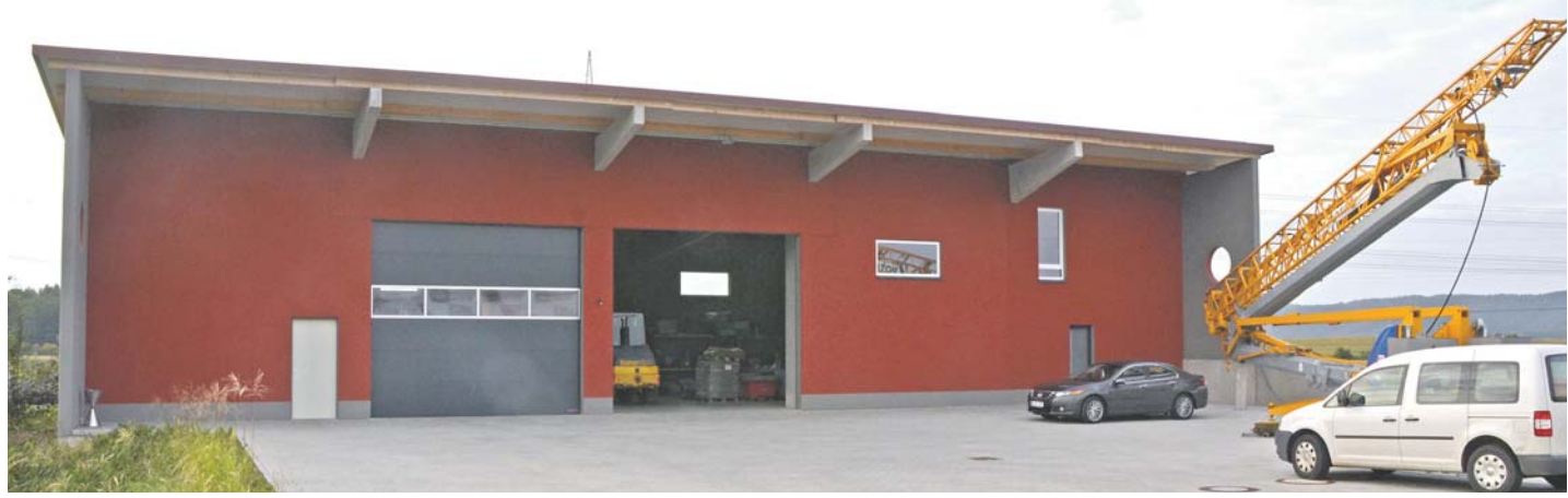
Die Firmenfarben spiegeln sich im neuen Firmensitz wider: Im Industriegebiet »Hardt« in Stockach ist der Neubau der Bau-Service GmbH entstanden.

Etwa 750 Quadratmeter Nutzfläche und gut 1.700 Quadratmeter Freilager stehen »BSG Bau« nun zur Verfügung. Und die werden auch gebraucht. Die Auftragslage ist ausgezeichnet, erklärt Ruben Walk, darum hat sich die Rohbaufirma, die im Hochbau für Maurer- und Betonarbeiten zuständig ist, zu der Investition von gut einer Million Euro entschlossen und in knapp dreimonatiger Bauzeit den neuen Firmensitz verwirklicht. Lediglich die Büroräume im Untergeschoss müssen noch eingerichtet werden, sonst ist alles fertig. Im Erdgeschoss befinden sich die Sozialräume und die große Halle für Gerätschaften und Materialien, so Ruben Walk, der auch die zentrale Lage im Industriegebiet »Hardt« zu schätzen weiß. Der Einzugsbereich der Firma umfasst die Raumschaft Stockach sowie Radolf-