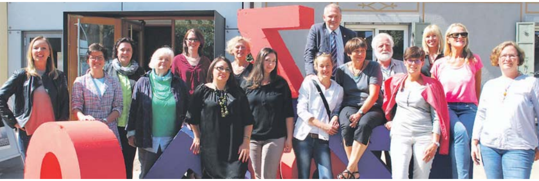
Ein Teil der beteiligten Künstlerinnen und Künstler posieren noch ein letztes Mal mit den Vertretern der Stadtverwaltung vor dem »R750LFZELL« Schriftzug.