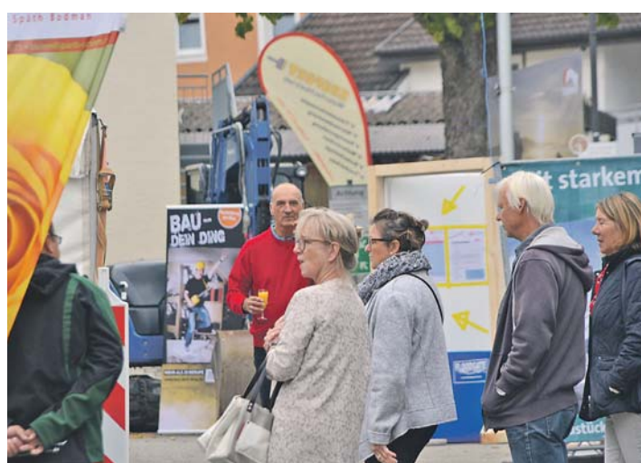
Die Produktvielfalt in der Region wurde beim »Gewerbepanorama« in Ludwigshafen präsentiert.