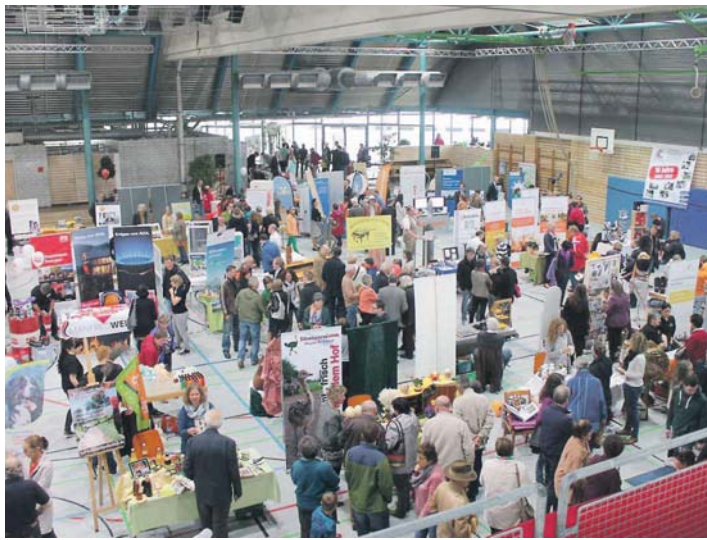
Zum achten Mal wird am Sonntag, 15. April, eine Tischmesse in der Stockacher Jahnhalle auf die Beine gestellt. Anmeldungen nimmt die Stadt schon jetzt entgegen.