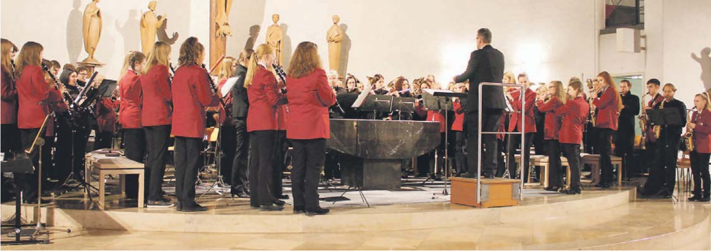
Die 140 Musiker der Stadtkapelle und der Jugendmusikschule schöpfen das Klangvolumen der St. Meinradskirche voll aus.