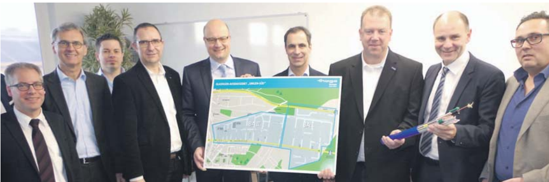
Ein Plan, 25 Kilometer Kabel und viele entschlossene Anpacker: nach zehn Jahren Diskussion gibt es endlich den Turbo bei der Datenübertragung im Singener Süden.