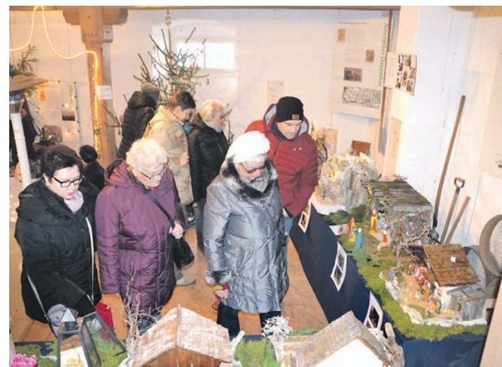
Sehenswert: Die Krippenausstellung in der Remise.