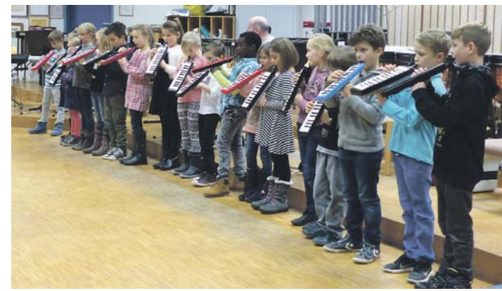
Melodicakinder der hiesigen Grundschulen beim Herbstvorspiel der Musikschule.