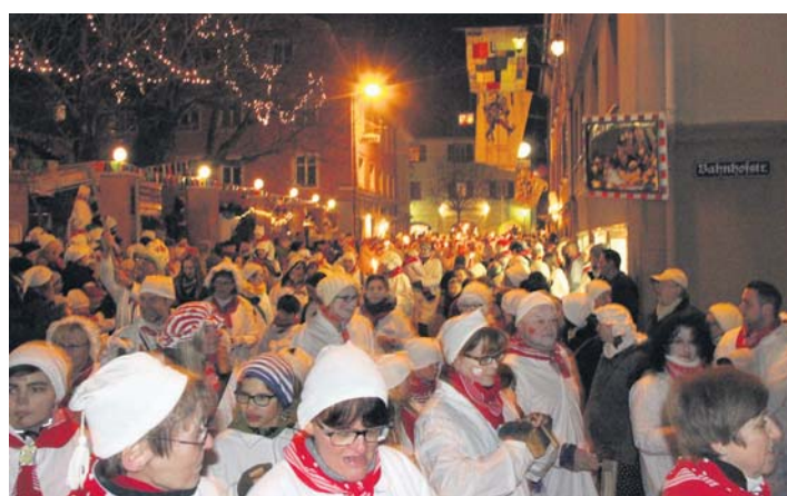
Positiv blickten die Mitglieder der »Narrizella« bei ihrer Jahreshauptversammlung in die Zukunft. Trotz des leidigen Themas der GEMA bleibt der Hemdglonker-Umzug einer der Erfolgsgaranten.