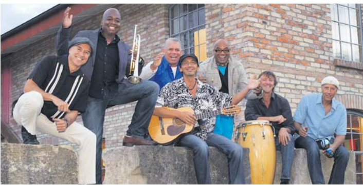
Die international besetzte Band »Son Pa Ti« wird die Besucher am Abend mit handgemachter kubanischer Musik in Stimmung versetzen.