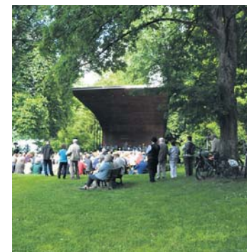
Auf großes Interesse stieß der Himmelfahrtsgottesdienst im vergangenen Jahr.