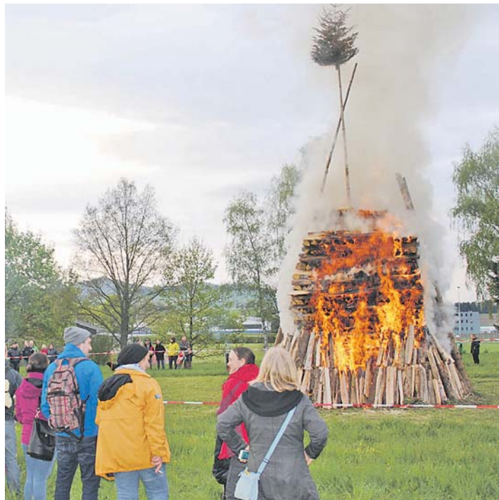
Der Osterfunken des Musikvereins Bietingen war in diesem Jahr an die sechs Meter hoch. Als Spitze diente der seit Fastnachtsdienstag eingelagerte Narrenbaum.

Mit der Hilfe der Randegger Feuerwehr wurden sechs große Wagenladungen Borkenkäferholz aus dem Wald geschleppt und beim Sportplatz aufgeschichtet. Die Spitze des Funken war der seit Fastnachtsdienstag eingelagerte Narrenbaum. Vorbereitet wurde der