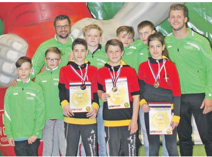
Die erfolgreichen Nachwuchsringer des KSV Gottmadingen.