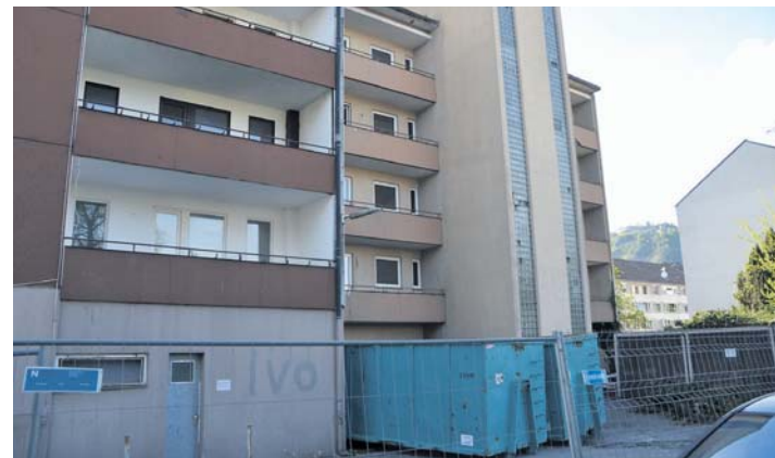
Im Vorfeld des Rückbaus des ehemaligen Hotel Continentale haben die Abrissarbeiten für den Anbau in der Hauptstraße 2 begonnen.