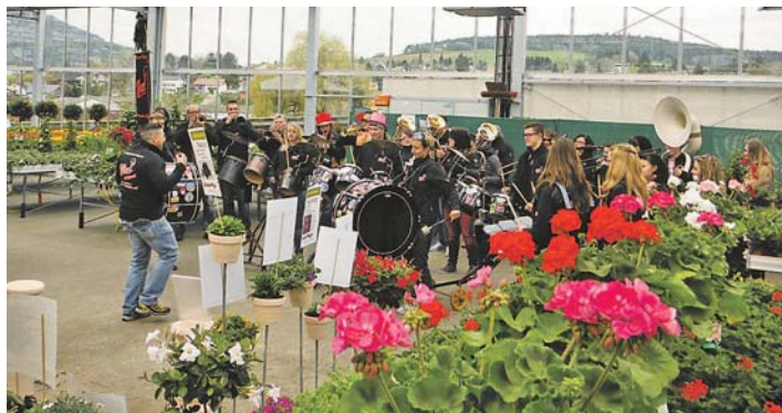
Beste Unterhaltung und ein buntes Angebot gibt es am Erlebnissonntag im Altdorf.

Mit einem buntem Programm, flotter Musik, vielen Aktionen und kulinarischen Köstlichkeiten garantiert der 15. Altdorf-Erlebnissonntag in Engen am Sonntag, 23. April, beste Unterhaltung für Groß und Klein. Knapp 20 Teilnehmer werden im westlichen Stadtteil in Engen von 11 bis 17 Uhr zeigen, was sie zu bieten haben und ab 12 Uhr wird auch zum Verkauf geöffnet. Für beste Stimmung wird auch Pirmin Wäldin in der