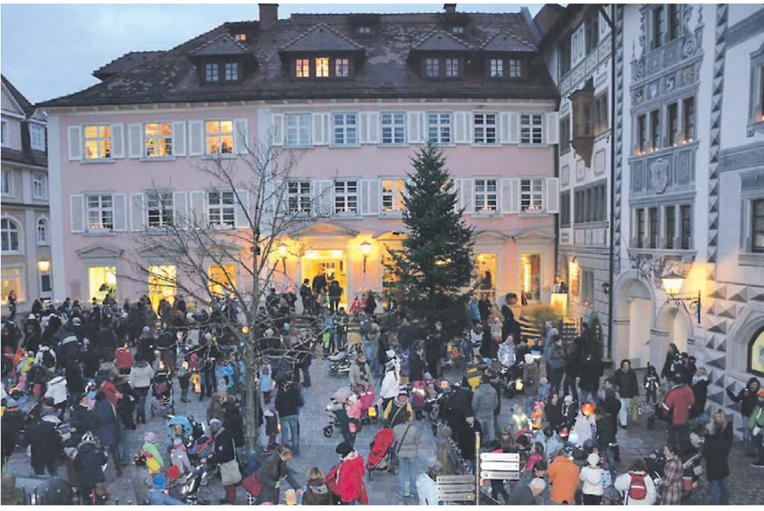
Tausende Kerzen und Lichtobjekte erhellen die malerische Altstadt Engens, wenn am Donnerstag, 16. November, von 17 bis 20 Uhr zum traditionellen Lichterabend in die Altstadt nach Engen eingeladen wird. Die Altstadt wird von 16.30 bis 20 Uhr für Autos gesperrt, so dass Eltern mit ihren Kindern ungestört bummeln und genießen können. Die Einzelhandelsgeschäfte haben an diesem Abend bis 20 Uhr geöffnet und kleine Überraschungen parat. Um 17 Uhr startet der Laternenumzug ab dem Marktplatz. Weitere lohnenswerte Stationen sind in der Stadtkirche, im Türmle, in der Stadtbibliothek, im Sudhaus und im Museum.