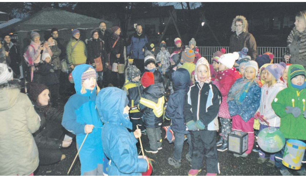
Mit großer Freude und Begeisterung eröffneten die Kindergartenkinder am vergangenen Freitag in Volkertshausen den ersten Martinimarkt in der Gemeinde mit einem temperamentvoll vorgetragenen Begrüßungslied. Die gute Laune der Kinder übertrug sich anschließend schnell auf die Besucher und die Veranstalter, sodass man durchaus von einem gelungenen Start reden konnte.