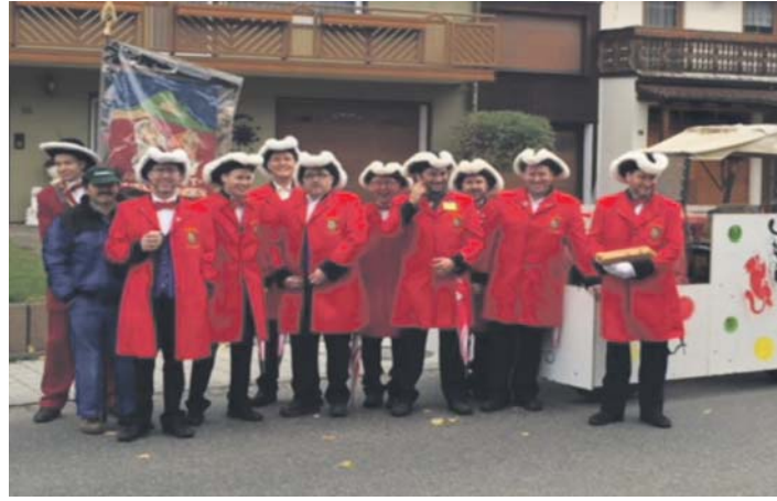
Der 11er Rat und der Fähnrich zogen am 11.11 mit dem Festwagen vom Narrentreffen 2016 durch das Rollidorf Welschingen.

Anschließend folgte ein kurzer Ausflug in die Vergangenheit mit Videos vom Narrentreffen 2016 und vom Gardeauftritt. Als krönenden Abschluss ließ Zunftmeister Kohler dann aus den 14 Vorschlägen zum närrischen Motto 2018 abstimmen und ganz im Italienfieber wurde das Motto »Der Rolli auf großer Fahrt, La Dolce Vita naht« mehrheitlich ausgewählt. redaktion@wochenblatt.net