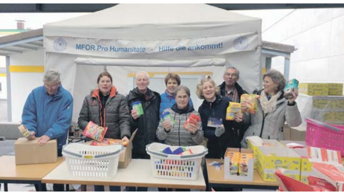
Die fleißigen Helferinnen und Helfer die für den Verein Pro Humanitate am Freitag Hilfspakete für die Republik Moldau packten.