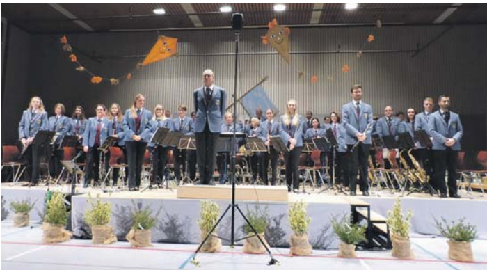
Der Musikverein Steißlingen beim Konzert 2016.