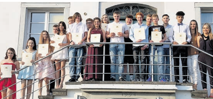
Voller Stolz nahmen die Abschlusschüler der Hochschule Gailingen ihre Zeugnisse entgegen. sub-Bild: Schule