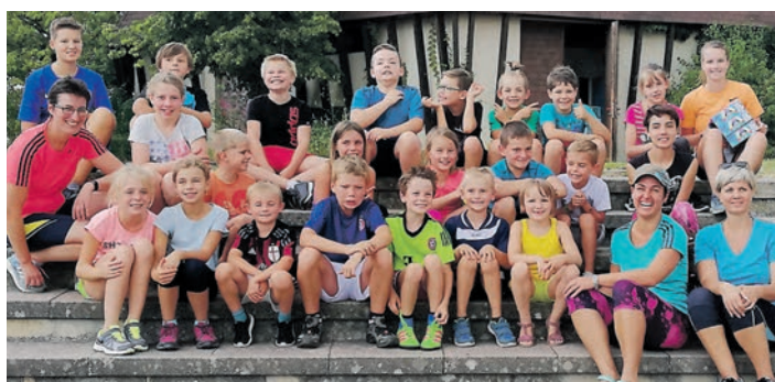
Die jungen Sportler freuten sich mit ihren Trainerinnen über ihre Leistungen beim Sportabzeichen.