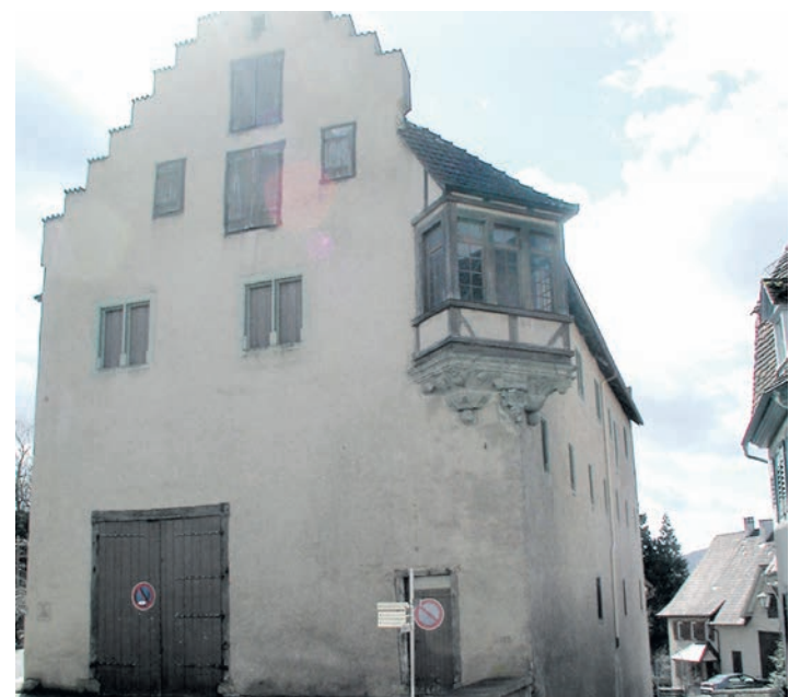
Das Kornhaus soll nach dem Wunsch der Bürgerwerkstatt belebt werden, damit auch in der wunderschön sanierten Altstadt mehr los ist.