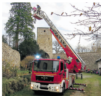
Die Feuerwehr in Möggingen probte den Ernstfall.