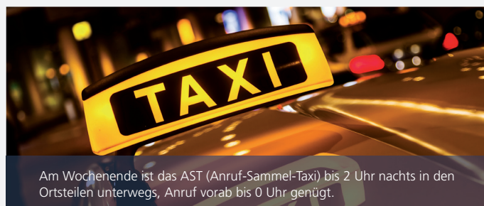
Am Wochenende ist das AST (Anruf-Sammel-Taxi) bis 2 Uhr nachts in den Ortsteilen unterwegs, Anruf vorab bis 0 Uhr genügt.