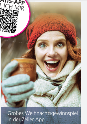
Großes Weihnachtsgewinnspiel in der Zeller App