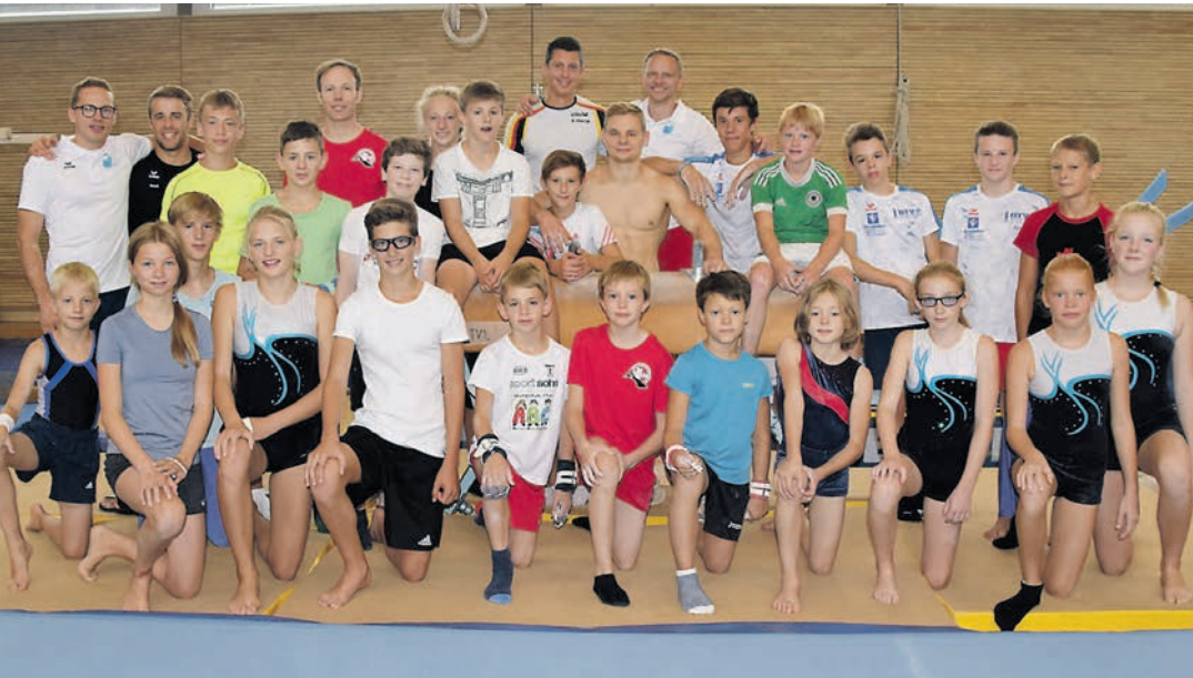
Fünf Stunden Turnen am Tag - sie machen es gern: Denn beim »Turncamp« des Turnvereins Ludwigshafen haben die Teilnehmenden richtig Spaß am Sport. sub-Bild: sw