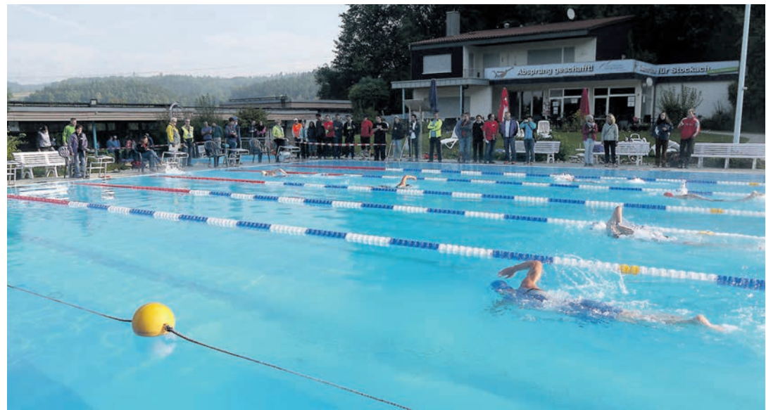
Der Stockacher Triathlon geht am Samstag, 8. September, im Osterholz über die Bühne. Anmeldungen sind nicht mehr möglich, aber Zuschauer sind willkommen.