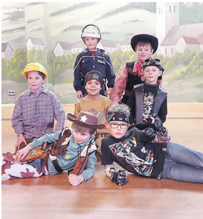
Nicht nur mit dem Song YMCA der »Village People« begeisterte der Nachwuchs der Welschinger Rollis sein Publikum am Kindernachmittag.

Mit dem Hit »YMCA« der »Village People« rockten dann die