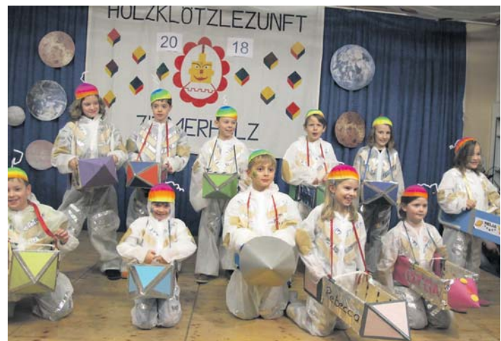
Die Weltraummäuse aus Zimmerholz.