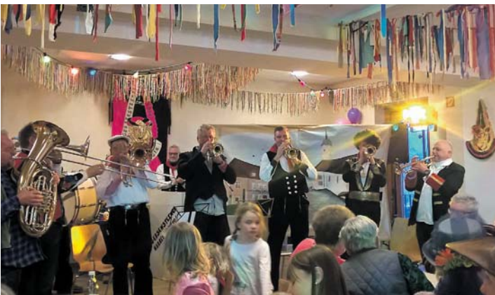
Extra für Fastnacht hat sich in Ebringen eine Truppe von Musikern zusammengefunden, die die Narren bei vielen Gelegenheiten bestens unterhielt.