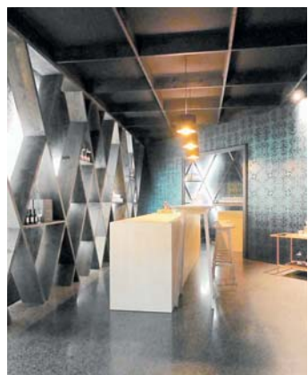
Der FöKuHei Gottmadingen bietet am 11. Januar 2020 Exkursionen.

Nach dem Mittagessen geht es weiter nach Rohrschach ins Forum Würth. Dort wartet eine umfangreiche Ausstellung mit Werken des im Februar 2019 verstorbenen Tomi Ungerer. Auch hier bringt eine Führung tiefere Einblicke in das Leben und Schaffen des Ausnahmekünstlers aus dem Elsaß. Es