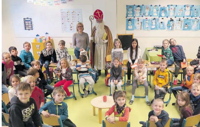
Von draußen vom Walde komme ich her ... und zwar dieses Jahr direkt in die Grundschule Engen. Der Nikolaus besuchte alle Klassen der Grundschule und sorgte mit auf die jeweilige Klasse zugeschnittenen Sprüche und kleinen Gaben wie Mandarinen, Äpfel und Nüssen für strahlende Kinderaugen.