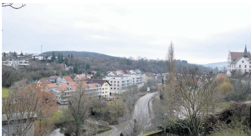
Um das Wohnungsangebot in Engen zu verbessern wurden in der Seestraße zwei Wohnkomplexe erstellt.

Daher stellte die CDU-Fraktion im Engener Gemeinderat eine große Anfrage über die Wohnungssituation in Engen, auf die Stadtbaumeister Matthias Distler detailliert einging. Auch in Engen sei der Trend zur verdichteten Bebauung besonders im Stadtkern unabdingbar und richtig, betonte Distler. Baulücken und leerstehende Gebäude seien knapp, daher werden in den nächsten Jahren die im Flächennutzungsplan enthaltenen Flächen bebaut werden. Dies sind in der Kernstadt etwa 13 Hektar und in den Ortsteilen gut elf Hektar. In den Ortsteilen werden in Engen neu 90 Wohnungen fertig gestellt und auf dem Wohnungsmarkt angeboten. Einhundert weitere sind im Bau und geplant sind 140 Wohnungen mit ein- bis vier-Zimmern. Am beliebtesten sind