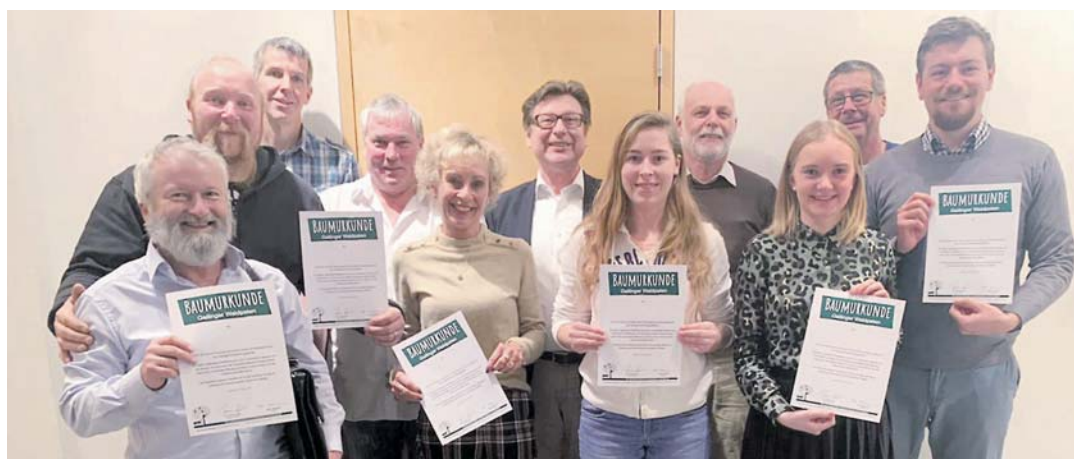
Der Gemeinderat Gailingen wirbt für Waldpatenschaften.