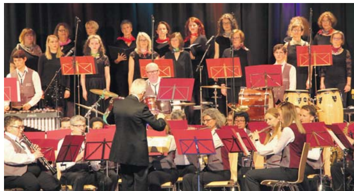
Die »Klangfarben« begeisterten in Gailingen.

Der Musikverein Gailingen und das Vokalensemble »Klangfarben« aus Gottmadingen überzeugten bei ihrem gemeinsamen Konzert in der Hochrheinhalle Gailingen ein aufmerksames Publikum mit ihren Klängen aus Instrumenten und Stimmen.