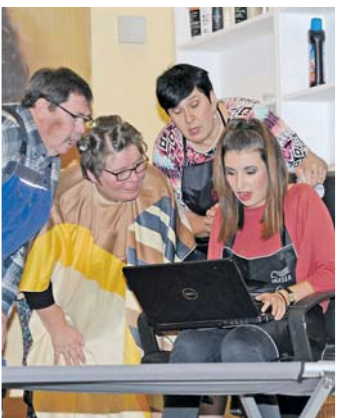
Eine Szene vom letztjährigen Theaterstück.