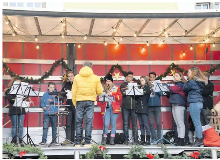
Verschiedene musikalische Beiträge sorgten mit Weihnachtsmelodien für einen besinnlichen Nachmittag.