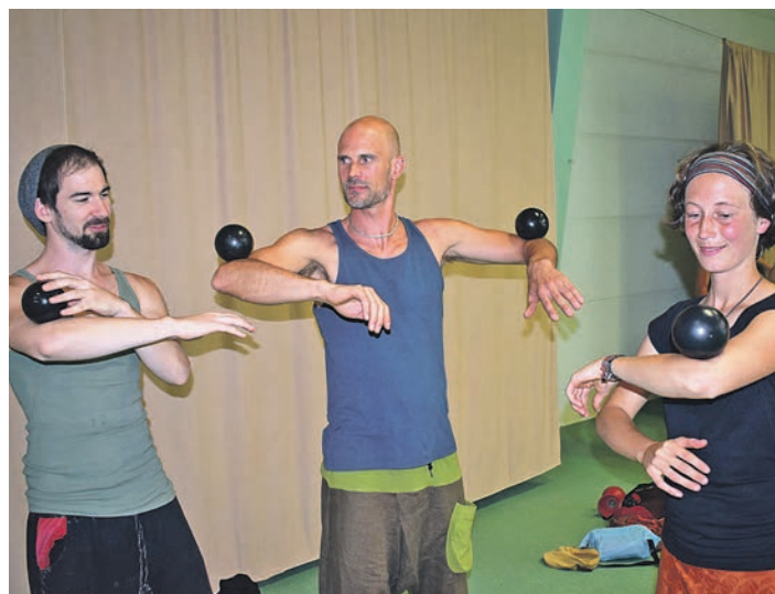
In der Tennishalle und auf dem Areal vom Turnerheim wurde eifrig trainiert, viele Workshops organisiert und ein buntes Showprogramm zusammengestellt.

Zahlreiche Jongleure und Freizeitakrobaten, darunter einige »Profikünstler«, trafen sich am Pfingstwochenende zur alljährlichen Jongleurconvention in der Unterseemetropole. Die Teilnehmer kamen aus Süddeutschland, der Schweiz und aus Österreich. Einige Weltenbummler reisten aus dem weiteren europäischen Ausland nach Radolfzell um in Ruhe zu trainieren und sich mit vielen Gleichgesinnten zu treffen. Der Event war ein reines Freundschaftstreffen. Im Mittelpunkt stand das gute Miteinander, voneinander und miteinander lernen sowie jede Menge Spaß. Die Convention war ein Treffpunkt für Jung und Alt. Es gab keinen Level und keine Altersbeschränkungen. Jeder Teilnehmer war willkommen. Das oberste Gebot lautete: »Spaß an der Freude«. Der Radolfzeller Verein »Drop am See« zeigte sich verantwortlich für das Grundgerüst. Er sorgte für die Location und organisierte das Frühstück. Was sonst passierte, entstand durch die Teilnehmer selbst. Die Hauptkomponenten am Pfingst-Weekend waren das »Freestyle Juggling Turnier« und eine »Open Stage«. Beim Juggling Turnier zeigten viele Teilnehmer ihre Tricks, die von einer lockeren Jury bewertet wurden.