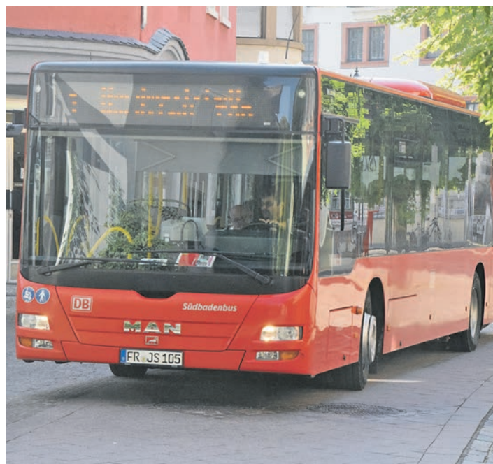
Das Ziel des Mobilitätsmanagements ist es, das Verkehrsverhalten im Radolfzeller Stadtgebiet positiv zu beeinflussen.

Einerseits soll die Nutzung von umweltfreundlicheren Verkehrsmitteln gefördert werden, andererseits sollen die vorhandenen PKW-Stellplätze auch den verschiedenen Nutzergruppen in angemessener Anzahl zur Verfügung stehen. Dem Parken im öffentlichen Verkehrsraum einen angemessenen finanziellen Wert beizumessen