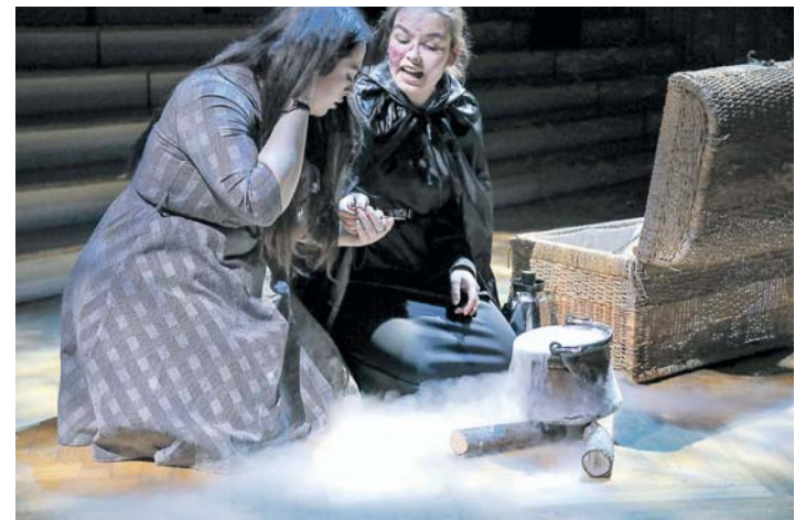
Die Theatergruppe am Hegau-Gymnasium präsentierte »Der goldne Topf«.

Das Stück springt zwischen zwei Welten hin und her, zwischen der Welt des Geistes und einem materialistisch-bürgerlichen Leben zur Zeit der Romantik. Diese für die Besucher schwierig zu verstehenden Sprünge meisterten die 18 Theaterspielerinnen und Spieler durch ihre hervorragende Spielweise und Interpretationsfreude. Seit September übten die Darsteller nahezu jedes Wochenende. So durften die Zuschauer in einer