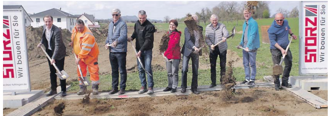
Mit vereinten Kräften wurde der Spatenstich für das Volkertshäuser Neubaugebiet Öhmdweg am Mittwoch vollzogen.