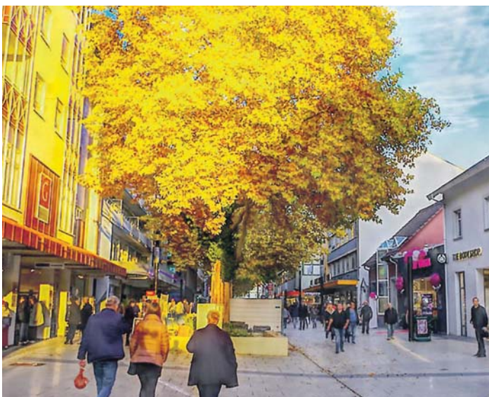
Einkaufsflair in der Hegastraße und ...

Inmitten der Bautätigkeiten hat die Stadt Singen erstmals an der Vergleichsstudie »Vitale Innenstädte« des IFH Köln teilgenommen, die zeitgleich an zwei Tagen Ende September 2018 in 116 deutschen Städten als Passantenbefragung durchgeführt wurde. Dabei wurde die von den Befragten wahrgenommene Attraktivität der Innenstädte