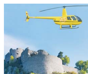
Mit dem Heli shoppen gehen geht am 5. Mai in Singen.

Wenn in ganz Singen die »IG Süd« am 5. Mai ihren 25. Geburtstag zur Leistungsschau mit einem verkaufsoffenen Sonntag versüßt, kann das ein Trio mit einem ganz besonderen Einkaufserlebnis verbinden. Denn HEM Expert Singen hat sich aus Anlass des Jubiläums mit weiteren Partnern etwas ganz besonderes ausgedacht. Das Gewinner-Trio nämlich wird an diesem Tag nicht nur von dem Helikopter persönlich abgeholt, es darf anschließend ganze 1.000 Euro gemeinsam bei HEM ausgeben