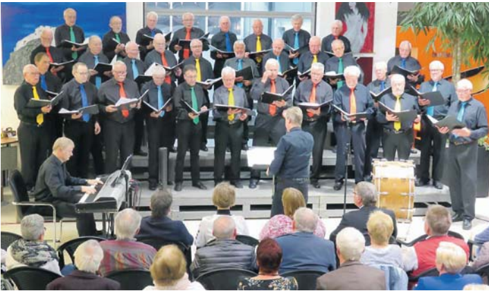
Unter dem Motto »Singen im Frühling« präsentierte der Männerchor Singen vor dem zahlreichen Publikum im Autohaus Bach die ganze Bandbreite seines Könnens.