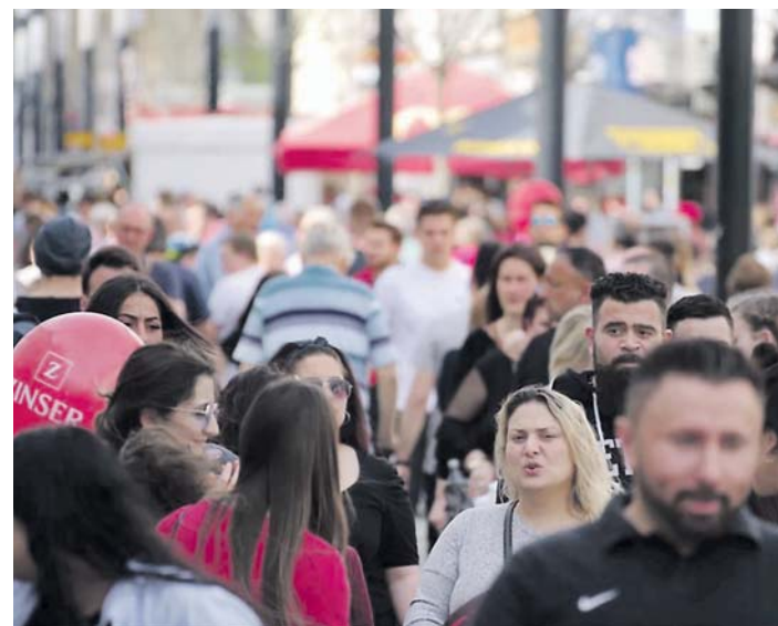
... eine hohe Frequenz in der Innenstadt. sub-Bilder: of/Archiv

trotz der guten Ausgangslage etwas ändern. Möglich ist dies in den Kernbereichen Ambiente und Einzelhandel – denn Shoppen bleibt für über 50 Prozent das Leitmotiv – sowie bei der Bequemlichkeit oder dem Erlebnischarakter. Es sei ein großer Nachteil nicht digital verortet zu sein, so Hedde. Schließlich wünschen sich 45,4 Prozent der Befragten in Singen online mehr Informationen über die Händler, wie etwa zur Verfügbarkeit der Ware vor Ort. Interessanterweise habe sich der früher praktizierte »Beratungsklausur« umgekehrt. Kunden informieren sich vorher im Internet.