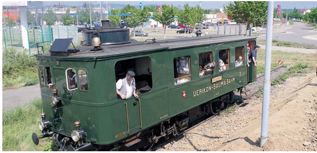
Die Fahrt mit der Museumsbahn endete 2018 noch am Kreisel - durch den Lückenschluss soll die Fahrt bis zum Singener Hauptbahnhof möglich sein.