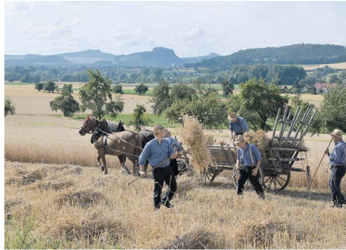
Das historische Mähen vor Bohlinger Sichelhenke.