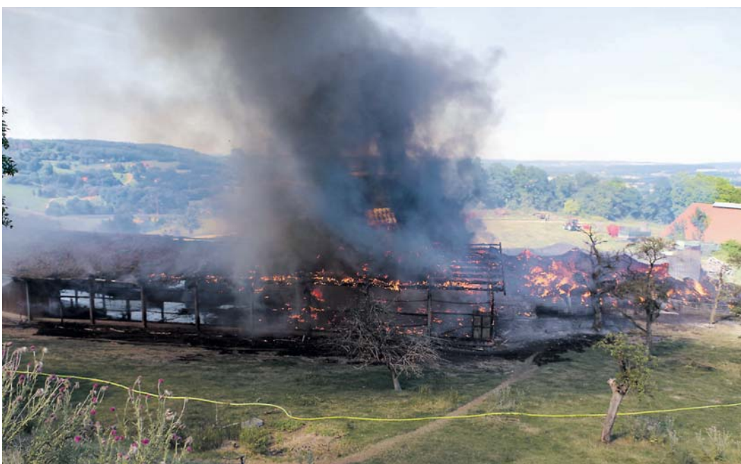
Der Schafstall auf der Domäne des Hohentwiels wird ein Raub der Flammen.

Dunkle Rauchwolken verhüllten am Dienstag nachmittag gegen 15.20 Uhr den Hohentwiel, wo am großen Schafstall bei der Domäne ein Feuer ausgebrochen war. Der Pächter, der den Brand selbst entdeckt hatte, versuchte noch den Brand zu löschen, doch dieser Versuch war zwecklos.