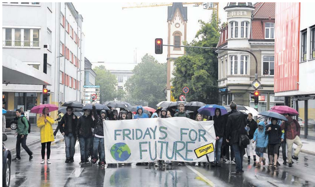
Fridays For Future Singen bei ihrem Demonstrationszug am vergangenen Freitag auf der abgesperrten Freiheitsstraße vom Rathaus zum Heinrich-Weber-Platz.