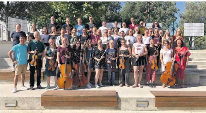
Das Orchester des Hegau-Gymnasiums war beim 24. Musikfestival in der Partnerstadt La Ciotat.