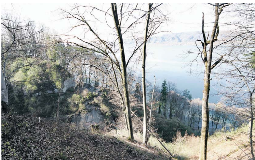
Die Marienschlucht bei Bodman-Ludwigshafen vor der Sperrung im Jahr 2015. Im Juni 2020 werden die Steganlage und der Wanderweg von der Schlucht nach Wallhausen saniert.

Die ersten Maßnahmen zur Wiedereröffnung der Marienschlucht bei Bodman-Ludwigshafen sollen im kommenden Jahr konkret werden. Der Gemeinderat einigte sich auf die Unterstützung des Neubaus der Schiffssteganlage sowie des Wanderwegs von der Schlucht nach Wallhausen.