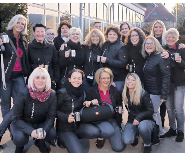
Die Damengruppe der Schalmeien Weibsen Stockach ließ es sich bei ihrem Ausflug in den Schwarzwald gutgehen.