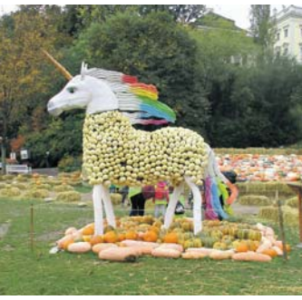
Bei der Kürbisausstellung in Ludwigsburg waren beeindruckende Fruchtskulpturen wie dieses Einhorn zu bestaunen.

Die VdK-Mitglieder bewunderten die kunstvollen Skulpturen aus Kürbissen, die dort ausgestellt wurden. Ebenso war der Märchengarten mit seinen Fan-