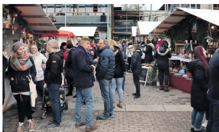
Zahlreiche Besucher ließen sich beim Martinsmarkt von besinnlicher Stimmung vereinnahmen.