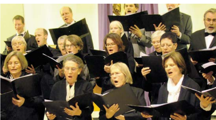
Der Kammerchor Stockach singt am 17. November.