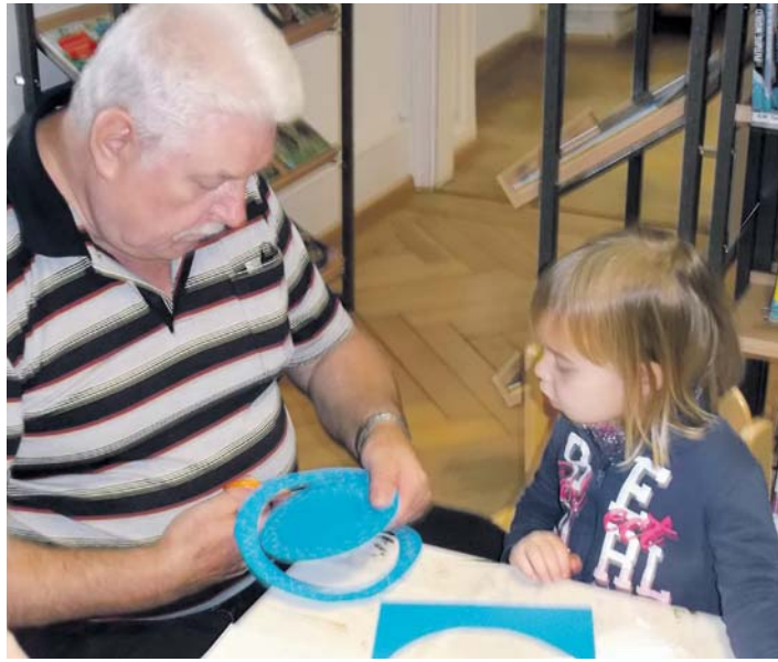
Nach der Lesestunde in der Stadtbücherei Stockach fand eine gemeinsame Bastelstunde statt.

Auf die kleinen Gäste in der Stadtbücherei Stockach wartete letzte Woche ein besonderes Leseprogramm. Anlässlich der Buchpräsentation von »St. Martin und der kleine Bär« mit anschließender Bastelstunde gab