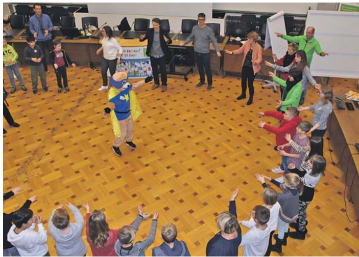
Bei der 1. Singener Kinderkonferenz wurde im Ratssaal der Kiosk-Tanz gezeigt.

Bürgermeisterin Ute Seifried erklärte daraufhin, dass allerdings die Stadt nur über begrenzte Haushaltsmittel verfüge, wie jedes Kind über sein Taschengeld, und man entscheiden müsse, wofür man das Geld ausgeben wolle, so Seifried. Dass die Stadtverwaltung, die Kinderwünsche ernst nimmt, zeigte sich schon daran, dass aus jeder Abteilung die Verant-