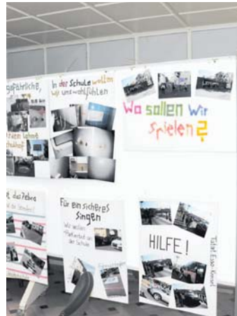
Wünsche von Singener Schülern – hier ein Beispiele der Waldeck-Schule.