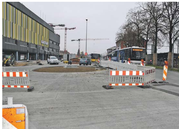
Der Kreisverkehr an der Erzbergerstraße steht kurz vor der Freigabe für den Autoverkehr. Dieser soll ab Donnerstagabend, 28. November, den neuen Kreisverkehr befahren können.