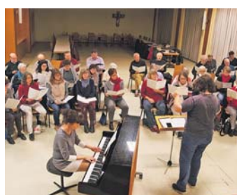
Probe zur Aufführung von Telemanns Magnificat in der Lutherkirche.

Am 1. Advent führen die Lutherkantorei und der Katholische Kirchenchor St. Peter und Paul das Magnificat in C von Georg Philipp Telemann auf.