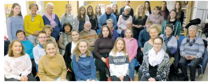
Seit Wochen proben die NachwuchssängerInnen der JMS westlicher Hegau mit dem Stadtchor Engen gemeinsam.

Seit Jahrzehnten präsentiert die Jugendmusikschule Westlicher Hegau außergewöhnliche Konzerte zum Advent. Am Sonntag, 1. Dezember, lädt sie ab 17 Uhr (Einlass ab 16 Uhr) in Kooperation mit dem Stadtchor Engen zu einem Adventskonzert der besonderen Art in die Kirche St. Stephan in Arlen ein. Dabei werden große Chöre, Solisten, die Orchesterabteilungen aus den Streicher- und Bläserbereichen, der Instrumentalverein,