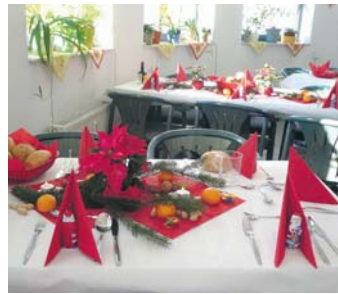
Die Singener Tafel lädt zur festlich geschmückten »Tafel« ein. sub-Bild: Tafel