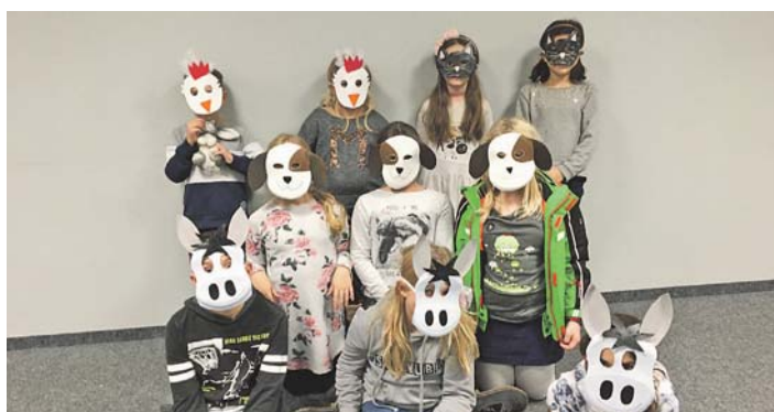
Schüler vom Akkordeon-Spielring, Schüler des Chores der Hardbergschule Worblingen und Schüler des Hebelschulchores Arlen.