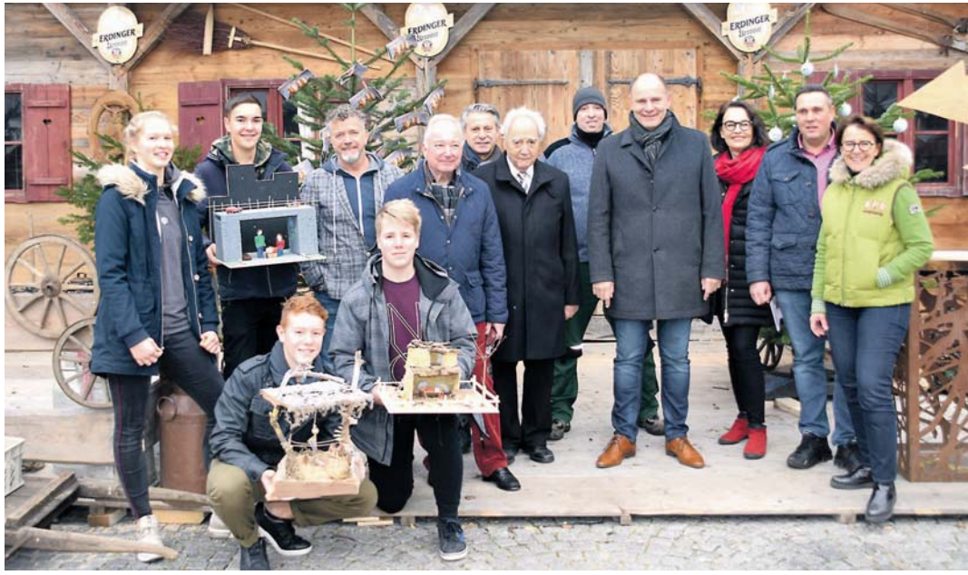
Freuen sich auf eine stimmungsvolle Adventszeit in Singen.