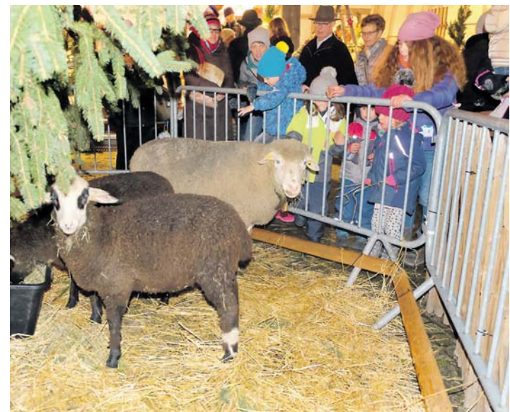
Auch der »Streichelzoo« ist wieder beim Steißlinger Weihnachtsmarkt vertreten.

Musikvereins wie die Alphornbläser aus Beuren. Wer dann auf dem anstrengenden Parcours durch die vielen Angebote des Weihnachtsmarktes eine Stärkung braucht, für den gibt es heiße und kalte Getränke, Bratwurst, Dünnele und vieles mehr. Das Wichtigste gibt es dabei ganz umsonst, das gute, persönliche Gespräch mit Nachbarn und Freunden, die man lange nicht gesehen oder mit denen man lange nicht gesprochen hat.