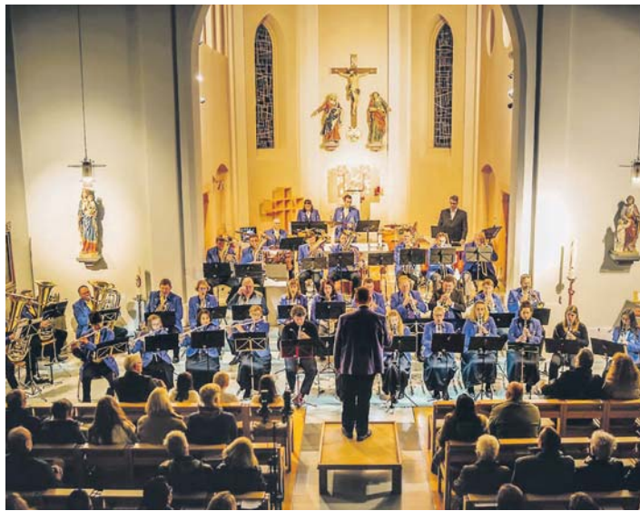
Der Musikverein Überlingen spielte in der Hl.-Kreuz-Kirche.

Glanzvoll eröffnet wurde das Konzert mit dem festlichen Stück »Fanfare for the Glorious Naycart«. Die Komposition »First Suite in Es«, folgte anschließend. Bis heute hat dieses Stück aufgrund seiner Instru-