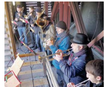
Die Turmbläser von Herz-Jesu.