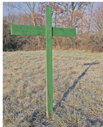
Mit grünen Kreuzen mahnen die Bauern in der Region ihre bedrohte Zukunft an. sub-Bild: of

Das Volksbegehren Artenschutz unter dem Titel »Rettet die Bienen«, das im September durch die Naturschutzverbände gestartet wird, läuft formell noch bis zum 20. März 2020, obwohl die Organisatoren inzwischen ihre Mobilisierung gestoppt hatten. Dafür hatte unter anderem massiver Protest der Bauern und Bauernverbände gesorgt, die mit Grünen Kreuzen auf ihren Feldern ein Ende ihres Berufsstands ankündigten, sollten vor allem die Forderungen nach radikalen Einschränkungen beim Pflanzenschutz umgesetzt werden. Dagegen haben die Bauern selbst zur Gegenbewegung mit vielen Aktionen auch hier in der Region angesetzt, zuletzt mit »Smartmobs« und Traktorenkolonnen bis zum großen Aufmarsch in Berlin. Die Landesregierung hat derweil ihr Eckpunktepapier dagegengesetzt, aber stoppen kann man ein Volksbegehren deshalb nicht.