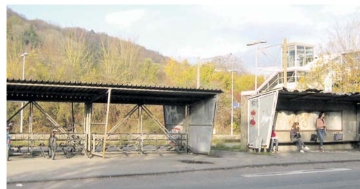
Gegenüber des Rathauses ist ein Radhaus geplant.

Im Ausschuss für Technik und Umwelt wurde ein Pflichtenheft für eine Mehrfachbeauftragung zusammengestellt. Als Standort für das Fahrradhaus ist der Bereich zwischen Bahnhof und Park+Ride-Parkplatz vorgesehen. Das Radparkhaus soll durch zwei große Bäume eingefasst werden; einer davon ist die Esche neben dem Treppenhaus des Bahnüberquerungsbauwerkes, die erhalten bleibt. Vor dem geplanten Gebäude sind zwei Bushaltestellen am nördlichen Fahrbahnrand der Johann-Georg-Fahr-Straße geplant. Gut 80 Abstellplätze für Fahrräder sind im Radhaus vorgesehen, das rund um die Uhr frei zugänglich sein soll.