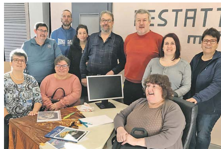
Die Laienspielgruppe des MGV Mühlhausen-Ehingen wartet am 4. und 5. Januar mit einem unterhaltsamen Lustspiel auf.