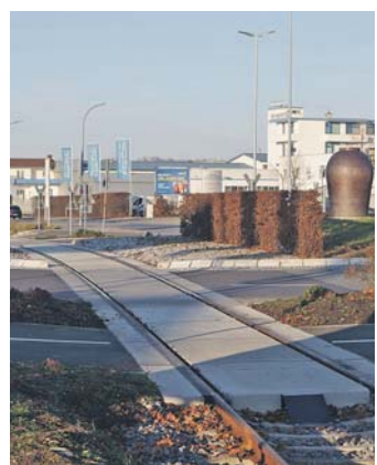
Seit September gibt es wieder das durchgehende Gleis am Volksbank-Kreisel in Singen Süd. Bis Züge fahren, wird es noch ein ganzes Weilchen gehen.

len. Noch in diesem Frühjahr soll ein Gutachten zur künftigen Struktur des Gesundheitsverbands in Gang gesetzt werden, für den in 2020 gar zweistellige Millionenverluste prognostiziert werden. »Wir brauchen ein umfassendes Angebot, aber nicht alles an jedem Ort«, ließ Landrat Zeno Danner zum Jahresende anklingen, dass es auch darum gehen muss, Kosten einzusparen und Personal noch effizienter einzusetzen.