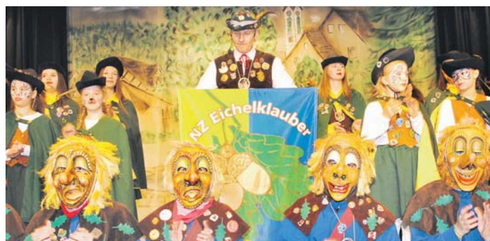
Die Eichenklauberzunft war wieder in Bestform.