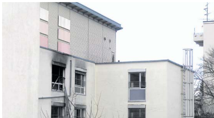
Die Spuren des Brandes im HJW sind deutlich zu erkennen.