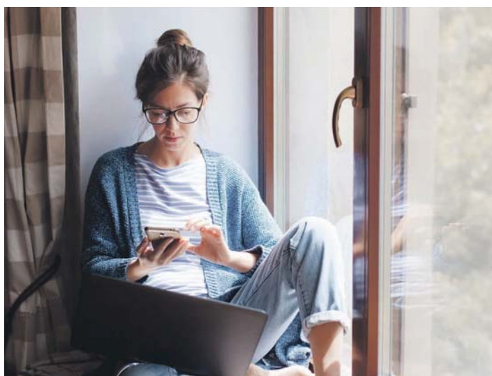
Soziale Kontakte via digitaler Medien pflegen ist in Zeiten der Corona-Krise mit ihren Ausgangsbeschränkungen besonders wichtig.